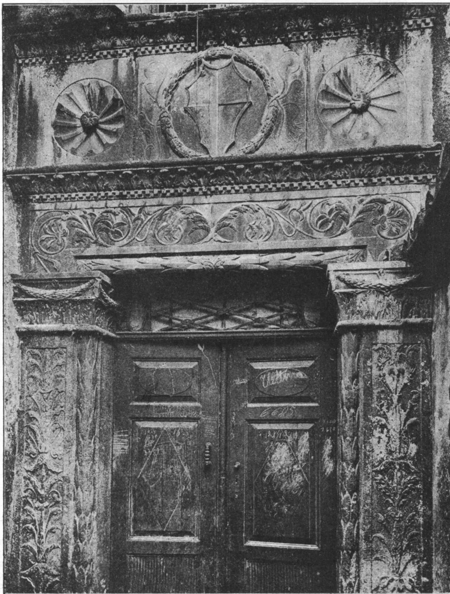
Vrata Lucijeve kuće u Trogiru. (Iz djela C. M. Iveković, Dalmatiens Architektur und Plastik . Wien 1910. Tab. 51.)

željnost stranaca i domaćih ljudi, koji, ulazeći u one odaje, gledaju poštanjem svaki kutić i razmišljaju o čovjeku, zadnjem muškom stanaru iz one obitelji, koji je svojim djelima toliko proslavio rodni grad i zadužio cio hrvatski narod. Na prvi mah izgled sa vanjske strane nema ništa osobita: moder-