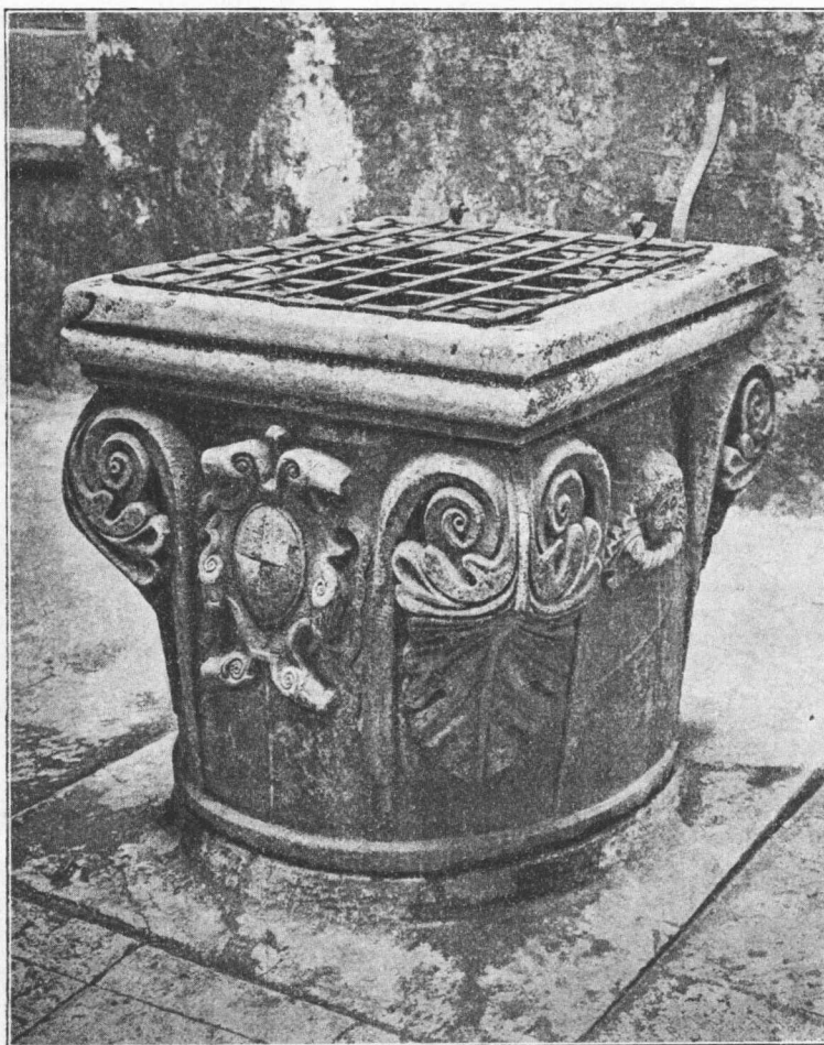
Krunište cisterne u Lucijevoj kući. (Iz djela Č. M. Iveković, Dalmatiens Architektur und Plastik. Wien 1910. Tab. 61.)

dimo na drugoj strani uz manastir koludrica Sv. Nikole na obali. Kula je dakle bila integralni dio Lucieve kuće, kako to on isto potanko pripovijeda u spomenutom djelu. Poslije njegove smrti prešla je u vlast potomaka njegove nećakinje Klare, u ruke naime još postojeće obitelji Cerineo-Lucio iz Splitske na Braču, od kojih su predi današnjeg vlasnika Demicheli kupili godine 1850. i udesili sve za stanovanje. Novi vlasnik Demicheli više je gledao na udobnost i na vanjski oblik, nego li na starinu i na uspomenu. U ono doba, razumljivo, nije postojao nikakav odbor za sačuvanje starina, niti kakovo »uresno povjerenstvo za grad«, pa je Demicheli mogao raditi po svojoj volji. Jedini, koji je ipak ustao proti nagrdivanju spomenika, bio je profesor dr. Don Ante Lubin, glasovit učenjak, te ga