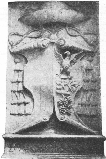
Grb Ivana Lucija-Stafilea, šibenskog biskupa, na jednom zidu terase u Lucijevoj kući u Trogiru.