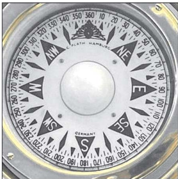
Sl. 2. Kompas je osnovni nautički instrument za navigacijsko vođenje broda

Fig. 2. Compass is a basic nautical instrument necessary for navigational handling of a vessel