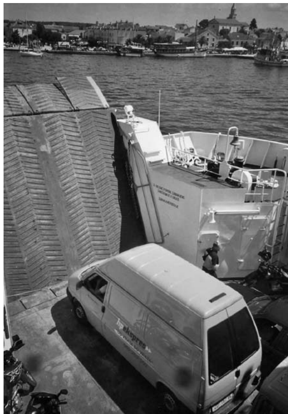
Slika 2. Poštansko vozilo na trajektu Figure 2. Postal vehicle on a ferry boat

dovima s pristajanjem u Malom Lošinj, Zadru, Šibeniku, Splitu, Hvaru, Korčuli, Dubrovniku i Kotoru povjeren je austrijskom Lloydu. Tijekom 1891. godine pošiljke su se prevozile na relaciji Rijeka – Malta – Tunis, a 1914. godine na liniji Rijeka – New York.