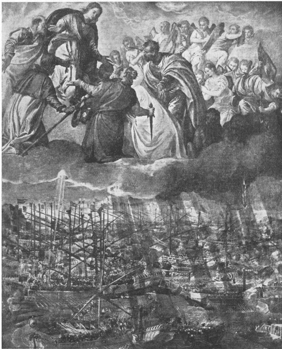
Paolo Veronese, La battaglia di Lepanto. (Venezia, R. Accademia di Belle Arti)