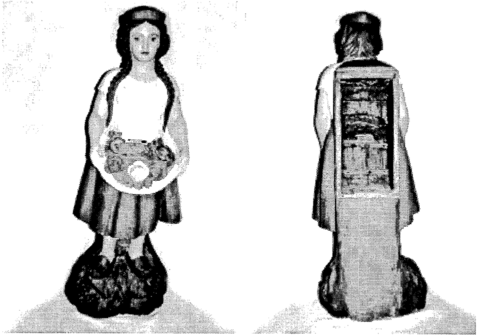
Abb. 4 - Figurenbienenstock. Vukovar. Museum von Turopolje in Velika Gorica.