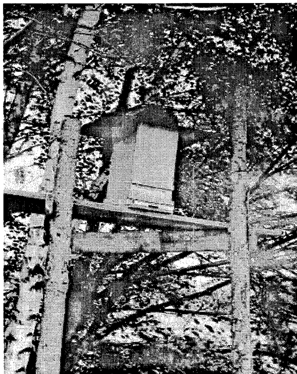
Abb. 6 - Bienenstock am Baum. Medak 1991.

Sie verläuft entlang der Elbe bis zur Saale, und dann der Saale entlang südwärts zwischen Kronach und Saalfeld bis zum oberen Main, südwestlich vom Fichtelgebirge und umfaßt den Reichswald und die Umgebung von Nürnberg sowie Nordbayern (Armbruster, 1926: 122 - 126). Diese Grenze wird auch von allen späteren Autoren übernommen, so daß B. Schier (1939: 46) die Grenze der Waldbienenzucht folgendermaßen bestimmte: Linus Sorabicus bis zur Donau, weiter südlich bis zu dem Böhmischem Wald und den Karpaten, dann entlang der südlichen Grenze der russischen Wälder unter Ausschluß der Ukraine.