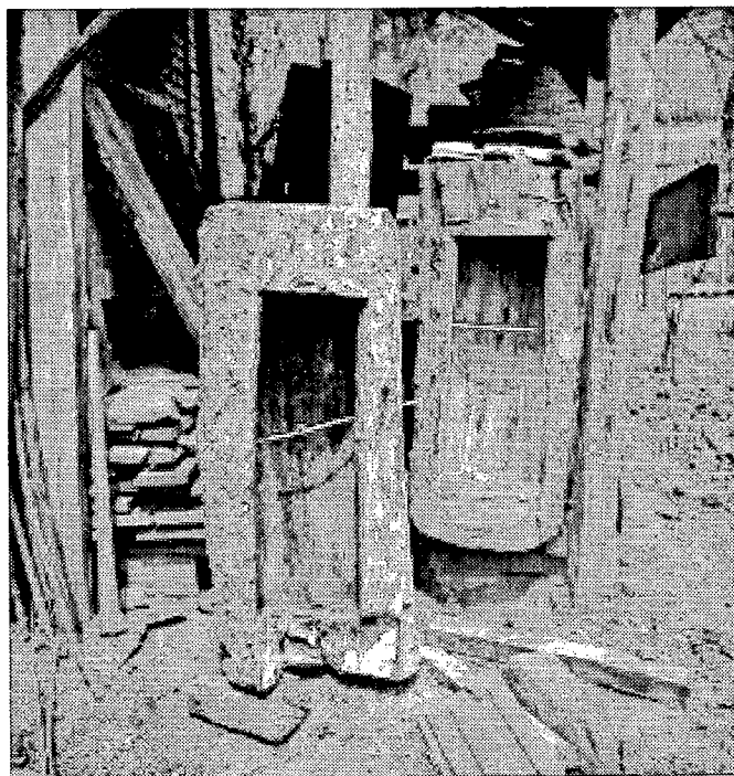
Abb. 3 - Stehende Klotzbeuten.