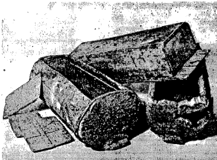
Abb. 2 - Slowenische liegende Klotzbeute. Sodobno čebelarstvo