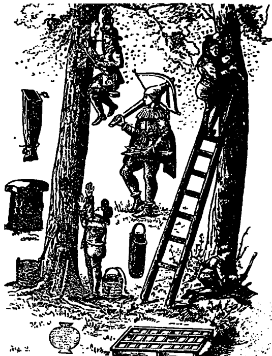
Abb. 1 - Ein Waldbaum mit der Bienenhöhle und die Bienenzüchter. Entnommen dem Buch von R. Mičičeta, Z dejin včelarstva na Slovenskom, Bratislava 1969.

Fangen der im Wald gefundenen Bienenvölker zur Ergänzung und Erneuerung des Bienenhauses. Bei der Waldbienenzucht suchte sich der Bienenzüchter zuerst einen Waldbaum aus, den er günstig für eine Baumbeute hielt. Dann stemmte er mit einer Axt oder einem Meißel eine viereckige Höhle am Baum aus, ohne das Baummark beschädigt zu haben, so daß der Baum auch weiterhin leben konnte (Bild 1). Diese Bienenhöhle ließ man dann eine Zeitlang offen, damit sie abtrocknete und von einem Bienenvolk bewohnt werden konnte. Der Imker mußte abwarten, bis in seine Beute die Bienen selbst eingeflogen sind. Deswegen durfte man zur Schwärmzeit den Wald nicht betreten. Erst nachdem die Schwärmzeit ausgelaufen war und als man glaubte, daß alle Bienenschwärme ihre Wohnhöhlen gefunden hatten, durfte der Bienenzüchter seine Baumbeute mit einem genau an die Höhle anliegenden Beutenbrett abschließen. An diesem Verschlusßbrett oder am Baum selbst wurde ein Flugloch ausgebohrt, um den Bienen ein Hinein- und Herausfliegen zu ermöglichen. Der Bienenzüchter pflegte an seinem Baum ein konventionelles Eigentumszeichen oder seine Initialen anzubringen. Häufig wurde die Baumkrone abgeschlagen, so daß ein solcher Baum immer dicker und größer wurde und dem Unwetter leichter widerstehen konnte (Armbruster, 1933; Bielenstein, 1907-1918; Jewsewjew - Erdödi, 1974; Krünitz, 1787; Linnus, 1939; u. a.).