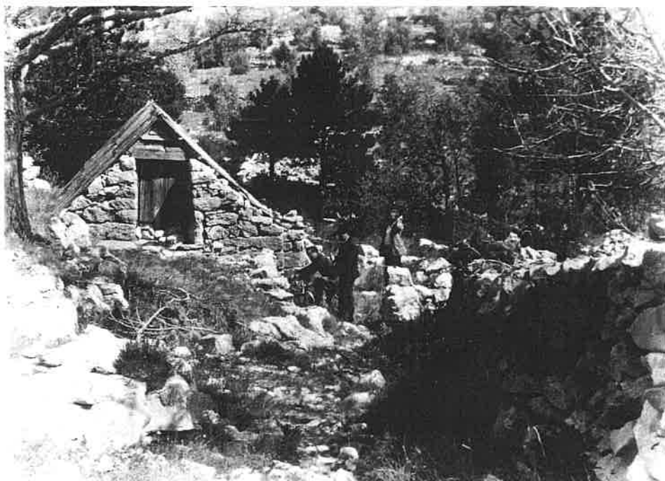
Sl. 2. Planinski stanovi u Mliništu na sjevernom Velebitu.

godinu. 10 Školske godine 1969./1970. ponovno se osnivaju dvije središnje škole sa sjedištima u Sv. Jurju i Senju. Sve seoske škole postale su područne škole, administrativno povezane sa školom u Sv. Jurju. Nije zabilježen ni jedan slučaj da je u tom razdoblju sagrađen učiteljski stan pa se i nije moglo očekivati da će se u područnim školama riješiti problem nastavnog osoblja. Stalna promjena učitelja znatnije se odražavala na ostvarenje temeljnih zadaća škole, no o tome se premalo vodila briga. Sudbina malih područnih škola i nadalje je ostala nesigurna, broj se djece smanjivao a njihov je opstanak ovisio isključivo o broju polaznika. Puni deset godina trebalo je proći, da se zatvori škole u Hrmatinama (1971.), u Oltarima (1977.) i Prizni (1978.). Da bi se to stanje prevladalo, mjerodavni školski čimbenici, u dogovoru s općinskim vlastima, dogovaraju treću reorganizaciju školske mreže pučkih škola na senjskom području, prema kojoj se osniva jedinstvena osnovna škola sa sjedištem u Senju. To je Osnovna škola S. S. Kranjčevića s područnim seoskim školama na čitavom senjskom području. Ona je počela djelovati pod tim nazivom 1. siječnja 1979. U tom