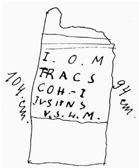
Slika 2. Skica zagubljenoga žrtvenika iz Sotina koji su Jupiteru posvetili Tračani iz I. kohorte Luzitanaca.

Figure 2. Sketch of the lost altar from Sotin dedicated to Jupiter by Thracians of cohorts I Lusitanorum.