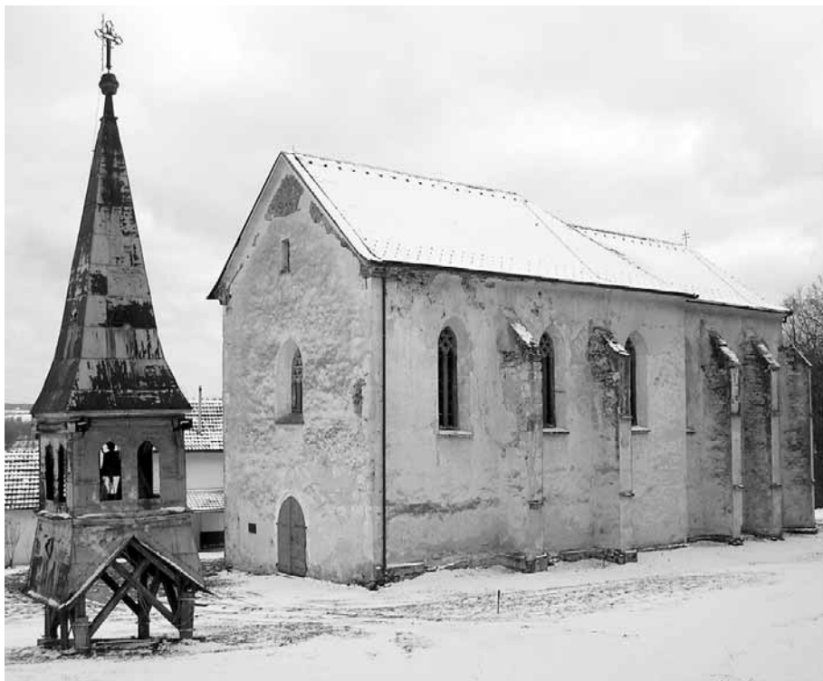
Pogled na crkvu danas, 19. 2. 2009.