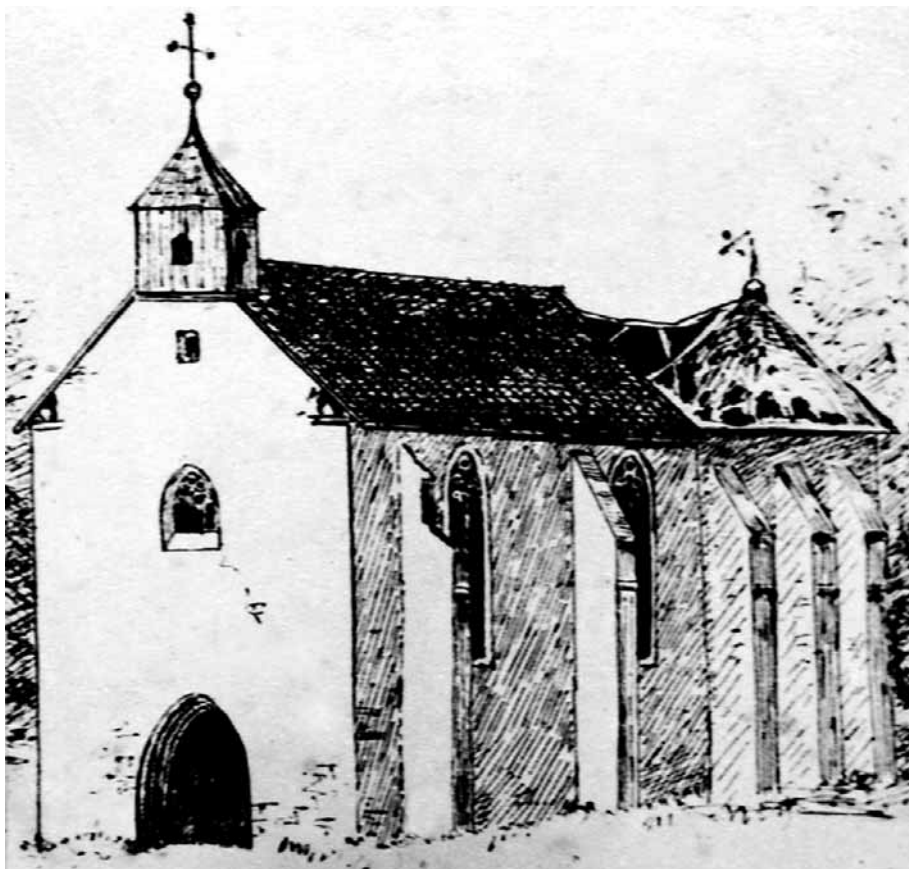
Sveta Ana u Bastajima sredinom 19. stoljeća