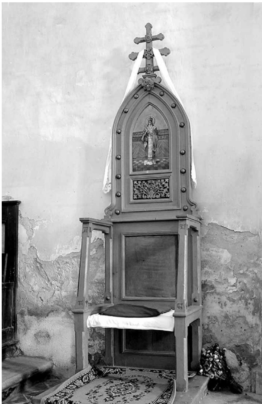
Vladičansko prijestolje danas, 19. 2. 2009.