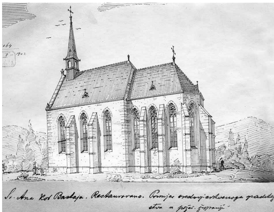
Vinko Rauscher (?), Projekt za historicističku restauraciju Svete Ane, 1902.