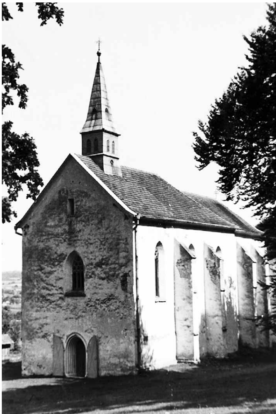
Crkva Svete Ane nakon restauracije 1904. – 1907.; Ministarstvo kulture, Uprava za kulturni razvitak, Odjel za informacijsko-dokumentacijske poslove kulturne baštine (fototeka – Sveta Ana)