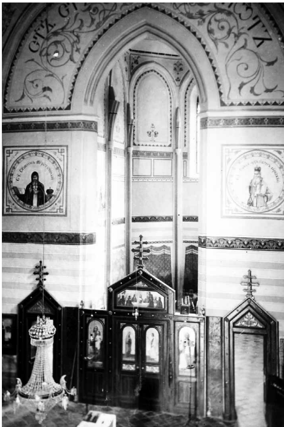
Unutrašnjost crkve Svete Ane nakon obnove 1904. – 1907.