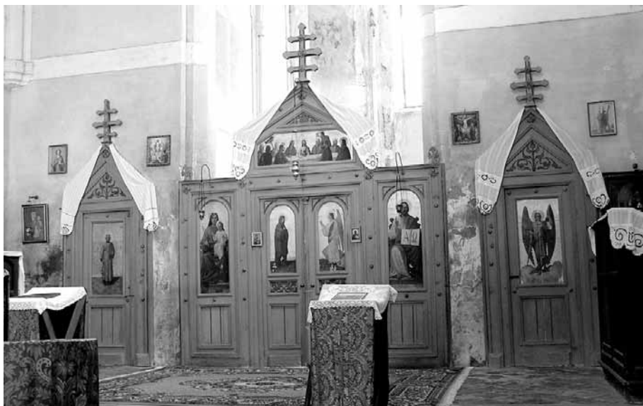
Ikonoostas crkve danas