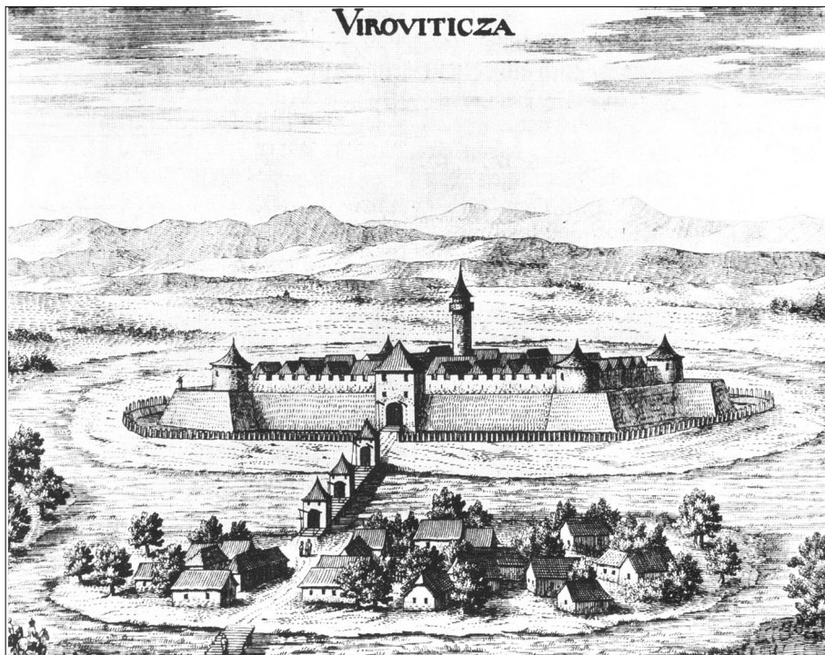
Valvazorov crtež Virovitice iz 1684.