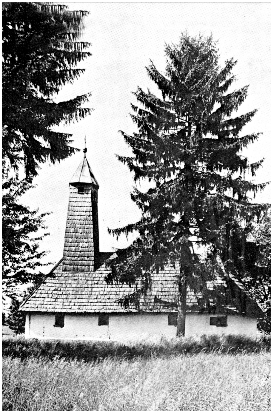
Rastovac, pravoslavna crkva Sv. Mitra.