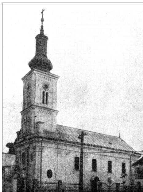
Nova Gradiška, pravoslavna crkva Svete Trojice prije rušenja u Drugom svjetskom ratu (1941).