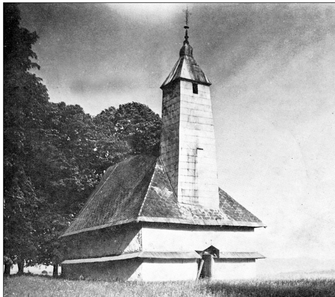
Donja Rašenica, pravoslavna crkva Uspenja Presvete Bogorodice.