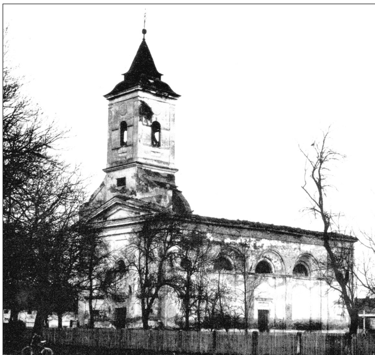
Veliki Zdenci, pravoslavna crkva Časnoga Krsta