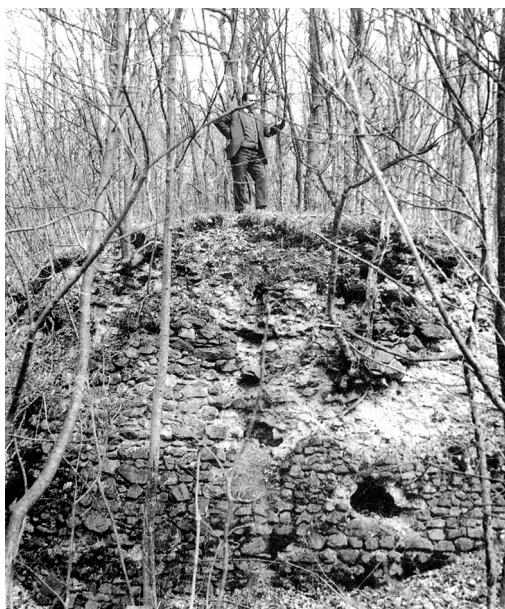
Ranosrednjovjekovna utvrda Šag (naziru se samo ostaci okrugle kule).