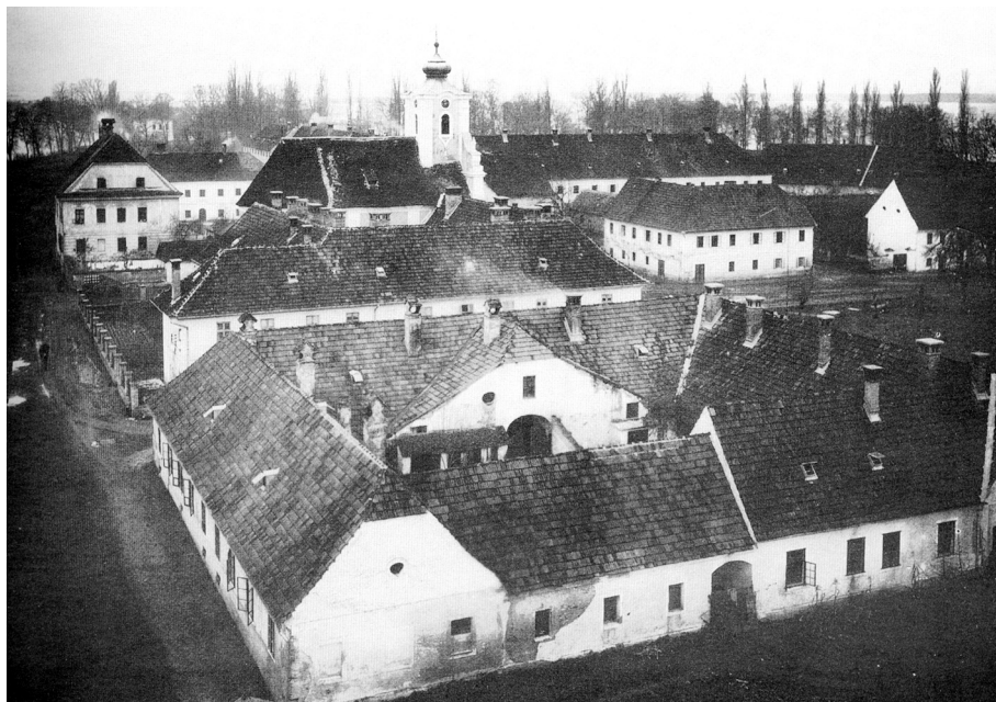
Pogled na tvrđavski kompleks s katoličkom crkvom u Staroj Gradiški (snimljeno između dvaju svjetskih ratova).