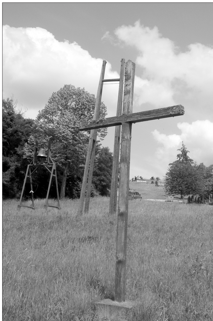
Roždanik, mjesto srušene katoličke crkve