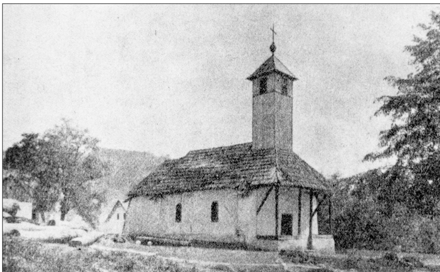
Sirač, pravoslavna crkva prije 1930.