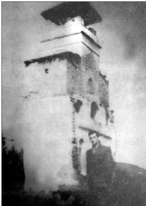
Jablanac, toranj pravoslavne crkve, 1966.