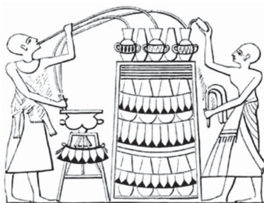
Slika 2 Destilacija vina 1450 godina prije Krista

Slika 2 pokazuje proces destilacije vina i sifon rabljen 1450 godina prije Krista. Slika 3 prikazuje tradicionalni način pripreme vina (prešanje grožđa i punjenje posude ostacima grožđa) prema slikama u grobnici Nebamen i Ipuki (Tebe). Slika 4 prikazuje djevojku koja toči vino na gozbi.