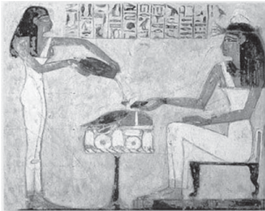
Slika 4 Djevojka toči vino na banketu

alkohola, vino od 12 % do 15 %, a žestoka pića obično oko 45 % alkohola.