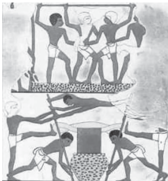
Slika 3 Prešanje grožđa i stavljanje ostataka u posude u Egiptu i Mezopotamiji 2500-1900 godina prije Krista

Alkoholna pića vino i pivo dobivaju se fermentacijom iz grožđa, voća, žitarica, hmelja, meda i drugih biljnih tvari i mogu se naći u svim dijelovima svijeta. Otkriće procesa destilacije tijekom 12. stoljeća omogućilo je preradu pića s višim postotkom alkohola, žestokih pića. Koncentracija alkohola, posebno etilnoga različita je tako npr. pivo sadržava obično oko 5 %