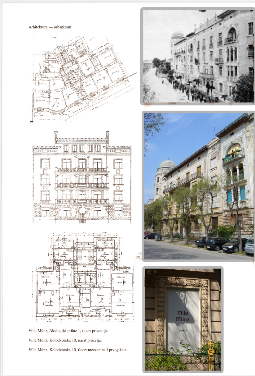
Prilog 2: Vile Munz

- Vile Munz, Ravenska 1, Kolodvorska 10 – 14