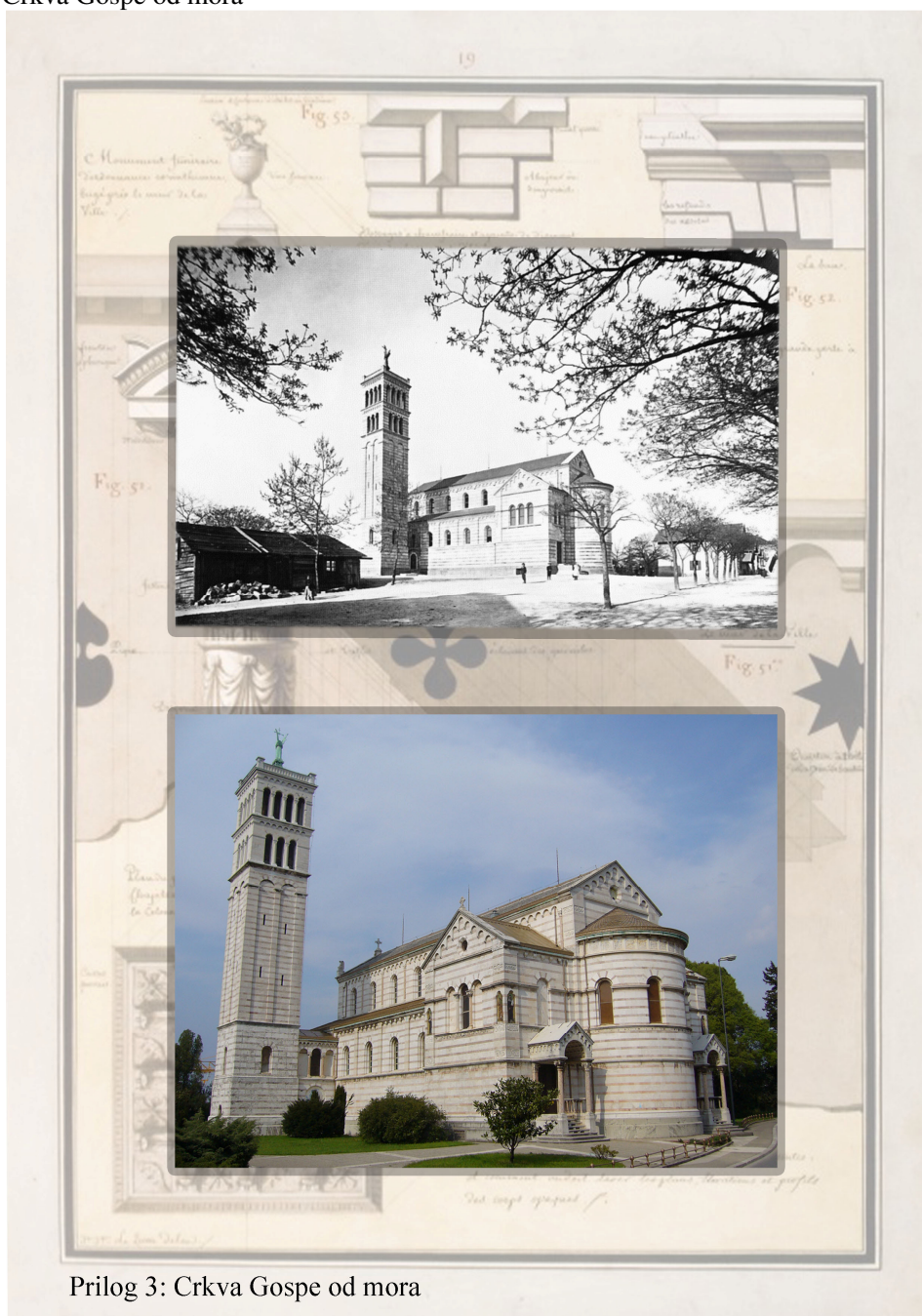
Prilog 3: Crkva Gospe od mora