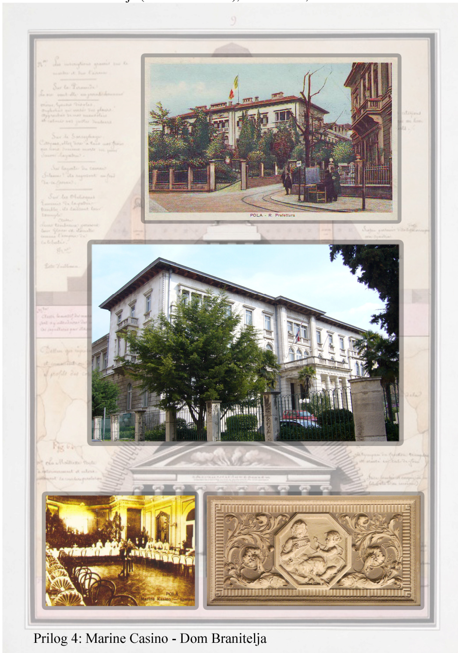
Prilog 4: Marine Casiono - Dom Branitelja

- Dom hrvatskih branitelja (Marine Casiono), Leharova 1;