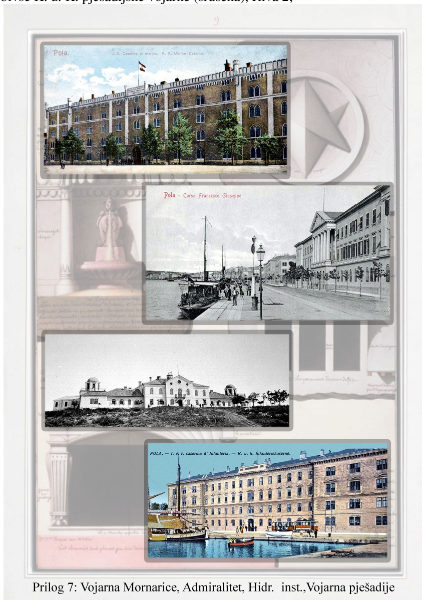
Prilog 7: Vojarna Mornarice, Admiralitet, Hidr. inst., Vojarna pješadije