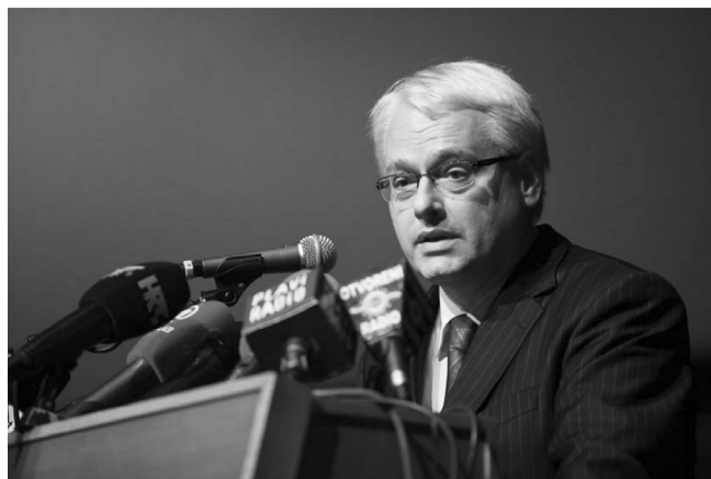
Slika 4 – Predsjednik RH dr. sc. Ivo Josipović za vrijeme govora