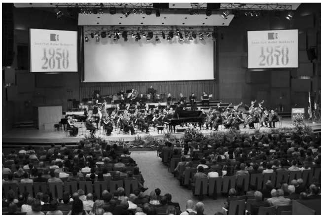
Slika 5 – Pogled na Zagrebačku filharmoniju za vrijeme izvođenja muzičkog programa

U posebno nadahnutom pozdravnom govoru predsjednik RH dr. sc. Ivo Josipović zahvalio je znanstvenicima Instituta za sve ono