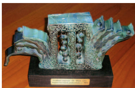
SLIKA 3. Godišnja nagrada dr. Milan Arko uručena gospodinu Đuri Horvatu kao najinventivnijem poduzetniku 2004. u Šibeniku 19. lipnja 2004.

u Siemensu i drugim tvrtkama stekao potrebno iskustvo na području gospodarenja otpadom, a posebice se s tim osjetljivim područjem upoznao kao član Europske zajednice za prijevoz opasnih tereta. Stečena znanja i iskustvo te spoznaja kako je na području proizvodnje proizvoda namijenjenih zaštiti okoliša u Hrvatskoj početkom devedesetih godina prošloga stoljeća vladala potpuna praznina, bili su dostatan poticaj ovom čovjeku poduzetničkoga duha da se odluči započeti proizvodnju za potrebe tržišta koje na početku u Hrvatskoj i nije bilo dovoljno razvijeno. Međutim, priključivanje Hrvatske svjetskim trendovima očuvanja okoliša učinilo je Tehnixovu paletu proizvoda potrebnom nakon austrijskoga, slovenskoga i njemačkoga tržišta i na hrvatskomu tržištu. Dovoljno snažna vizija njegova osnivača dovela je Tehnix na prvo mjesto proizvođača specifičnih proizvoda za potrebe zaštite okoliša u cijeloj regiji, dok je u Hrvatskoj Tehnix još uvijek bez konkurencije.