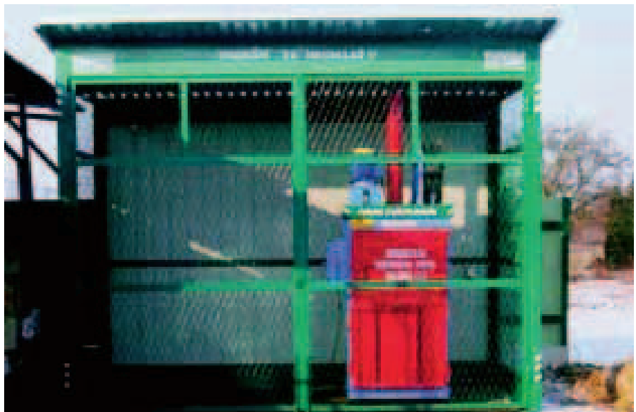
SLIKA 8. Reciklažno dvorište opremljeno Tehnixovim proizvodima

Na području gospodarenja otpadom danas je tvrtka Tehnix u mogućnosti ponuditi cjelovita rješenja izgradnje i opremanja čitavih tvornica za recikliranje komunalnoga otpada (slika 9).