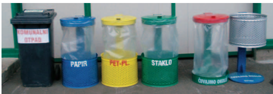
SLIKA 5. Spremnici za odvojeno sakupljanje otpada iz kućanstva

Nakon odvojenoga sakupljanja, prešanja odnosno baliranja otpad se odvozi u pogone za recikliranje. Tehnix proizvodi i opremu za recikliranje, različite trgalice (slika 7), drobilice, sjeckalice te opremu za reciklažna dvorišta za recikliranje drva, papira, metala, stakla te gume i plastike