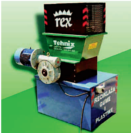
SLIKA 7. Trgalica za recikliranje gume i plastike

(slika 8). Novost u proizvodnom programu su strojevi za recikliranje starih računala, mobitela te televizijskih i računalnih monitora.