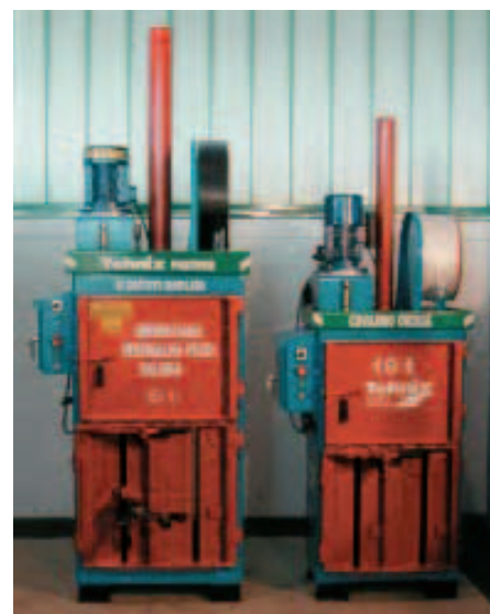
SLIKA 6. Okomita preša za baliranje odvojeno prikupljenoga otpada

Sakupljeni otpad (osim onoga sakupljenoga u tzv. pres spremnicima) je rastresit, lagan i voluminozan te ga je skupo transportirati. Stoga ga treba isprešati i balirati što se može načiniti pomoću Tehnixovih vodoravnih i okomitih preša za baliranje (slika 6). Preše su namijenjene baliranju kartona, papira, PET ambalažnoga otpada, ostale otpadne plastike, drvenih sanduka, aluminijske i čelične ambalaže, bačvi, limenih i plastičnih kanti, otpadnih hladnjaka i štednjaka, informatičke opreme i ostaloga.