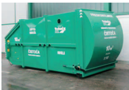
SLIKA 4. Tzv. pres spremnici za prikupljanje i stlačivanje otpada

U području gospodarenja otpadom Tehnix isporučuje pužne i hidraulične tlačne tzv. pres spremnike, namijenjene gradovima, komunalnim tvrtkama, a posebno su pogodni za otoke, marine i slična mjesta (slika 4). Uporaba pres spremnika sa sustavom za zbijanje otpada smanjuje troškove postupanja s otpadom, a pri odvojenom sakupljanju otpada omogućuju jednostavnije recikliranje što je konačni cilj kojemu treba težiti na području gospodarenja otpadom.