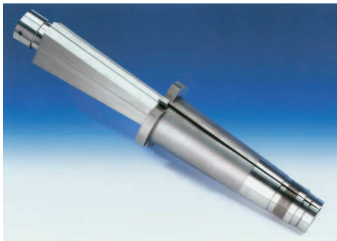
SLIKA 1. Hascova raskoljiva jezgra Z 3600/...

Tvrtka Hasco u svomu proizvodnomu programu nudi gotove tople uljevne sustave u obliku toploga dijela kalupa (slika 5). Pritom je riječ o razvoju postojeće zamisli toplih uljavnih kanala. Alatničari i prerađivači očekuju od proizvođača tih sustava gospodarnost i sigurnost rada. Upravo to nudi