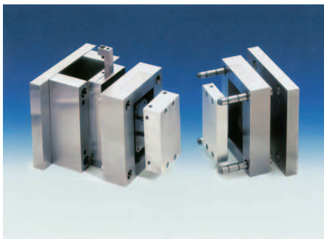
SLIKA 2. Hascov sustav za brzu izmjenu K 3500/...