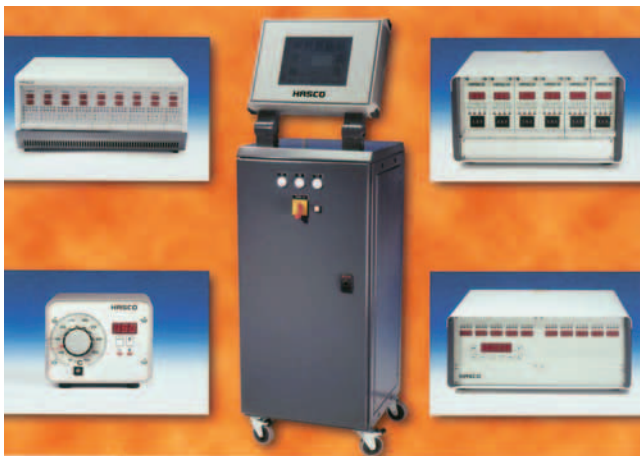
SLIKA 4. Hascovi uređaji za podešavanje temperature