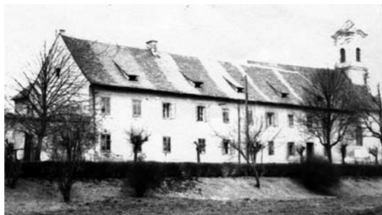
Slika 2 "Gradski ksenodohij kraljevskoga slobodnog grada Varaždina podignut 1776., obnovljen 1827. i 1903." (takav natpis stajao je iznad glavnog ulaza). Zgrada postoji u gradu i služi za stanovanje ( ; 23, 31)