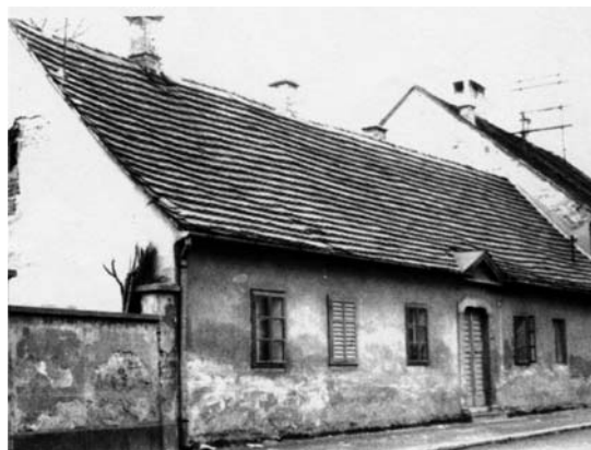
Slika 3 Zgrada hospitala sagrađena 1839. i srušena 1982. U trokutastom uzdignuću iznad ulaznih vrata stajao je natpis "KRANKENHAUS DES ARMEN-STITUTS MDCCCXXXIX" (23, 31)

Ni to nije bila bolnica, iako su građani zbog nje nazivali Prešernovu ulicu Bolnička ulica. U "Kronici Družbe sestara milosrdnica sv. Vinka Paulinskog