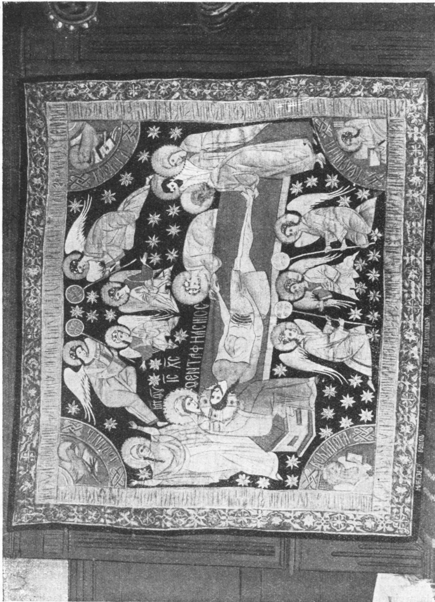
Plaštanica iz manastira Pakre, 1567.