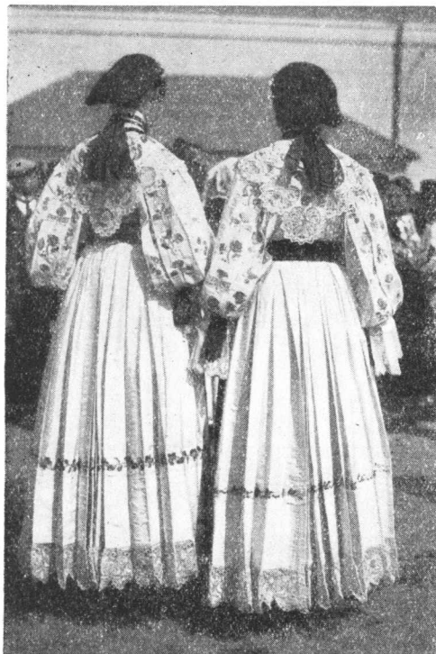
Sa izložbe narodne nošnje u Osijeku 1929. Nošnja iz Čajkovaca kod Vrpolja.

kriveni tursko-orientalni elementi bilo u nazivima ili oblicima. No jasno je, da neke od pojedinosti slavonskih nošnja vode dalje prema sjeveru i vežu se usko s analognima u Vojvodini i susjednoj Mađarskoj. Tako će to biti na prvi mah vidno kod muških kabanica (»aljina«) od čohe sa vrlo značajnim izvezenim ili inače apliciranim motivima, ili kod širokih, danas već često vrlo šarenih sukanja i kecelja, muških prsluka sa gustim nizovima puceta, forma šešira i dr. To više iskaču kao par excellence slavonske osobine