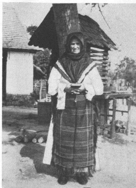
Stara žena iz Semeljaca.