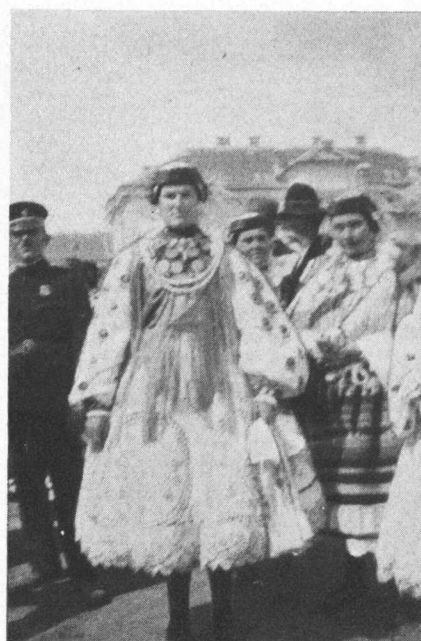
Iz Brodanaca pokraj Bizovca.