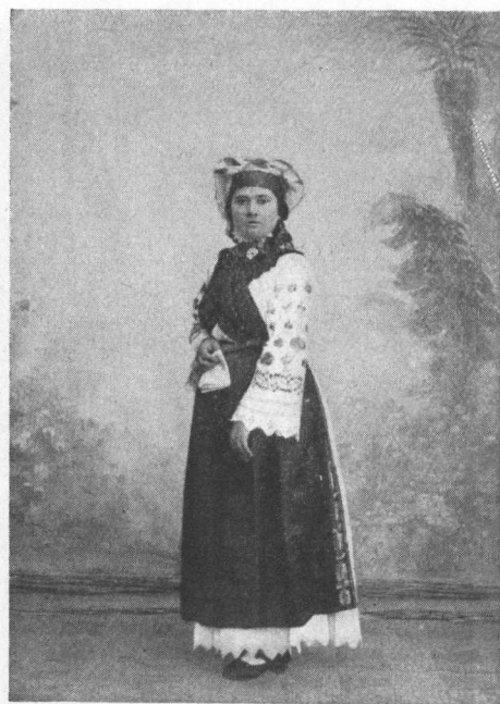
Iz Štitara. Iz Vrbanje.