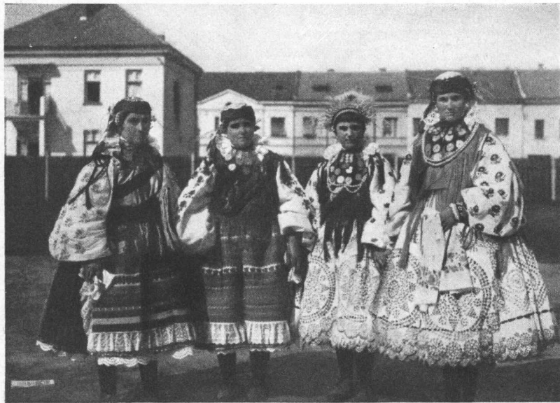
Iz Brodanaca kod Bizovca. (Zbor u Osijeku 1929.)