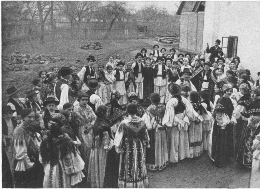
Kolo u Djakovu g. 1920. (Prednjih 7 snimaka starije slavonske nošnje čuva Etnografski Muzej u Zagrebu).