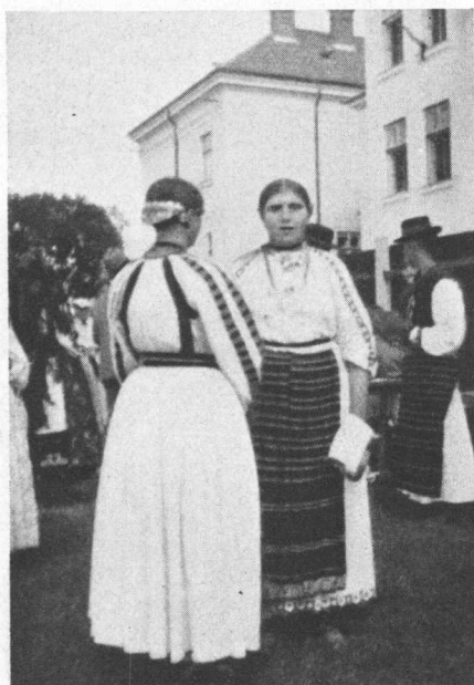
Iz Sopja kod Slatine.