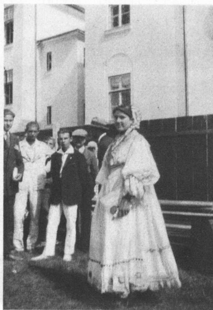
Sa izložbe narodne nošnje u Osijeku 1929.