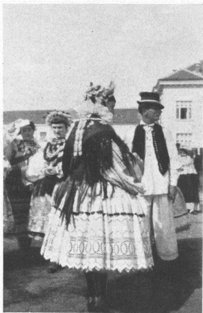
Iz Brodanaca pokraj Bizovca.