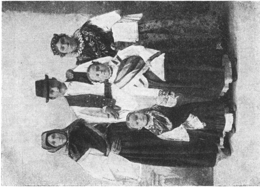
Iz Starih Mikanovaca.