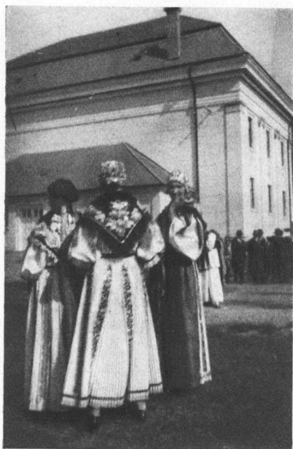
Iz Gorjana pokraj Djakova.