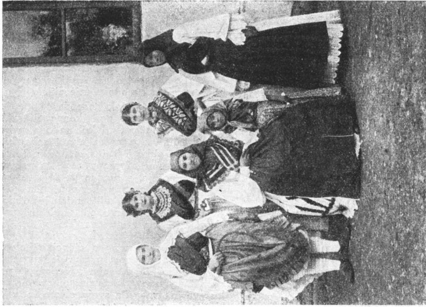
Iz Babine grede.