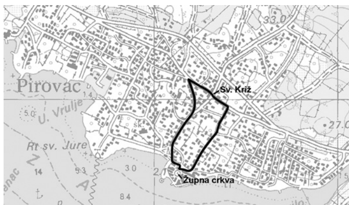
Slika 6: Smjer kretanja procesije u Pirovcu nakon 1990-ih; izvor: Državna geodetska uprava, TK 1:25 000, Slanje 520-1-4 (izvadak), oznake ucrtale autorice / Figure 6: Direction of the Movement of Procession in Pirovac after the 1990s. Source: Central Geodesic Archive, TK 1:25000, Reg. 520-1-4 (transcript), designations drawn by authors

"Prije je bila glavna postaja kod Križa i kod Sv. Nedilje. To su bile glavne jer nije bilo tamo, ni lijevo ni desno, nije bilo kuća. Sad se proširilo. Sad se ide do Sv. Nediljice, pa ide se livo prema Bezdanu i onda se skrene starom magistralom i tu bude postaja prije Križa. Sad kod Križa se ne staje (...) i sa Malon ulicom se vraća nazad. Tamo na onom kantunu, na tom križanju, tu bude blagoslov, i nizbrdo se ide ton Malom ulicom i dođe se u crkvu. (...) Tako da i ti ljudi koji tamo žive, a budu u kućama, da možda čuju i tako, pa se to malo proširilo. (...) Tako da je to malo sad izmijenjeno poslije ovog rata.