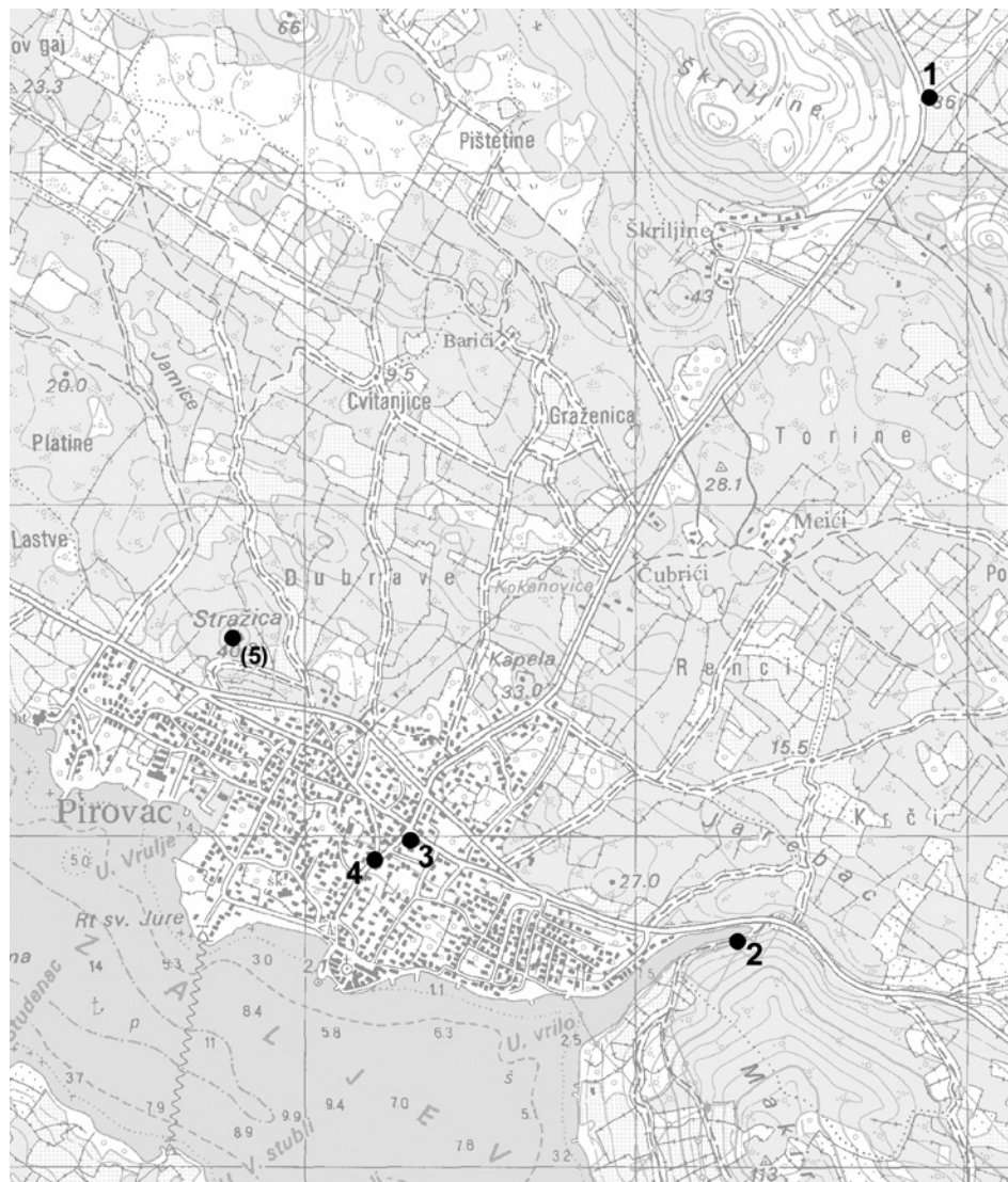
Slika 1: Pirovac s označenim kapelicama: 1. kapelica sv. Ante; 2. kapelica Gospe od zdravlja; 3. kapelica sv. Križa; 4. kapelica sv. Nediljice; (5.) kapelica sv. Marka; izvor: Državna geodetska uprava, TK 1:25 000, Slanje 520-1-4 (izvadak), oznake ucrtale autorice /