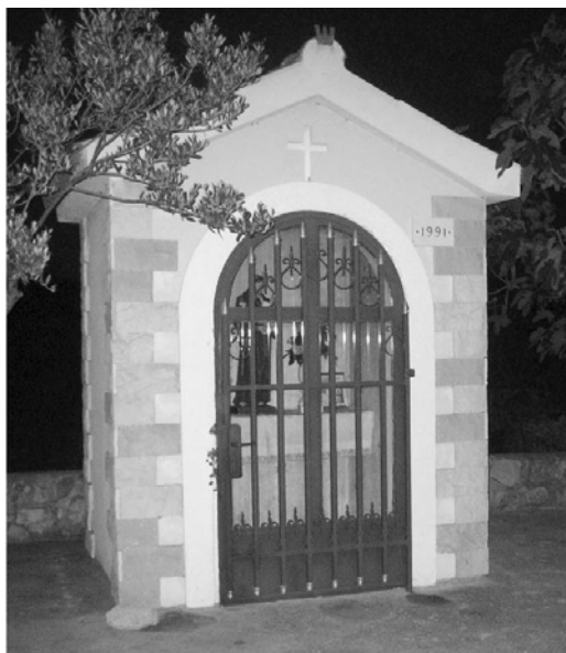
Slika 2: Kapelica sv. Ante; fotografirala S. U. u listopadu 2006. g. / Figure 2: Chapel of St. Anthony; photographed by S. U. in October 2006.

jer je neposredno nakon Drugoga svjetskog rata srušena. Ponovno je podignuta 1991. godine. Pirovčanima s kojima smo razgovarale nije poznat prvi graditelj kapelice, pretpostavljaju samo da se radi o pojedincu koji je imao neke osobne motive za taj čin. O razlozima njezina rušenja ne postoji jedinstven stav. Dok jedni to povezuju s uspostavom socijalističkog političkog sustava i komunističke ideologije u čiji se simbolički imaginarij kapelice nisu uklapale, drugi navode "banalniji" razlog ističući kako se kapelica urušila zbog dotrajalosti. Ipak, njezino fizičko "izbivanje" iz krajolika, do 1991. godine, nije narušilo kontinuitet njezina "bivanja" u pirovačkoj svakodnevici: