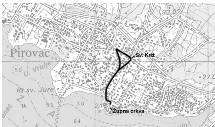
Slika 5: Smjer kretanja procesije u Pirovcu prije 1990-ih; izvor: Državna geodetska uprava, TK 1:25 000, Slanje 520–1–4 (izvadak), oznake ucrtale autorice / Figure 5: Direction of the Movement of Procession in Pirovac before the 1990s. Source: Central Geodesic Archive, TK 1:25000, Reg. 520-1-4 (transcript), designations drawn by authors

Značaj kapelica sv. Križa i (nekadašnje) sv. Nediljice naglašen je u svakogodišnjoj ophodnoj procesiji Pirovčana kroz središte mjesta, na Tijelovo. Do nedavno, do 1990-ih, itinerar tijelovske procesije bio je sljedeći (sl. 5):