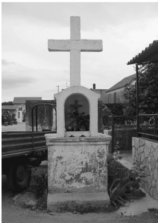
Slika 4: "Kapelica" sv. Križa;; fotografirala S. U. u listopadu 2006. g. / Figure 4: Chapel of St. Cross; photographed by S. U. in October 2006.

Također, njezin položaj na prometnom mjestu intenzivira i druge religijske prakse vjernika: