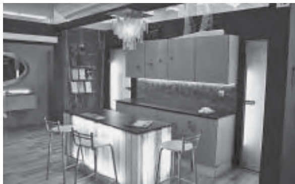
Slika 14. Simpatični štand tvrtke Bokart

PPS Galeković izložio je svoju paletu drvnih podnih i zidnih obloga, a novitet su vanjske obloge od termotretiranog drveta za oblaganje fasada – Thermo fasade , za koje su dobili i Zlatnu plaketu i diplomu Mobil optimum .