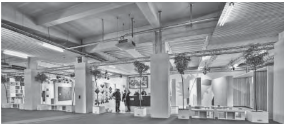
Slika 13. Inovativni pristup u proširenju ponude novim proizvodima; brand OBLIQ iz Siže Kupresa

U segmentu materijala i obrada svakako treba spomenuti podne i zidne obloge kojima se prezentiralo nekoliko hrvatskih tvrtki proizvođača.