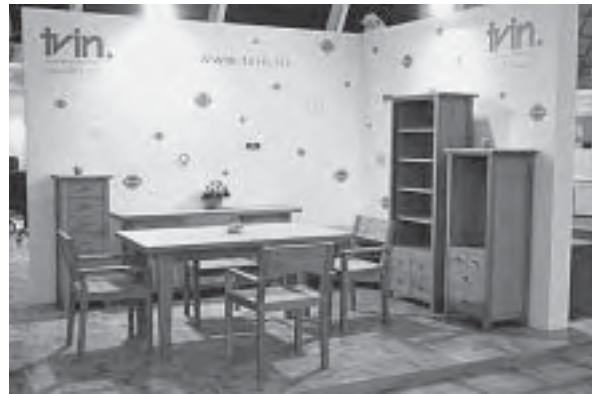
Slika 4. Izuzetna kvaliteta namještaja od cjelovitog drva proizvođača Tvin iz Virovitice

Zdrav san u posljednjih je nekoliko godina jedno od najvažnijih područja zanimanja. Svakako treba istak-