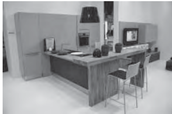
Slika 8. Profinjeni kuhinjski program Estella (Tulipana) autora Darka Šurine