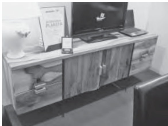
Slika 11. Tvrtka Hrastico izložila je namještaj od orahovine i stakla, autora Krunoslava Kovača, za koji je dobila Brončanu plaketu Mobil optimum

Prezentacija tehnoloških mogućnosti i materijala skriveni pod brandom OBLIQ , zasigurno će privući brojne arhitekte i dizajnere u budućem oblikovanju prostora. Za inovativni pristup u proširenju ponude novim proizvodima, OBLIQ , Siže Kupres nagrađen je Srebrnom plaketom i nagradom Mobil optimum (sl. 13).