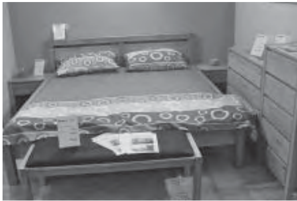
Slika 2. Spavaća soba Twill , proizvođač Spin Valis

prostoru. Hrvatski su proizvođači prihvatili i primjenjuju svjetske trendove u vlastitim linijama proizvoda.