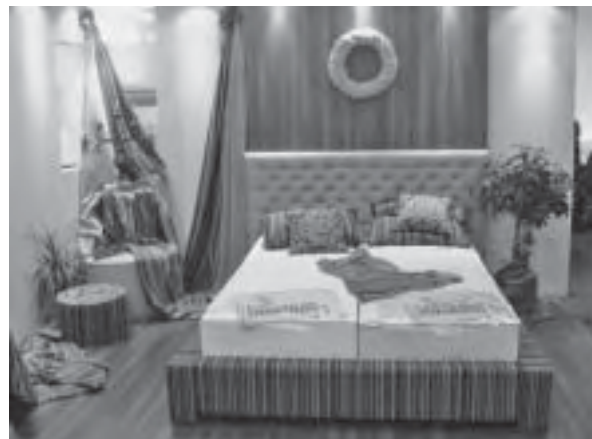
Slika 6. Ambijentalno uređenje štanda tvrtke Bernarda