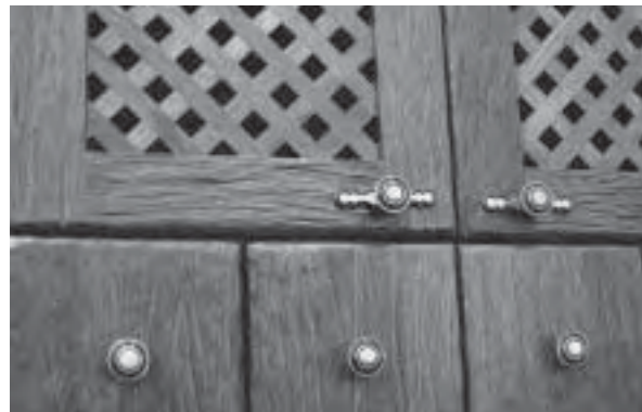
Slika 9. Detalj „starinskog“ kuhinjskog pročelja, proizvođač Naprijed iz Sinja