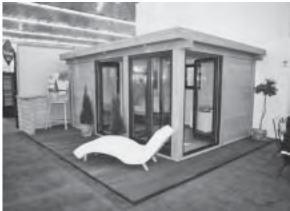
Slika 3. Drvena kuća Oaze , autor Veljko Linta, proizvođač Azelija-Kupa

Tvrtka Javor prezentirala je tople, elegantne i jednostavne elemente blagovaoničkih stolova, stolica i spavaćih soba od cjelovitog drva hrastovine obrađene uljima, dok je Azelija-Kupa prezentirala novu prirodnu kuću od cjelovitog drva Oaze , autora Veljka Linte, nagrađenu Brončanom medaljom Mobil optimum (sl. 3).