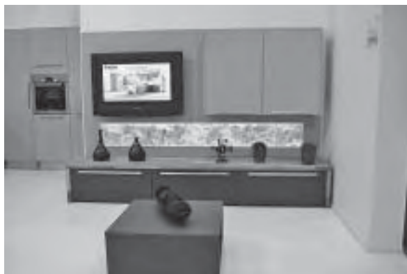
Slika 7. Cjelovito oblikovanje stambenog prostora s konceptualno istim elementima, autor Darko Šurna, proizvođač Svea Zagorje ob Savi

U kuhinjskim programima u porastu su visokokvalitetne vrste drva, tamne, strukturirane, često brušene ili voštane. Pokatkad i namjerno naglašeno kod nekih domaćih tvrtki, poput tvrtke Naprijed iz Sinja, kuhinjski elementi izgledaju kao "starinsko" drvo (sl. 9).