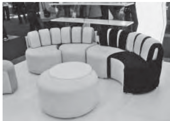
Slika 10. Program modularnog namještaja za sjedenje Zoom-Zoom , autori Darko Špiljarić i Ines Stošić, proizvođač Inkea

Kao i prethodnih godina, ojastučeni namještaj i dalje odiše većim formatima, no bez pretjerivanja i predimenzioniranja. U tom smislu nema novosti (osim po količini). Tvrtka Malagić te tvrtka Himolla GmbH , koja je ove godine po prvi puta prezentirana na Ambienti, imale su zavidno popunjene velike izlagačke prostore. Čak je i Inkea , uz poznate linije ravnih bijelih elemenata uredskoga i kuhinjskog namještaja, izložila zaobljenu i fleksibilnu garnituru za sjedenje Zoom-Zoom , koja je dobila Srebrnu plaketu i diplomu Mobil optimum za razvoj komponibilnog programa modularnog namještaja za sjedenje i odlaganje. Autori su Darko Špiljarić i Ines Stošić (sl. 10).