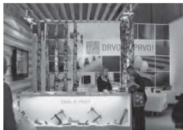
Slika 1. Infopult Drvo je prvo , HGK

U tom prostoru dominira drvo zahvaljujući sve većoj ekološkoj osviještenosti kupaca, ali i sve jačoj svijesti građana o ekološkim i prirodnim proizvodima u