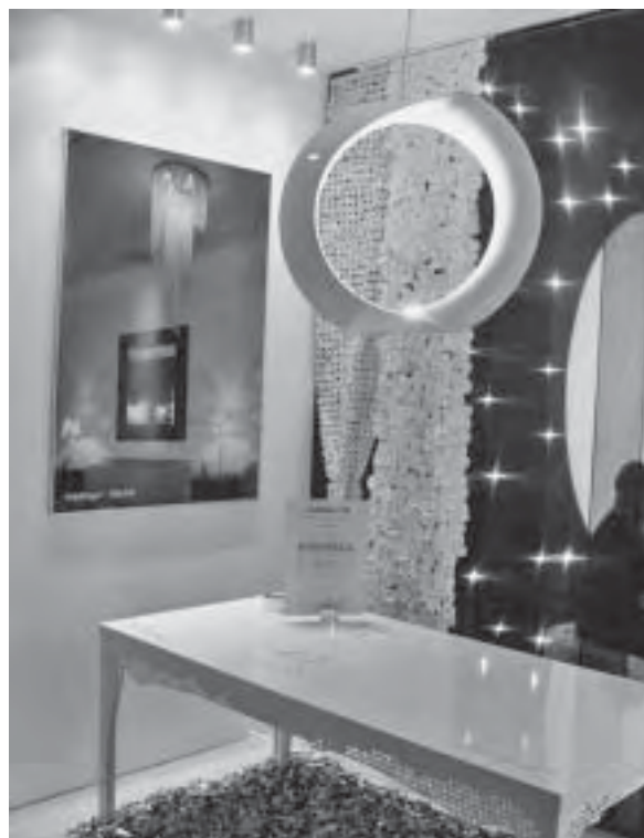
Slika 12. Ambientalni postav na štandu tvrtke Dekor iz Zaboka

Compact ploče, honey comb ploče (sačasta ispu- na) ili karton, nosive sajle i tkanine nude nove oblikovne i funkcionalne mogućnosti, što je ove godine na Ambienti izuzetno dobro prikazala tvrtka Siže Kupres .