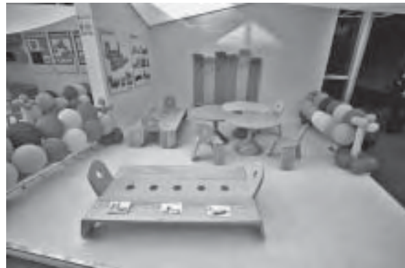
Slika 12. Natječaj za dječje vrtiće: prvonagrađeni rad autora Nevena i Sanje Kovačić, u izvedbi tvrtke Ferenčić

ještaja za opremanje dječjih vrtića, koji je ove godine prikazan na Ambienti u završnoj fazi. Naime, u sklopu akcije Drvo je prvo Hrvatska gospodarska komora, u suradnji s Hrvatskim šumama, Ministarstvom regionalnog razvoja šumarstva i vodnoga gospodarstva te Hrvatskim društvom dizajnera i, najvažnije – hrvatskom drvnom industrijom, ove je godine postavila izložbu prototipova namještaja i opreme za dječje vrtiće, radove koji su prošle godine pobijedili na javnom natječaju, a ove su godine proizvedeni kao prototipovi (sl. 10, 11. i 12).