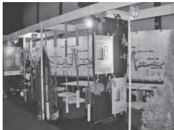
Slika 3. Štand Šumarskog fakulteta iz Zagreba

Posebno mjesto na štandu Šumarskog fakulteta zauzela je izložba studentskih radova nastalih na kolegiju Oblikovanje namještaja i Namještaj i opremanje prostora, kao nastavak prošlogodišnje izložbe radova na kojoj su studenti Drvnotehnološkog odsjeka, smjer Oblikovanje proizvoda od drva, ponovno pokazali kreativnost u konceptualnom razmišljanju i idejama. Radovi studenata također su bili prezentirani u posebno zatamnjenoj sobi, gdje je svaki posjetitelj mogao sjesti i uživati u idejnim crtežima i fotografijama s terenske nastave, okružen autentičnim zvukovima hrvatskih šuma.