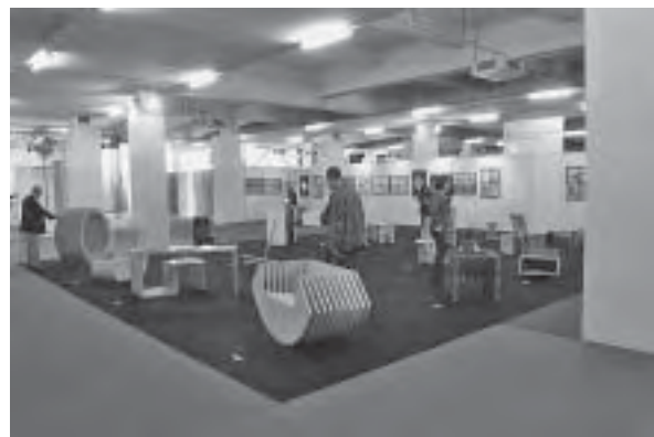
Slika 7. Štand Škole za primijenjenu umjetnost i dizajn ispunjen kreativnim radovima i modelima učenika Odjela za unutrašnju arhitekturu