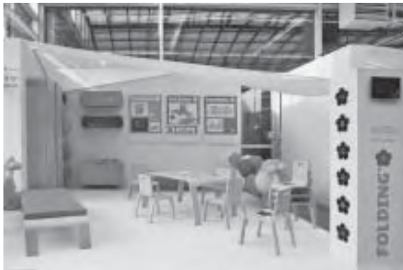
Slika 10. Natječaj za dječje vrtiće: drugonagrađeni rad autora Goge Golik i Damjana Gebera, u izradi Slavonije DI