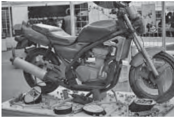
Slika 9. Vrhunsko stolarsko umijeće, pedantnost i strpljivost očituju se u ovom uratku na štandu Agencije za strukovno obrazovanje