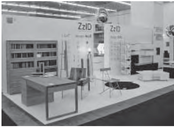
Slika 4. Štand Zajednice za industrijski dizajn