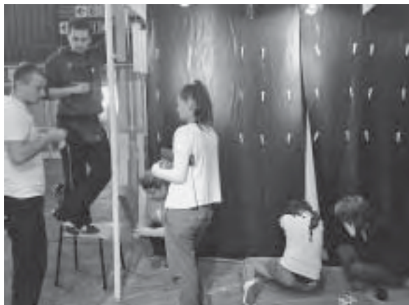
Slika 1. Radna atmosfera pri postavljanju štanda Šumarskog fakulteta; foto: Danijela Domljan

Svi radovi, predstavljeni u staklenim laboratorijskim tikvicama i epruvetama, alegorijski su prikaz metoda istraživanja u pojedinim laboratorijima i zavodima, dok su namještaj, modeli i makete rezultat istraživanja oblikovih, konstrukcijskih i tehnoloških zahtjeva. Knjige i brošure koje je mogao prolistati svaki posjetitelj, nastale su kao rezultat istraživačkoga i nastavnog rada djelatnika Fakulteta, a daju odgovore gospodarstvenicima na brojna pitanja s područja šumarstva i drvne tehnologije.