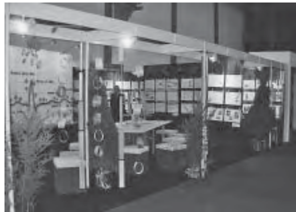
Slika 2. Štand Šumarskog fakulteta iz Zagreba nudio je obilje informacija s područja šumarstva i drvne tehnologije