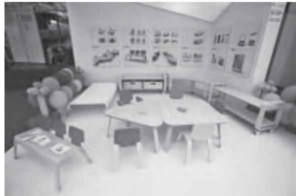
Slika 11. Natječaj za dječje vrtiće: prvonagrađeni rad autorice Andreje Hercog, čiji je prototip izvela tvrtka Jurić