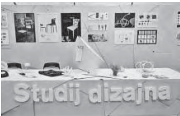
Slika 5. Minimalistički štand Arhitektonskog fakulteta Studija dizajna

Za posjetitelje su pravo osvježenje ove godine bili radovi učenika Odjela unutrašnje arhitekture Škole primijenjene umjetnosti i dizajna . Prvi su puta na Ambienti izložili vlastite radove (većinom maturalne) koje tradicionalno svake godine maturanti izlažu u Galeriji Isidor