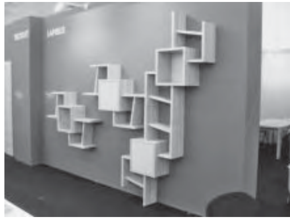
Slika 6. Zanimljivo konceptualno rješenje polica od cjelovitog drva, studentski rad u izvedbi tvrtke Lapibus ( Hrvatski interijeri )