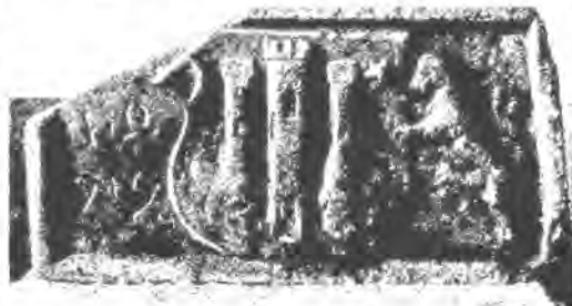
Sl. 93. Grb grada Zagreba od god. 1499. 1 (U narodnom muzeju).

U tomu štitu, kojega s desna drži uzpravljen lav razciepana repa (cauda biturcata), vide