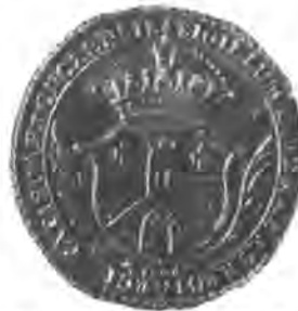
Sl. 77. Pečat grada Koprivnice od g. 1804.

= Civit(at)is Capro(ncensis). Cijeli je pečat obrubljen izvana člankovitom, a iznutra crtolikom elipsom. Taj pečat potiče iz konca XVII. ili početka XVIII. vijeka.