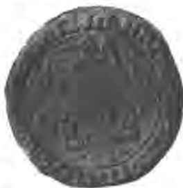
Sl. 75. Manji pečat grada Koprivnice.

Koprivnica dobi od kralja Ljudevita I. god. 1356. privilegij kraljevskoga i slobodnoga grada, s pravima sličnim onima grada Zagreba. Koprivnička gradska občina imala je i svoj pečat. Najstariji, za koji znamo, od godine je 1610. Okrugao je, a mjeri u promjeru 34 mm. Na njemu se vidi kula, gradjena od tesanog kamena, bez vrata, prozora i kruništa; s desna i lieva kuli stoji po jedna kamena kocka i po jedan veliki liljan. Na vrh kule stoji na svakom kraju nataknuta glava, a po sriedi na dva prutića uprta trocjepa kruna. Desno od krune broj 16, a lievo 10, dakle godina 1610, valjda kada je pečat izrezan. Naokolo medju dvima zrnatim kolobarima dosta sbijen nadpis: