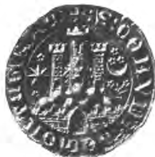
Sl. 91. Veliki pečat grada Zagreba.

Izvorni pečatnik od žute mjedi čuva gradska občina. Još mi je spomenuti, da na izpravama nalazimo još jedan mali pečat zagrebačke občine, okrugao, 28 mm. širok, sa istim nadpisom i figurom, jedino što su kruništa kule uglata, 2 (Sl. 92.) a taj je bez dvojbe stariji od gornjega, i potiče iz XVI. vijeka.