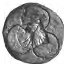
Sl. 88. Pečat plemenske strelačke občine.

Stare plemenske strelačke občine danas više nema; sterala se je na iztoku od Kamenskoga, a na sjeveru od Trebinje, prelazeći pače i Kupu i zapremajući dobar komad na lievoj obali do medja draganičke občine, s kojom je god. 1394 medjašila kod šume Lepova kneja. Strelačko pleme skupljalo se je u svoje klupe kod crkve sv. Tomaša u Strelču ili kod sv. Ivana u Trebinji (Therbyna). U takovim zborovima izdavaše plemenski sudac izprave, 2 podkriepljene visećim plemenskim pečatom. Sa svojim susjedima plemićima iz Otoka (danas Mekušje) živjelo je strelačko pleme u liepoj slozi, te je često s njima zajedno radilo u svojim klupama o zajedničkom interesu.