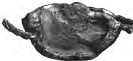
Sl. 69. Ulomak velikoga pečata dubovačke obćine.

Izpod staroga razvaljenoga grada Dubovca kod Karlovca pružao se njegov danjši dubovački varoš. Dubovačko je pleme možda i samo taj grad podiglo za svoju sigurnost, nu tečajem je vremena dospio u ruke hrvatskih velmoža.