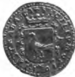
Sl. 73. Mladji pečat jastrebarske občine.