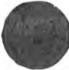
Sl. 80. Veliki pečat donjega križevačkoga grada.

Grad je Križevac dobio svoje slobode i povlastice god. 1252. od bana ciele Slavonije Stjepana (Babonića), te ih je sljedeće god. 1253. kralj Bela IV. posebnim privilegijem potvrdio. Ove povlastice bijahu takove kao i gradjana zagrebačkih, te je i na čelu križevačke občine stajao od gradjana slobodno birani sudac. Križevačka občina u starije doba nije imala svoj posebni občinski pečat, kojim bi se bile pečatile javne njezine izprave, već je na nje sudac stavljao svoj privatni pečat. Kao primjer spominjemo ovdje pečat križevačkoga sudca Matije, sina Blaževa, od god. 1417. (Mattheus, filius Blasii, iudex et iuratus civis veteris civitatis Crisiensis..). Taj je pečat okrugao, u njem se u dnu vidi zatvoren šlem, nad njim uncijalno slovo M, a iznad ovoga opet manji šlem (?) sa dva roga, koji se u slici okruga sastaju u prostoru medju zrnatim rubovima (Perlinien). Medju ovim zrnatim kolobarima naokolo stoji nadpis: