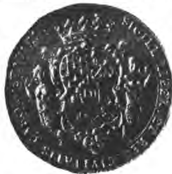
Sl. 74. Pečat karlovačke gradske obćine.

U donjem je polju slika karlovačke tvrđje s dvima riekama (urbem et propugnaculum Carolostadiense suis cum munimentis aedibusque tum sacris cum profanis, alluentibus illud fluvii Colapi et Corana). Gore desno je sunce, lievo rastući mjesec. U sredini grba stoji mali dolje zaokružen štit (Herzschild) sa slovima