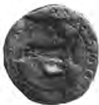
Sl. 72. Stariji pečat jastrebarske občine.

Na njemu se vidi na lievo okrenut jastreb zatvorenih krila, a naokolo je nadpis: ☒ SIGILLVM OPIDI (sic!) IAZTRABAR3CA. (Sl. 72.)