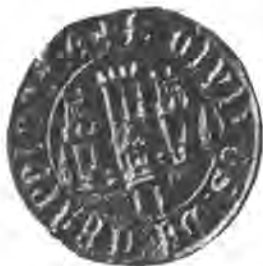
Sl. 78. Pečat grada Krapine.

Krapinskoj je občini prava kraljevskoga i slobodnoga trga podielio kralj Ljudevit I. godine 1347. Već i prije toga imala je krapinska občina svojega sudca, a ovaj je vazda čuvao občinski pečat, koji se je stavljao na javne izprave. Pečat taj (Sl. 78.) je okrugao, u promjeru mjeri 35 mm., na njemu se vide tri kule od tesana kamena, od kojih srednja najviša nosi četiri kruništa i dva uzporedna prozora u gornjem spratu; postrane su kule niže, imaju po tri kruništa i visoki krov, koji na svakom kraju sedla nosi po jednu nataknutu kruglju. Sprieda zaštićene su kule zidom, koji imade u sredini četverouglasta vrata, nad kojima se uzdiže mali toranj sa zašiljenim krovom. Na skrajnim dielovima zida namješten je po jedan mali šiljatim krovom nadkrit tornjić, a medju ovim i tornjem nad vratima po dva kruništa. Naokolo medju dva jednostavna kolobara stoji lapidarni nadpis s tragovina prelaza: