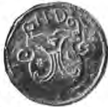
Sl. 67. Pečat draganićke obćine.

Ako i jesu ova privilegija podala obćini draganićkoj njeki osobit pravac života i razvoja, to su ipak prasjedioći Draganića i prije dolazka krešćićkoga plemena vazda smatrani plemićima, što nam svjedoči registar podgorske desetine od god. 1450., koji izrično nazivlje Draganićane oko Lazine plemićima. Već na najstarijim draganićkim glagolskim izpravama, koje izdavaše „župan plemenite bratje Draganić“ u klupama kod crkve sv. Jurja na Šipku, nalazimo obješen plemenski pečat. Najstariji, što nam je do danas u ruke dospio, nalazi se na glagolskoj iz-