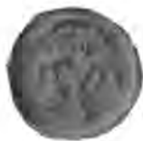
Sl. 64. Pečat občine Desinea (sv. Ivan).

Stara njekoč plemenska desinečka občina u kotaru jastrebarskom zvala se u staro vrieme Sv. Ivan, po staroj crkvi sv. Ivana krstitelja, koja je ondje stajala god. 1334. (in Gouriena), a tekar polovicom šestnaestoga vieka poče se mjesto kod Sv. Ivana nazivati današnjim imenom. Obćina je rabila za svoja javna pisma, koja izdavaše sudac (rihtar) desinečki, svoj posebni plemenski, obćinski pečat. U tomu se okruglomu pečatu, koji mjeri sa skrajnim jednostavnim kolobarom 19 mm. u promjeru, vidi sa sviem primitivno izrezan lik sv. Ivana Krstitelja (Sl. 64). Akoprem je ovaj pečat bez ikakove sfragističke vrijednosti, to ga ovdje kao proizvod rezbarske vještine ipak priobćujemo. Ovaj pečat nalazimo na izpravama XVI. vieka, a nema dvojbe, da je još i stariji. Tečajem XVI. vieka