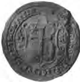
Sl. 81. Pečat gornjega križevačkoga grada.

Tek na mladjim listinama, od XVI. vieka ovamo nalazimo posebne občinske pečate, i to posebno za gornji i donji križevački grad. Oba su okrugla. Pečat donjega grada (Sl. 80.) mjeri u promjeru 30 mm., a u njem stoji uzpravni, dolje zaokružen štit, u kojemu se vidi oklopljena (?) na desno okrenuta ruka, držeća