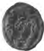
Sl. 79. Pečat krašićke občine.