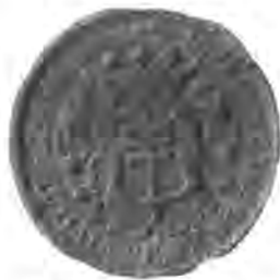
Sl. 83. Pečat grada Križevca od g. 1752.

Ovaj trostruki križ i dvie ruke dodjoše u ovaj novi pečat spojenjem prijašnjih pečata dviju občina. Kako vidimo i to je govoreći pečat, jer znamo, da se Križevac u starim izpravama nazivlje Križem (Cris).