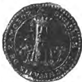
Sl. 87. Noviji pečat samoborske občine.

et concedentes, ut ipsi, ipsorumque successores vniuersi a modo successiuis perpetuis temporibus, semper et sigillo proprio et cera viridis coloris insigillanda literis communitatis, ac in omnibus rebus ac expeditionibus negotiorum suorum, inpar liberarum ciuitatum nostrarum, libere vti et gaudere valeant atque possent. . 4 To isto potvrdi kasnije god. 1528. u Beču u petak poslije blagdana jedanaest hiljada djevica kralj Ferdinand I. 1