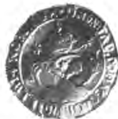
Sl. 66. Pečat domagovičke občine.

nuto odjeveno rame sa sabljom u ruci. Nad njim je kruna, kojoj s desna i lieva stoji po jedna šesterotraka zviezda; treća se nalazi medju ramenom i sabljom. S nižih vrhova brda (s lieva i desna srednjemu) niče po jedna grančica. Naokolo stoji medju dva jednostavna kolobara nadpis: SIGILLUM NOBILIUM COMMUNITATIS DE DOMAGOVICH (Sl. 66.)