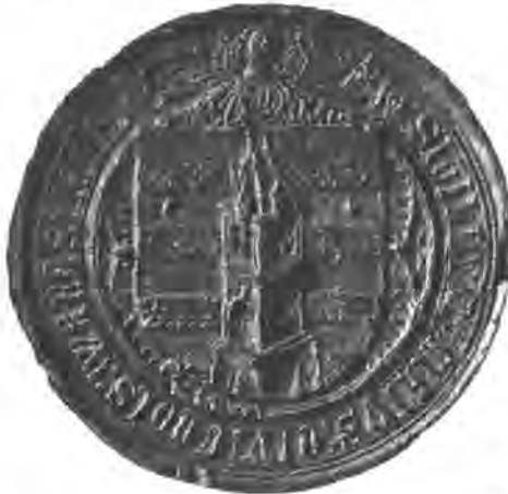
Sl. 90. Veliki pečat grada Varaždina.

Prema tomu grbu izradjen je novi varaždinski pečat, koji se je od toga vremena rabio na izpravama, koje izdavaše varaždinska občina. I ovaj je pečat okrugao, a promjer mu iznosi 60 mm. Na njemu se vidi uzpravan, s dola zaokružen štit, koji s gora drži razkriljeni andjeo. U štitu su u simetričnoj udaljenosti po-