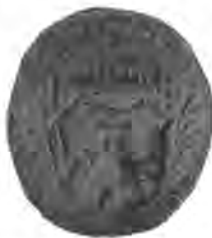
Sl. 76. Pečat grada Koprivnice u XVIII. vijeku.

Drugi je pečat ovalan, mjereći 31/28 mm. (Sl. 76.) Na njemu je sferičan štit, u kojem stoji do polovice tesanim kamenom zidani zid, a pred njim po sriedi diže se obla kula, do polovice se suzujuć, a dalje ravna, sa tri kruništa. Odozdo su