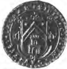
Sl. 94. Pečat zagrebačke kaptolske občine.

Prvi zametak kaptolskoj občini u Zagrebu nalazimo u sedamdesetim godinama petnaestoga vieka, kada je 2. januara god. 1478. kaptol zagrebački, kao zaštitnik nove ove občine odredio propise i zakone, po kojima će se vladati kaptolska občina. 1 Na čelu nove kaptolske občine stajao sudac, koji je čuvao občinski pečat. Taj občinski pečat, što ga ovdje donosimo, nije mlađi od početka šestnaestoga vieka (Sl. 94). On je okrugao, ima promjer od 30mm., a na njemu se vidi uzpravan dolje zaokružen štit, dvijema gredama, koje se koso dižu od sredine postranih dielova štita, a sastaju sried gornje stranice štita, čineći kut (Spitztheilung), razdieljen u tri polja (Spitzfeld). U velikom donjem polju vidi se kula sa četiri kruništa na vrhu (Zinnen), otvorenim vratima i dva uzporedno, u gornjem užem dielu kule razporedana prozora. U oba gornja trokutna polja stoji po jedna peterotraka zvjezda. Medju skrajnim člankovitim i nutarnjim jednostavnim kolobarom stoji na okolo lapidarni nadpis: