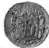
Sl. 82. Mali pečat donjega križevačkoga grada.

Pečat gornjega grada (Sl. 81.) imade promjer od 35 mm. Na njemu je uzpravni, dolje zašiljeni, u gornjim uglovima izvinut štit, u kojemu je slična ruka, koja drži