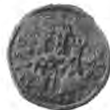
Sl. 92. Mali pečat grada Zagreba.