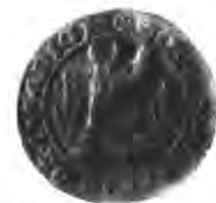
Sl. 71. Pečat ivanićke občine.

Ivanićko je mjesto veoma staro. Spominje se u listinama već u trinaestomu vieku, a bijaše u vlasti zagrebačkoga biskupa. Već god. 1295. dobi Ivanić (kloštar) od biskupa Ivana I. njeke povlastice, koje propadoše god. 1386., kada je ban Ladislav od Lučenca oplienio Ivanić. God. 1406. dobi nove povlastice od Eberharda Albena, zagrebačkoga biskupa, koje potvrdi kralj Sigismund 1407., a 1438. kralj Albert. Obćina ivanićka imala je rano svoj občinski pečat, koji je okrugao, a u promjeru ima 29 mm. (Sl. 71.) Na njemu se vidi kula od tesana kamena s otvorenim vratima, stubastim temeljem i tri kruništa na vrhu; s desna i lieva niću iz zemlje po tri batva rogoza. Medju vanjskim i nutarnjim zrnatim kolobarima (Perllinie) stoji naokolo lapidaran nadpis s tragovima prelaza na uncijal ☒ ⚡ OOMVNITI ⚡ · DE · IVANIICH, koji se ima čitati „sigillum) communi(ta)tis de Ivanieh“.