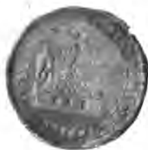
Sl. 63. Pečat občine Cirkvene.