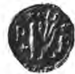
Sl. 70. Mali pečat dubovačke obćine.

Dubovačko je pleme imalo njekoč svoga sudca, starješine i pristave. U svojim hrvatskim, glagolicom i latinicom pisanim izpravama nazivlju se Dubovčani „plemenita bratja purgari“, a imali su i svoju „navadnu obćinsku pečat“, koju je čuvao obćinski su-