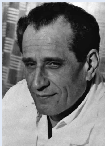
Slika 1. Prof. dr. sc. Vinko Frančišković, pionir bubrežne transplantacije Figure 1. Prof. Vinko Frančišković, the pioneer of the kidney transplantation

Nakon navedenog razdoblja slijedile su pripreme za bubrežnu transplantaciju na eksperimentalnim animalnim modelima . Iz tadašnjih protokola saznajemo: