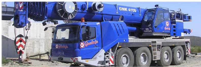
Slika 6 - Autodizalica

Prvo moguće rješenje bila je montaža čeličnih nosača pomoću autodizalice (slika 6). Nosači su se trebali montirati pomoću autodizalice na način da autodizalica ulazi na stropnu ploču i s te pozicije podiže teret. Stropnu ploču je trebalo dodatno proračunati/provjeriti na opterećenje montažnog sklopa zajedno s dizalicom koje je iznosilo oko 40 tona. Proračunom je dokazano da ploča nema dovoljnu nosivost za takvo dodatno opterećenje niti uz podupiranje ploče, pa se od ovog rješenja odustalo.