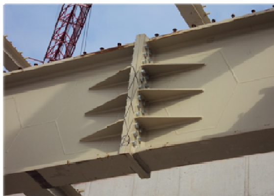
Slika 3 - Detalj spoja vijcima

Nosive konstrukcije stropova su spregnute ploče sistema Hoesch Additive Floor (slika 4). Visokoprofilirani čelični limovi oslanjaju se na glavne i sekundarne spregnute grede. Ploče se uz betonske zidove u fazi montaže oslanjaju na L-profile. Konstrukcija stropa prizemlja montira se na prethodno izvedene armiranobetonske stupove prizemlja. Na konstrukciju prizemlja postavljaju se pomoćni stupovi koji će ostati unutar betonskih stupova i dijagonale za stabilizaciju koje se prije betoniranja premještaju na drugu dilataciju. Proračun i dimenzioniranje pomoćnih elemenata čelične konstrukcije za fazu montaže provedeno je prema normama EC3.