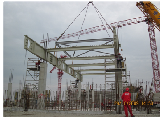
Slika 9 - Montaža sklopa

Po završetku rada dizalica je demontirana pomoću dvije autodizalnice. Za prijevoz dizalice bilo je potrebno osigurati 25 kamiona (slika 10).