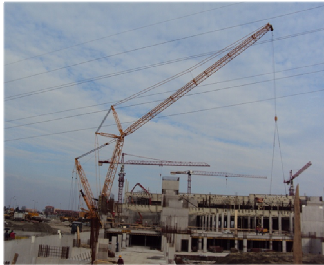
Slika 7 – Prangl dizalica u radu

Ovisno o napredovanju radova, revidirana je i shema uređenja gradilišta. Dizalica se nalazila na sjevernoj strani objekta, jer je samo na toj strani bio dovoljan prostor za manevriranje. Dizalica je, sukladno dinamičkom planu izvođenja radova i planu montaže čelične konstrukcije, na gradilištu bila angažirana od studenog 2009. godine do rujna 2010. godine.