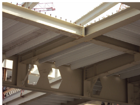
Slika 4 - Pogled na konstrukciju stropa