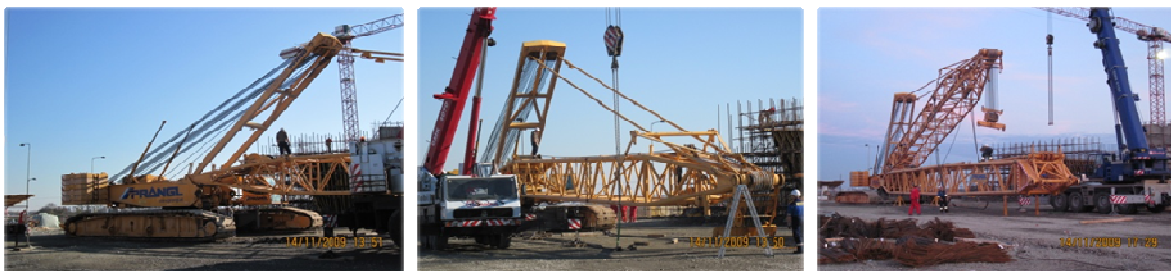
Slika 10 – Demontaža dizalice

Po završetku rada dizalica je demontirana pomoću dvije autodizalnice. Za prijevoz dizalice bilo je potrebno osigurati 25 kamiona (slika 10).