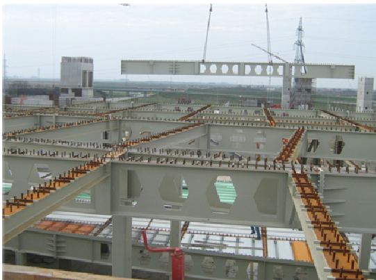
Slika 8 - Montaža pojedinačnih nosača

Ovisno o napredovanju radova, revidirana je i shema uređenja gradilišta. Dizalica se nalazila na sjevernoj strani objekta, jer je samo na toj strani bio dovoljan prostor za manevriranje. Dizalica je, sukladno dinamičkom planu izvođenja radova i planu montaže čelične konstrukcije, na gradilištu bila angažirana od studenog 2009. godine do rujna 2010. godine.