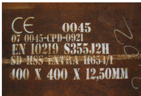
Slika 2 – Oznaka kvalitete čelika za proizvodnju nosača

Elementi čelične konstrukcije izrađeni su od vruće-valjanih I i L profila te hladno-oblikovanih cijevi pravokutnog i kvadratnog poprečnog presjeka kvalitete S355JR (slika 2). Pomoćni elementi za montažu I nosača trapeznih limova te moždanika spregnutih greda su kvalitete S235JR. Pozicije se u radionici spajaju u sklopove zavarivanjem koje je određeno klasom izvedbe EXC2 prema HRN EN 1090-2, prema HRN EN ISO 3834. Elementi čelične konstrukcije na gradilištu se spajaju vijcima M20 i M24 (slika 3). Antikorozivna zaštita čelične konstrukcije provodi se bojanjem prema Pravilniku o tehničkim mjerama i uvjetima za zaštitu čelične konstrukcije od korozije.