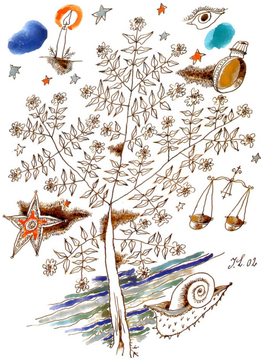
Prilog 1. Ilustracija uz Vojnovićev sonet Januar