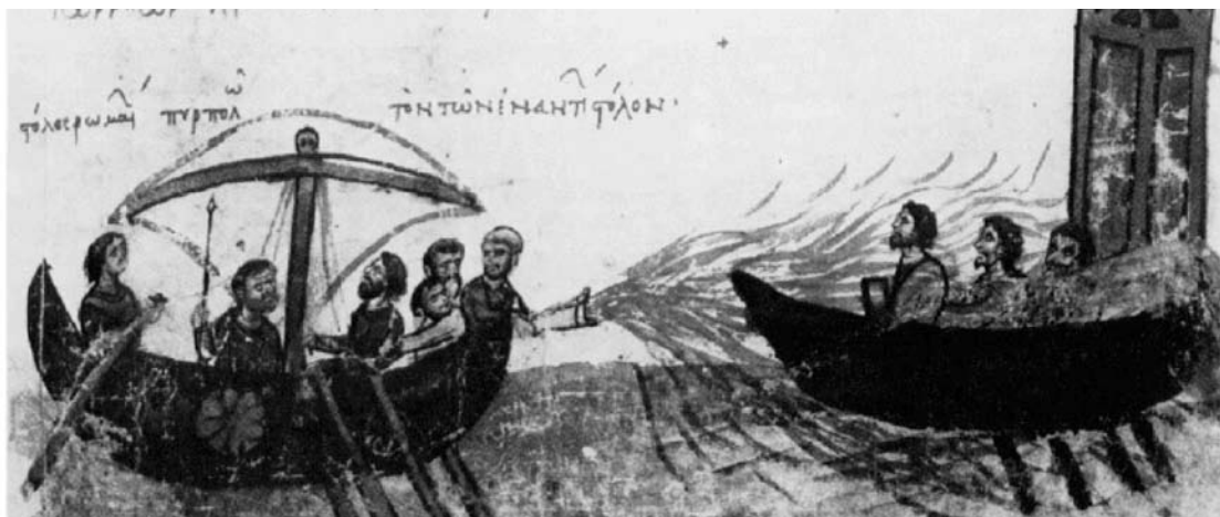
Sl. 2: Grčka vatra

Problem grčke vatre često je zanimao povjesničare. Premda se o njezinu sastavu i načinu upotrebe ne može govoriti s potpunom sigurnošću, povijesne činjenice govore nam da su se Bizantinci zahvaljujući upravo tom otkriću obranili u najtežim trenucima. Prvi je put upotrijebljena za opsade Carigrada (674–678). 51 Što se kemijskog sastava tiče, gotovo sigurno riječ je o sirovoj nafti ili njezinu destilat. Nafta je morala biti što rjeđa jer je gustu, sirovu naftu teško zapaliti. Stoga je vrlo vjerojatno da se prikupljala za hladna vremena (zimski jutro) i to na teritoriju Donbaša, sjeveroistočno od Crnog mora. 52 Nafta se zagrijavala u limenoj posudi pod tlakom, zatim se otpuštanjem ventila propuštala kroz cijev. Na samim »ustima« gorio je plamen koji bi zapalio tekućinu. Arapi i Bugari (čak i odmetnik Lav iz Tripolija) uspjeli su zarobiti ponešto »grčke vatre«, ali najvjerojatnije zbog kompliciranog procesa nikad nisu uspjeli svladati tehniku njezina korištenja.