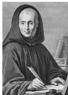
Sl.1: Portret Jeana Mabillona

Sedamnaesto stoljeće u Europi uistinu je bilo stoljeće historiografije. Još je Marc Bloch u svojoj Apologiji 1 upozoravao na zanemarivanje doprinosa posebno drugog dijela 17. stoljeća povijesnim znanostima i historiografiji. Upravo se u tome razdoblju razvija erudicija, a rađa se i historijska metoda, kojom razlučujemo istinito od lažnog. Bloch je posebice izdvojio 1681. godinu, »veliki datum u povijesti ljudskog duha«, kada Dom Jean Jacques Mabillon (1632–1707) izdaje svoj De re diplomatica . Zašto Bloch baš Mabillonovu djelu pridaje toliku važnost? Pokušat ćemo to pitanje razjasniti i prikazati u kratkim crtama života toga važnoga historioografa u ovom kratkom članku nastalom povodom velike, tristote obljetnice njegove smrti kojoj je u njegovoj rodnoj Francuskoj pridano mnogo pažnje, pa se diljem zemlje tijekom cijele 2007. godine održavaju razni skupovi i tribine posvećene Mabillonu. U ožujku je prezentirana nova biografija Dom Jean Mabillon, moine et historien , u lipnju je održana konferencija u Akademiji Reimsa, a od listopada pa do prosinca organiziraju se znanstveni simpoziji u Parizu.