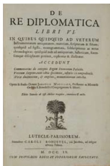
SL.3: Naslovnica knjige De Re diplomatica libri sex

Razmislmo li sada o uvodnim riječima i citatu Marca Blocha iznesenog na početku, lako ćemo shvatiti zašto se iz izrazito produktivnog i za znanost naprednog 17. stoljeća izvaja ime Jeana Mabillona. Njegov je znanstveni pristup, po kojemu je ustvari bio čovjek ispred svoga vremena, odredio daljnji razvoj diplomatike i latinske paleografije, ali i historiografije u cijelosti. Stoga je upravo Mabillon po svojoj učenosti, ali i skromnosti o kojoj nam govore i njegove vjerojatne zadnje riječi » humilité, humilité, humilité «, idealni predstavnik reformiranog benediktinskog reda. Francuski povjesničar Pierre Chaunu, Mabillonovu ulogu u stvaranju novog, prosvijećenog duha također uočava kada ga uz Jeana de Launoya i Fleuryja naziva »humanističkim osloboditeljem parazitskih praznovjerica«. No, Mabillonovu učenost najbolje opisuju njegov suvremenik, bibliotekar iz Firence Antonio Magliabechi nazvavši ga museum inambulans et viva quaedam bibliotheca . Svakako, Mabillon nije bio samo osamljeni znanstvenik u inače mračnome dobu, dapače, njegova je učenost i veličina stečena na čvrstim temeljima koje su postavili crkveni redovi u bogatim samostanskim opatijama