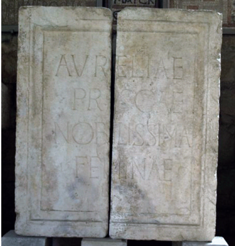
Slika 2. Postolje kipa Dioklecijanove žene Aurelije Priske iz Salone, Arheološki muzej, Split

ali da su se ukućani nikomedijske palače pitali je li uopće živ. Zbog opasne bolesti moglo bi se pomisliti da to bijaše razlog povlačenju, ali drugi Laktancijev pasus neporecivo svjedoči da je čin bio promišljen i dio sustava, te ga se moglo odgadati ili modificirati, ali je ipak bilo zamišljeno da se provede. Naime, da bi sklonio Dioklecijana da se povuče, Galerije je iznio da je upravo on dužan očuvati poredak koji je stvorio. 25 Tome se Dioklecijan nije mogao oduprijeti, pa je odstupio. Ako je uistinu htio duže zadržati državne uzde u rukama, nije to kanio trajno, nego je želio pričekati trenutak pogodniji za odlazak. Na to bi upućivao govor o strahu od neprijatelja. 26 Prema tomu nema dvojbe da je povlačenje, kao i mnogo drugoga, planirao, pripremao i konačno provodio. Upravo je Galerije bio među najustrajnijim pobornicima novog načina nasljeđivanja prijestolja. 27 Iz toga jasno proizlazi da to nije bila improvizacija, već domišljeni sustav.