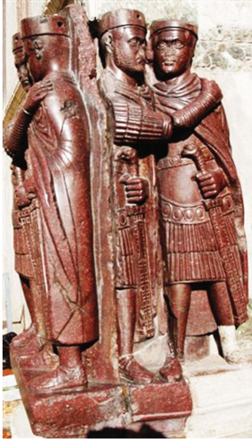
Slika 3. Kipovi tetrarha (jedan do drugog) Venecija, Sv. Marko

se iz dalekog Splita. Savjetovanje je započelo 11. studenoga godine 308. Natpis iz Salsovije u provinciji Skitiji spominje 18. studenoga kao god Licinijeva dolaska na vlast ( dies imperii ), što znači da je odluka o rekonstrukciji druge tetrahije pala poslije jednodnevnog vijećanja. Zapravo je s Dioklecijanovim „blagoslovom“ utemeljena treća tetrahija. 46 Logično je pretpostaviti da je sastanak završio svečanim imenovanjem novih i potvrdom starih careva.