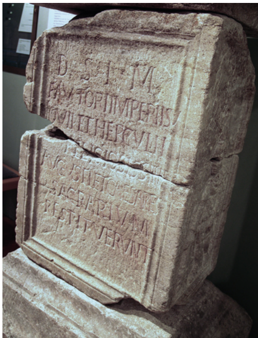
Slika 4. Natpis tetrarha u Mitrinu čast poslije vijećanja u Kanuntu, Museum Carnuntinum, Bad Deutsch-Altenburg

Neki pak izvori ukazuju na kasniji datum Dioklecijanove smrti. Zosim, Historia nova 2, 8, 1, Consularia Constantinopolitana ( Chronica Minora I, 231), Papyrus Berolinensis 13296 (možda je godina korigirana, što upućuje na svjesno popravljanje uočene pogreške, i Chronicon Paschale 5 87 donose da je Dioklecijan umro tek 3. prosinca 316. godine. Stoga valja ozbiljno posumnjati da je Laktancije kronološki dobro impostirao Dioklecijanovu smrt. Samoubojstvo bi, čini se, bilo dobro preuranjeno dok su obje žene živjele: Maksimin Daja nije ih osudio na smrt, već na prognaništvo. Laktancije je djelo o progoniteljima kršćana pisao između 315. i 320. godine. Je li imao pouzdane informacije što se događa dalekome Splitu? On je već prethodno barem dva puta načinio krupne kronološke greške (Konstancijeva smrt i tobožnja podudarnost Maksencijeve proslave quinquennialia s Konstantinovim dolaskom pod zidine Rima). Kronološka su odstupanja veća od godine dana. K tomu su tri gore navedena izvora prilično vjerodostojna, osobito Berlinski papirus. Znajući za Dioklecijanovu smrt, Laktancije je mogao izokrenuti neka poglavlja da bi postigao literarno-dramatski efekt. Višekratno se zapaža da mu kronologija nije osobito važna. Stoga je logičnije Dioklecijanovu smrt datirati u 316. godinu. 88 Prema tomu, Dioklecijan bi u svojoj splitskoj rezidenciji