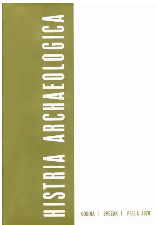
Sl. 1 Naslovnica prvog broja časopisa Histria archaeologica Fig. 1 The title page of the first issue of the Histria archaeologica bulletin