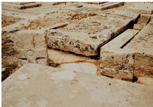
Slika 9 – Figure 9

Na groblju oko crkve Sv. Tome u Radovčićima 29 je danas dislocirani kameni križ koji je prvobitno bio obilježje groba – uzglavnik. Relativno je manjih dimenzija, a isklesan je nešto naglašenije reljefno na manjoj kamenoj ploči. Njegovi krakovi zauzimaju cijelu površinu ploče, a pripada tipu grčkog križa. U sredini je okruglo pliće lijepo izvedeno udubljenje. (sl. 9; Karta 1/14).