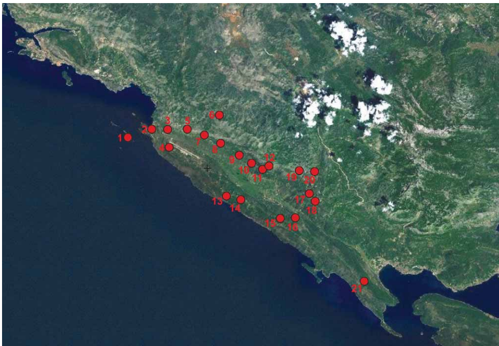
Karta 1. Konavle – lokaliteti sa srednjovjekovnim križevima

1. Crkva sv. Mihajlo, Mrkan; 2. Crkva sv. Đurđe, Cavtat; 3. Crkva sv. Petar, Zvekovica; 4. Crkva sv. Đurđe, Močići; 5. Crkva sv. Ilija, Uskoplje; 6. Crkva sv. Luka, Brotnice; 7. Crkva sv. Dmitar, Gabrile; 8. Crkva sv. Martin, Drvenik; 9. Crkva sv. Mihajlo, Mihanići; 10. Crkva sv. Srđ i Bakh, Pridvorje; 11. Crkva sv. Ana, Lovorno; 12. Crkva sv. Ilija, Lovorno; 13. Crkva sv. Đurđe, Popovići; 14. Crkva sv. Toma, Radovčići; 15. Crkva sv. Petar, Karasovići; 16. Crkva sv. Pavle, Pavlje brdo; 17. Crkva sv. Toma, Vataje-Zastolje; 18. Crkva sv. Vid, Vodovađa; 19. Crkva sv. Mala Gospa, Dunave; 20. Crkva sv. Barbara, Dubravka; 21. Crkva sv. Spas, Vitaljina;