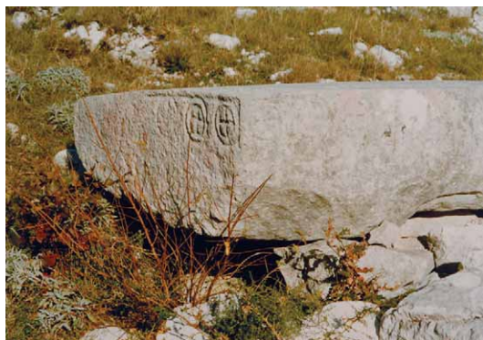
Slika 4b – Figure 4b