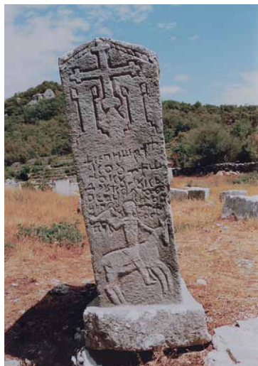
Slika 6 – Figure 6