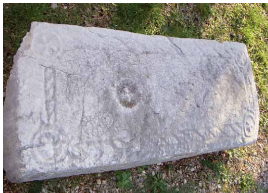
Slika 5 – Figure 5

Na gornjoj plohi deblje nadgrobne ploče kod crkve Sv. Dmitra u Gabrilima 15 unutar pravokutne kompozicije formirane od imitacije uvijene vrpce s rozetama u kutovima, na početku gornje trećine plohe nalazi se plitko okruglo udubljenje. Udubljenje okružuje vrlo plitko reljefno izveden prsten. U udubljenju je plitko reljefni grčki križ, ali u cijeloj predstavi je opet riječ o tipu sunčanog križa (WENZEL 1965: T. XXV,9) (sl. 5; Karta 1/7).