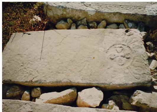
Slika 1 – Figure 1

Križ istog tipa nalazi se i na dislociranom mramoru kod crkve Sv. Mihajla u Mihanićima. 11 Urezan je na gornjoj plohi nešto većeg kamenog kvadra (sanduka). Neposredno ispod križa je mladi mjesec čiji krakovi su okrenuti prema vani u odnosu na križ. U istom nizu, ali već pri kraju plohe je