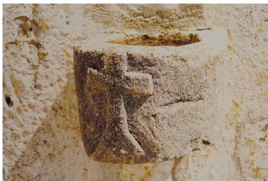
Slika 12 – Figure 12

Na ulazu s desne strane u prvotno romaničku crkvu Sv. Spasa u Vitaljini (VUKMANOVIĆ 1980: 335; ŽERAVICA 2002: 18–19; TOMASOVIĆ 2008: 110) je ugrađena škropionica. Skoro cijelu njenu prednju stranu zauzima masivni duboko reljefno istaknuti latinski križ s trokutnim postoljem (ŽERAVICA 2002: 18, sl. 5) (sl. 12; Karta 1/21).