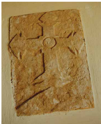
Slika 10 – Figure 10

U sjeverni zid trijema crkve Sv. Tome u Radovčićima uzidan je križ isklesan na kamenoj ploči. Moguće da je tu prenesen s groblja gdje je bio oznaka groba. Klesan je plitko reljefno, tri gornja kraka sežu do ivica ploče, a donji, nešto produženi krak ne doseže kraj ploče. To je tip latinskog križa, ali sa specifičnostima u obliku udubljenja u obliku romba na završetku krakova križa. (sl. 10; Karta 1/14).