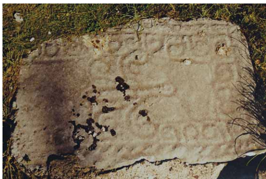
Slika 7 – Figure 7

nasuprot postavljena kraka križa. Oni završavaju uvijenim viticama (sl. 7; Karta 1/19). Ovo je predstava križa tipa »drvo života« – arbor vitae« (crux virescens). Relativno u sličnoj maniri i tehnici je predstavljen i križ na gornjem dijelu kamene nadgrobne ploče velike nekropole mramora kod crkve Sv. Petra u Karasovićima 22 (Karta 1/15). Analogiju mu nalazimo na nadgrobnoj ploči na mramorju Sajmište u Lištici-Široki Brijeg u Humu. 23