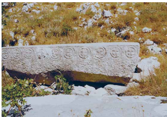
Slika 4a – Figure 4a

Na groblju kod crkve Sv. Đurđa u Cavtatu 13 je sekundarno uporabljen kao pokrov kasnijeg groba, dio preklesanog mramora. Na gornjoj plohi ploče, tamo gdje na bočnoj strani započinje kolona životinja iz scene lova, je plitko reljefno prikazan veći sunčani križ. Prsten je formiran od dvije polulopte, a krakovi križa nisu na bilo koji način profilirani, nego su jednostavno pravolinijnski. Horizontalni krak križa je postavljen na mjestu gdje se spajaju polulopte. Analogiju možemo navesti na