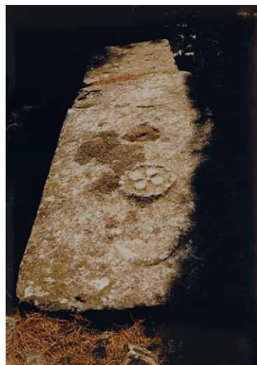
Slika 2 – Figure 2