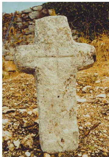
Slika 8 – Figure 8

Na groblju crkve Sv. Đurđe u Močićima (ŽERAVICA 2002: 13, sl. 2; BRAUTOVIĆ 2005: 74–75; TOMASOVIĆ 2008: 109) nalazi se lijepo isklesani latinski križ. Gornji vertikalni krak se