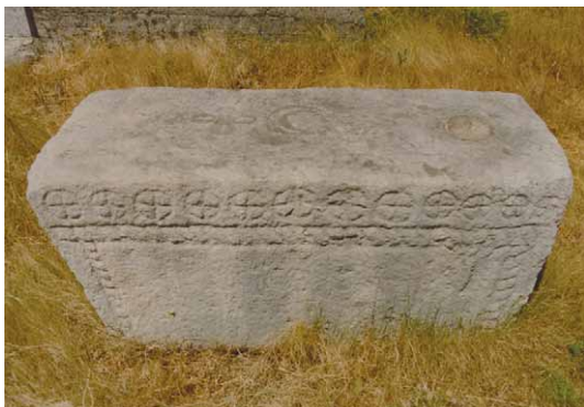
Slika 3 – Figure 3

okruglo udubljenje. Na ovom nadgrobnom spomeniku pri vrhu bočne dužne strane je niz od dvanaest sunčanih križeva izvedenih urezivanjem. Ispod tog niza je isklesana horizontalna tordirana traka (»uže«). Na oba njena kraja su u načinu izrade njoj identične vertikalne trake (sl. 3; Karta 1/9).