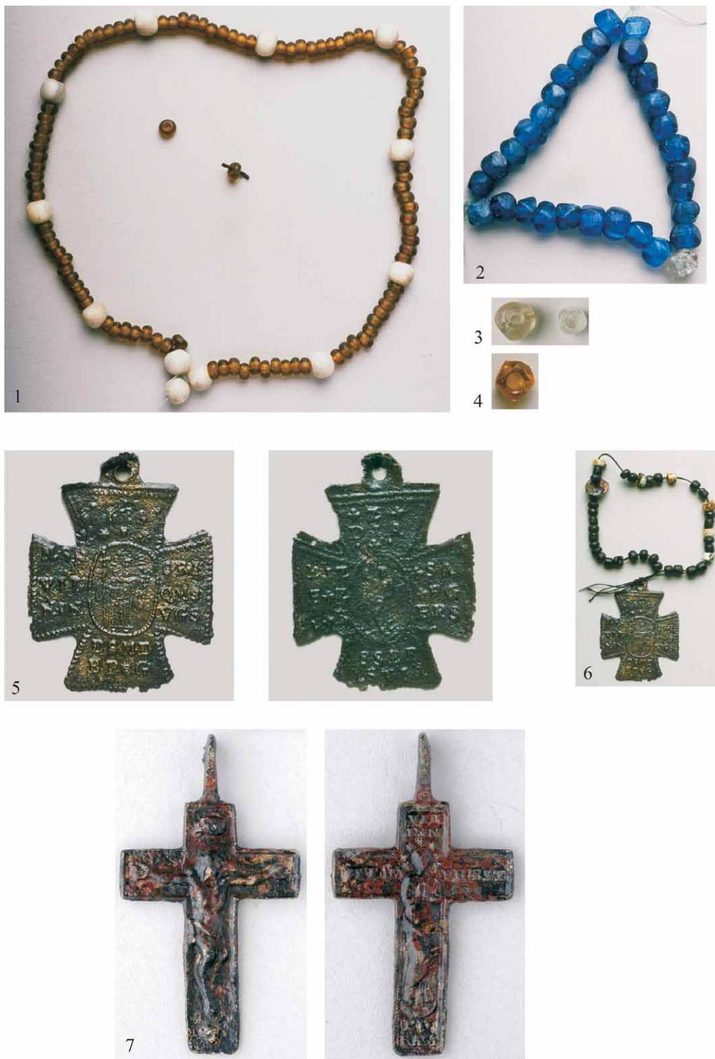
Tabla 2 – Plate 2