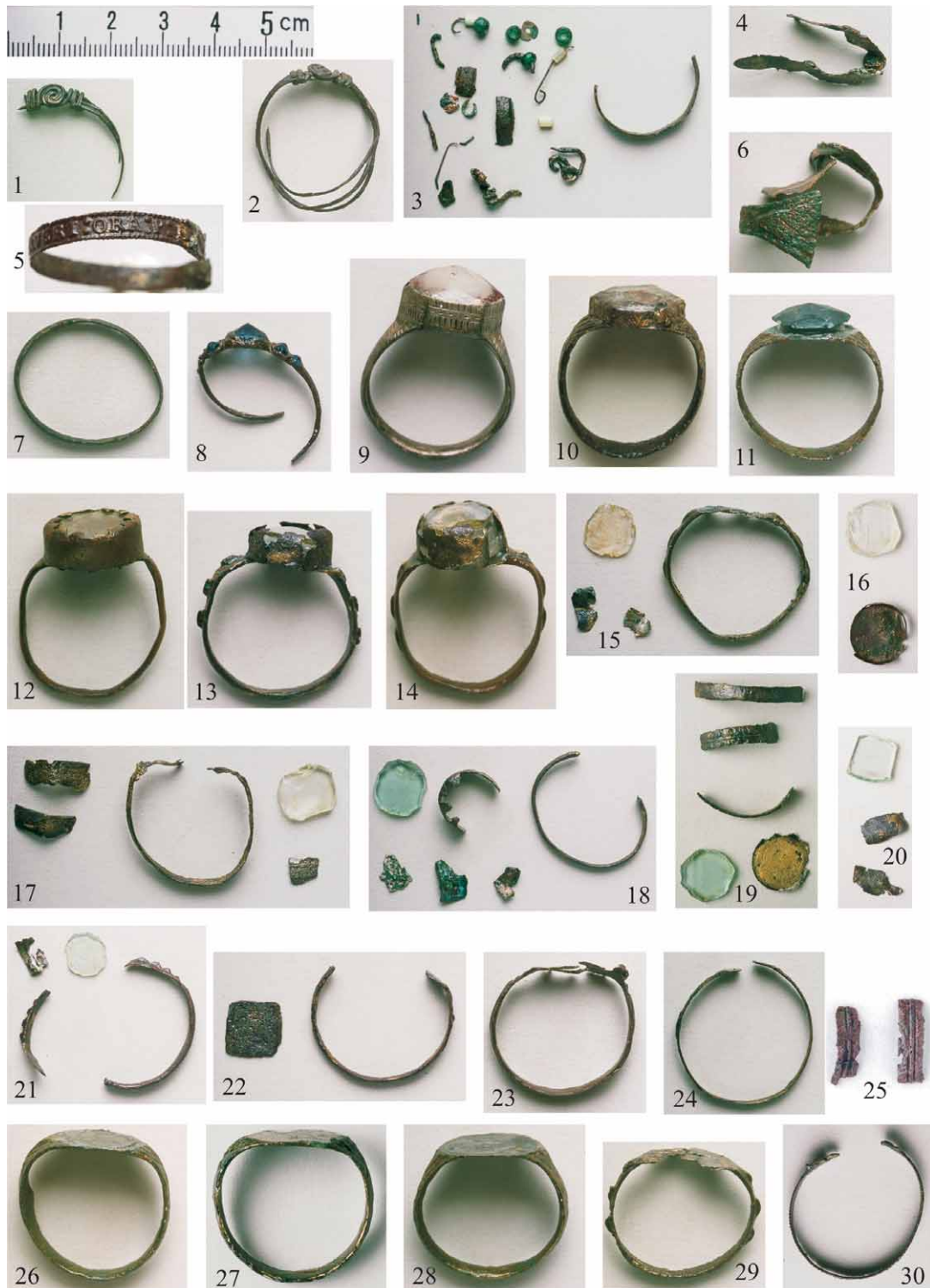
Tabla 4 – Plate 4