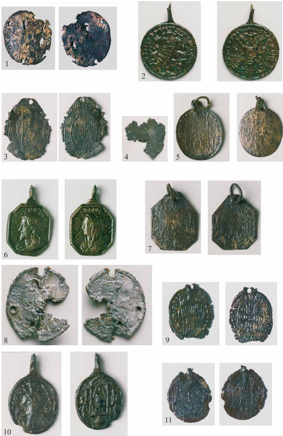
Tabla 1 – Plate 1