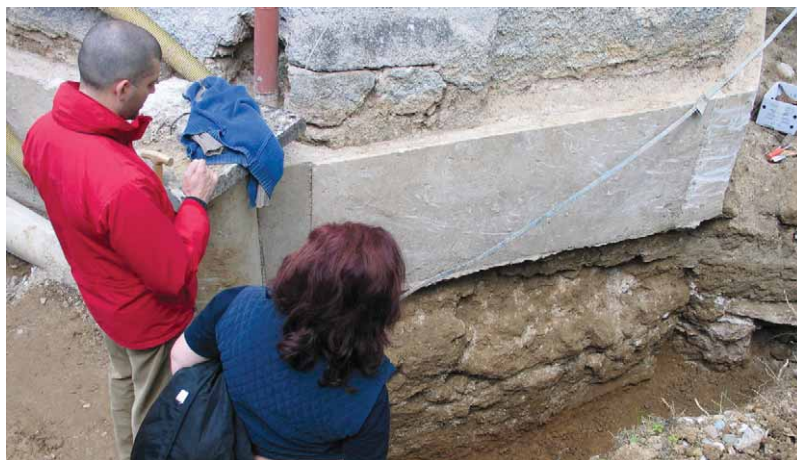
Slika 3 – pogled na temelje i betonsku oblogu u sondi 2b.

U sondi 2b vrlo je primjetna nekvalitetna izvedba betonskog ojačanja temelja i loša izvedba drenaže, koja je više naštetila zidovima crkve nego zub vremena (Slika 3). Temelji su dubine 140 cm ispod betonske obloge. Rađeni su od tuha i sivca uz obilato korištenje veziva. U ovoj je sondi bilo grobnih ukopa, ali vrlo oštećenih i parcijalnih, pa su identificirana samo četiri (grobovi 12, 16, 21, 22), i to tek ispod dubine od 150 cm. Ostali su prepoznati po nalazima medaljica, krunica i prstena.