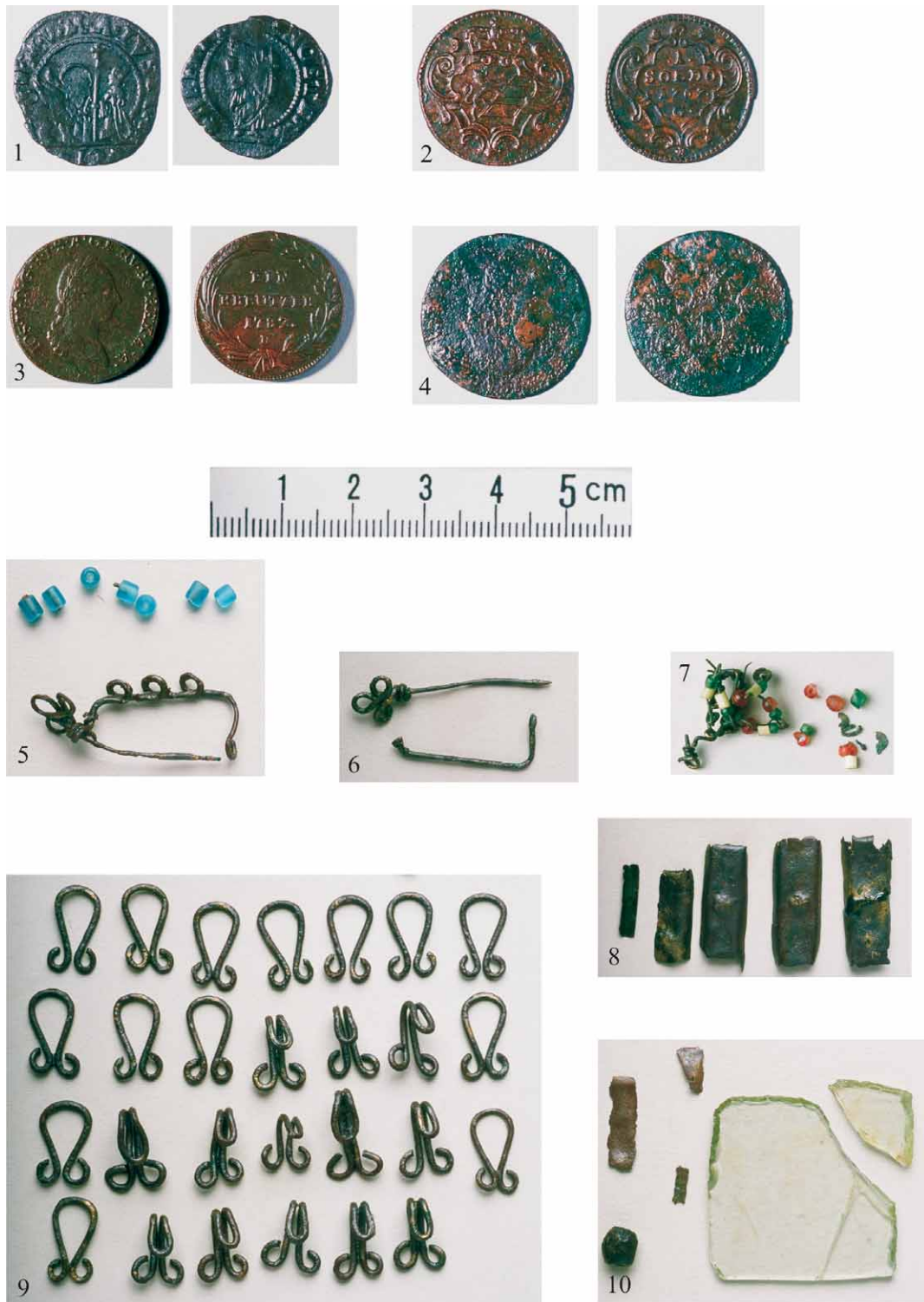
Tabla 3 – Plate 3