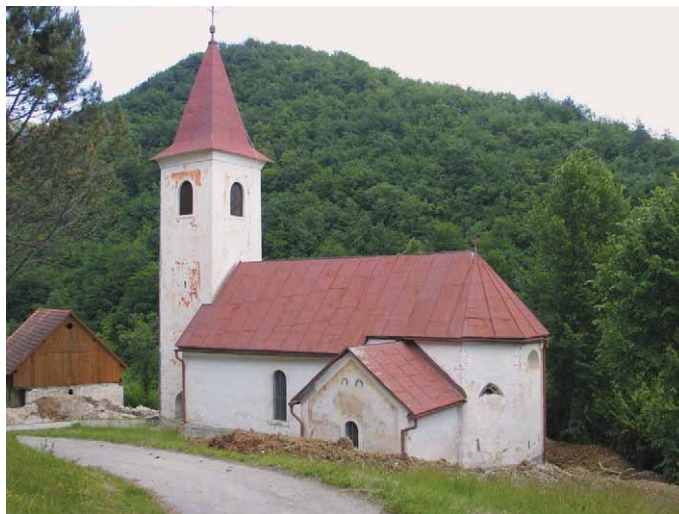
Slika 1 – crkva sv. Nikole biskupa.