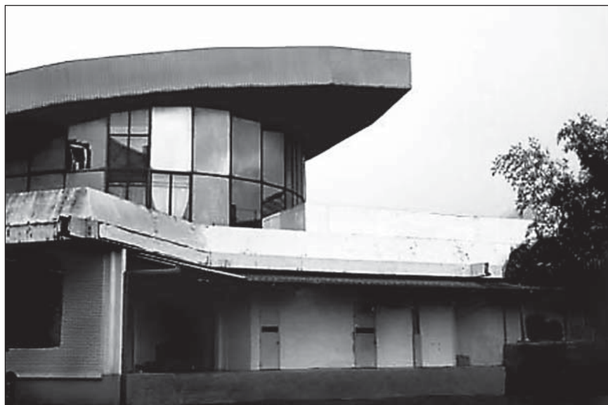
Slika 2. Ulaz u Ratnu bolnicu (danas Robna kuća Mercator).