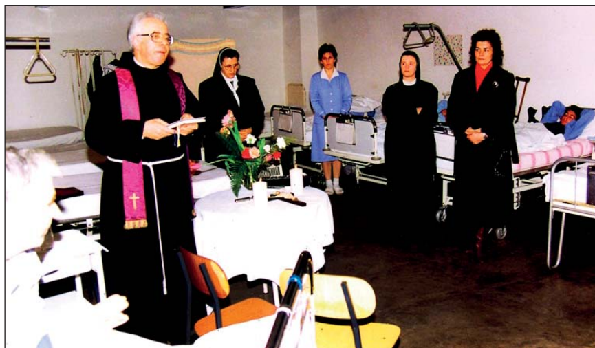
Slika 3. Blagoslov stacionara, sredinom 1992. Figure 3 Benediction of the infirmary, mid-1992.