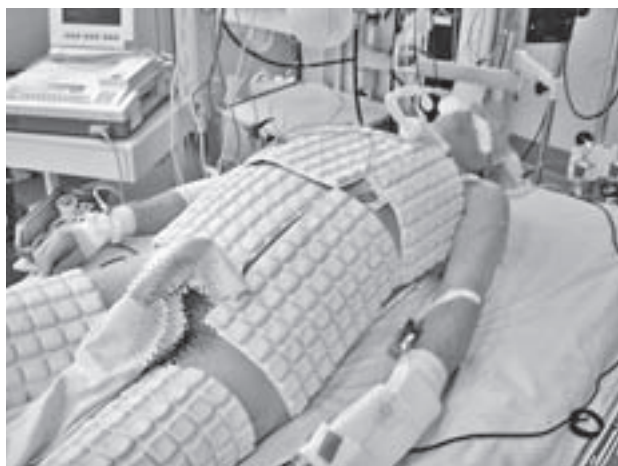
Slika 2. Primjena obloga punjenih gelom (Emcools™ Cooling Pads) u bolesnika nakon kardijalnog aresta. Oblozi dobro prijanjaju na kožu i omogućuju dobru vodljivost, temperatura obloga od -9\text{ }^{\circ}\text{C} odabrana je zbog manjeg rizika od nastanka smrzotina

Nedostatke priručnih ledenih obloga pokušavaju ispraviti industrijski pripremljeni oblozi punjeni gelom. Fizikalna svojstva gela odabrana su tako da budu što povoljnija za primjenu u pothlađivanju: gel ima veliku toplinu taljenja, količinu energije koju gel odvodi prilikom prelaska iz krutog u tekuće stanje, u krutom stanju gel zadržava elastičnost te je oblog prilagodljiv tijelu i dobro prijanja. Oblozi su opremljeni ljepljivim slojem koji ima dobru vodljivost topline i omogućuje trajno prijanjanje. Moguće je obloge stavljati na trup i ekstremitete, čak i ispod leđa bolesnika (slika 2). Električna vodljivost omogućava da se kroz oblog izvrši defibrilacija u slučaju potrebe. Osim toga, posebni hladnjaci