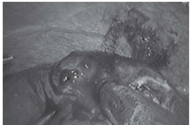
Slika 3. Uklanjanje priraslica između ošita i ciste Figure 3. Removal of adhesions between diaphragm and cyst