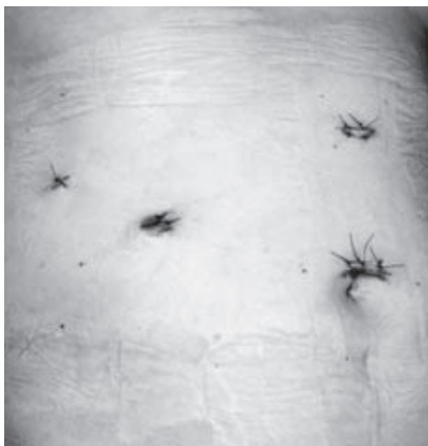
Slika 2. Mjesta incizija na trbušnoj stijenci Figure 2. Sites of incisions in abdominal wall