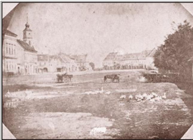
Jedna od najstarijih fotografija Osijeka, pogled na današnji glavni trg (oko 1868.)

čitava carska riznica i još mnogo dragocjenosti privatnika iz Beča, Graza, Trsta, Rijeke, Zagreba i Budima. Tek je treće osječko poslanstvo uspjelo od službenog Beča pridobiti titulu slobodnog kraljevskog grada, čije je proglašenje obavljeno 28. kolovoza 1809. godine. Utjecaj na odluku o dodjeli te privilegije bio je prvenstveno financijske prirode, a ne vraćanje usluge za pomoć prilikom najezde Napoleona. Iznos koji je trebalo platiti državnoj komori bio je popriličan; 183.723 forinte. Kolika je bila želja da Osijek postane slobodni kraljevski grad govori i činjenica da su se imućniji građani obvezali platiti i za one siromašne. Od Napoleonova zauzimanja Beča očekivalo se da bi francuska vojska mogla doći i do Osijeka, pa je napravljen plan obrane Tvrđe. U jeku najveće opasnosti taj plan objavljen je Osječanima, a izazvao je šok i nevjericu, jer je prema njemu trebalo srušiti Gornji i Donji grad radi uspješnije obrane Tvrđe, a po toj strateškoj varijanti oko tvrđavskih zidina trebao je biti čisti prostor na dometu topa u dužini od dva kilometra. U ratnoj situaciji obrane grada bila je dužnost demolirati sve na toj razdaljini. Srećom, do toga nije došlo, pa danas imamo sačuvane mnoge reprezentativne građevine iz toga doba.