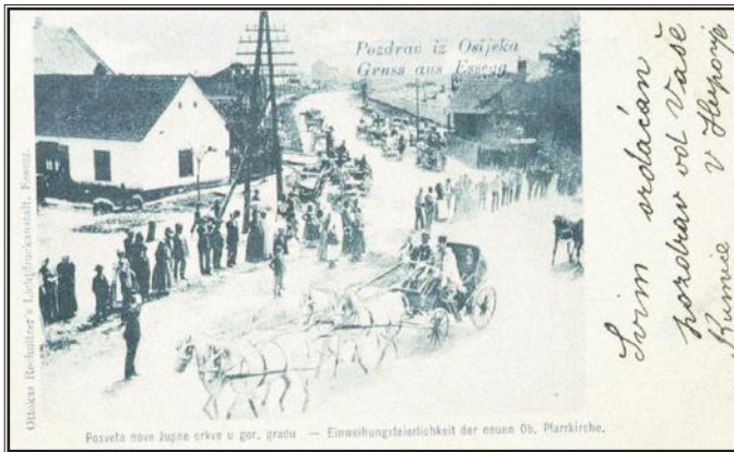
Razglednica iz Osijeka

tolko nevažna. Osijek je, uostalom, zbog svog položaja na karti monarhije početkom 19. stoljeća, bio idealan za trgovinu oružjem, što legalnu, što ilegalnu. Oružje je često prodavano ustanicama u Srbiji i drugima na Balkanu. Kao važan trgovački grad, Osijek je u to vrijeme imao šest godišnjih sajmova na koje se dovozila roba iz Europe i Azije, a izbijali su mnogi prijevori oko mjesta i datuma održavanja.