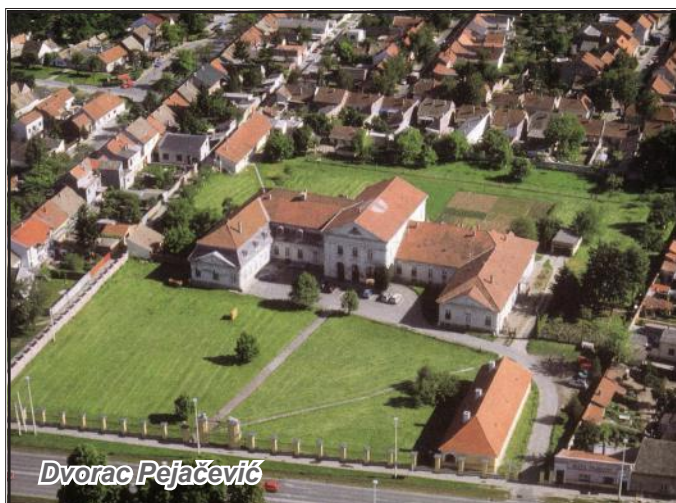
Perivoj grofa Pejačevića u Retfali

Godine 1801. izgrađen je u Retfali dvorac, a zajedno s njim je uređen i perivoj koji mu je pripadao. O njemu nemamo dovoljno podataka, ali se zna da je bio uređen u barokno – klasicističkom stilu te da je također kao i Gradski vrt često uspoređivan sa Shoenbrunnom. (Plevnik, 1987: 85) Osječani su voljeli dolaziti u ovaj perivoj jer im je bio bliži nego Gradski vrt ali i zbog toga što im je grofovska obitelj dopuštala boravak u perivoju. „Priča se da su se Osječani, kada bi nedjeljom ulazili u perivoj, uvijek duboko naklonili prema grofovskoj obitelji, koja je običavala ljeti u nedjeljno poslijepodne sjediti sa svojim gostima na terasi dvorca.“ (Šćitaroci, 1998: 273)