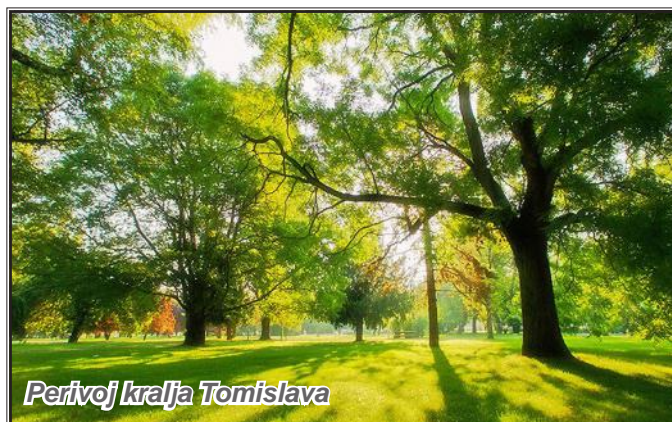
Perivoj kralja Tomislava

Tijekom vremena prostor perivoja mijenjao je svoj izgled, ali i namjenu. Tijekom 17. stoljeća to je bio dio utvrđenog podgrađa i trgovačkog središta turskog Osijeka. Bilo je to močvarno područje s drvenim kućama, a prema kartama iz 18. stoljeća očigledno je da je jedan dio korišten kao voćnjak i povrtnjak. Krajem stoljeća to je područje bilo brisani prostor između tvrđave i ciglane. Tek se u 19. stoljeću, nakon rušenja utvrđenih zidina, može govoriti o pravom perivoju. Smatra se da je kao Pukovnijski vrt (Regimentski) osnovan 1811. godine i to od strane pukovnika Volkmana. (Kiš, 1998:25) Tihomir Jukić (1996.) ne dijeli to mišljenje, naime on smatra da su u početku postojala tri zasebna vrta, a to su Oficirski, Garnizonski i Bolnički. Jedino je Oficirski vrt sadržavao značajke pravog perivoja, dok su druga dva mogla biti povrtnjaci. Tek sredinom 19. stoljeća ta se tri vrta spajaju u jedan perivoj, čemu u prilog govore i karte iz toga vremena.