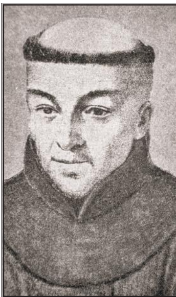
Matija Petar Katančić

do 1914. godine, maturiralo je 477 učenika, prosječno 12 po godini s tim da je do 90-ih godina 19. stoljeća broj učenika po godini bio uglavnom manji od 5, a nakon toga raste i doseže svoj vrhunac 1902. godine, kada je maturiralo 34 učenika. Ako bi se zbrajali maturanti obaju gimnazija, najviše učenika je maturiralo 1905. godine, njih 65. (Pregled razvoja osječkih gimnazija od 1729. do 2000 godine, 2001: 46-49) Kada bi se gimnazijalcima pribrojali i maturanti strukovnih i ostalih srednjih škola, dolazimo do brojke od nekoliko tisuća obrazovanih ljudi, što je svakako bio temelj za društveni, ekonomski i kulturni razvitak.