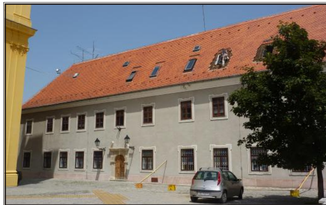
Zgrada Velike gimnazije do 1737. godine (danas Dom tehnike)

Ravnatelji gimnazije bili su isusovački superiori , koji su ujedno bili i osječki župnici te članovi županijske skupštine, a kao takvi, bili su dobro upućeni u politička, vojna, vjerska i gradska pitanja.