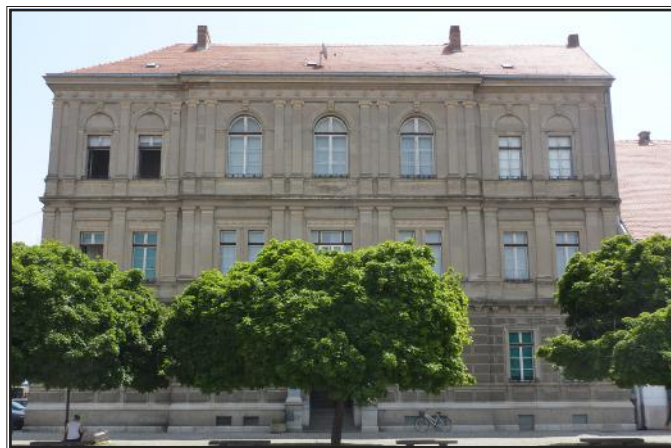
Zgrada Velike gimnazije od 1882. godine (danas Ekonomska i upravna škola)