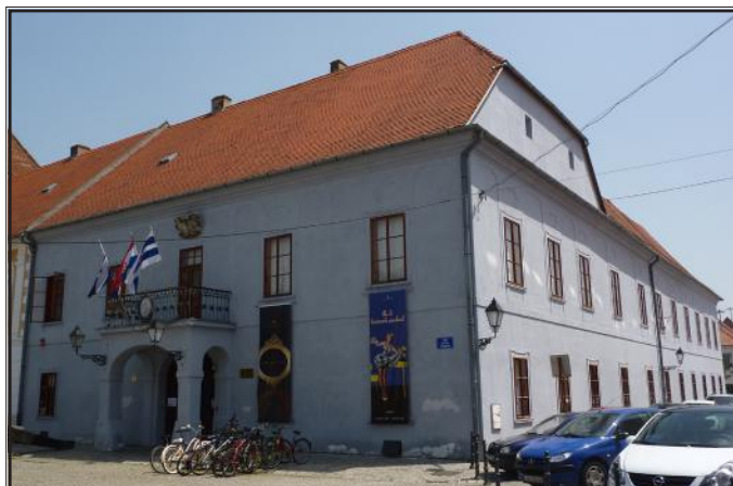
Zgrada Velike gimnazije od 1765. godine (danas Muzej Slavonije)