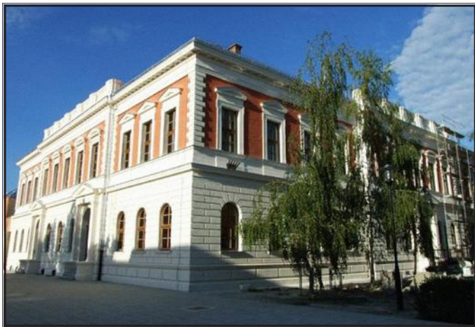
Zgrada Kraljevske muške učiteljske škole (danas OŠ Jagode Truhelke)

Učenici su u toj školi dobivali solidnu opću i stručnu naobrazbu, a uz nastavu i praktični rad velika se pozornost posvećivala i ekskurzijama.