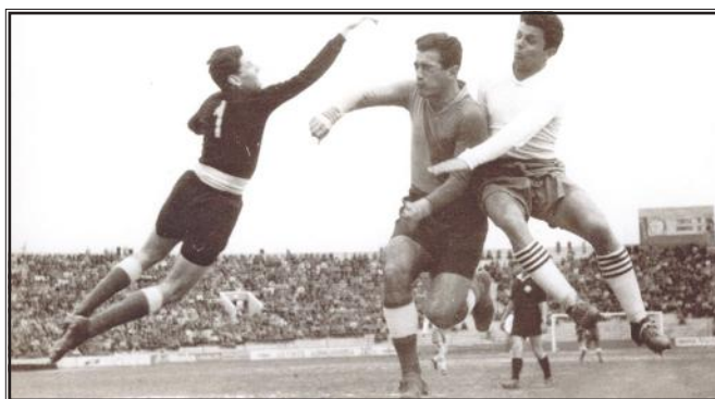
Utakmica NK Proleter i BSK, 1955.

na neutralnom terenu u Sarajevu gdje su Osječani pobjedili rezultatom 1:0, a zatim su morali još igrati s varaždinskom momčadi FD Tekstilac. Nakon dviju pobjeda FD Proleter napokon je ušao u Drugu saveznu ligu. Izgradnja stadiona u Gradskom vrtu započela je 9. kolovoza 1949. godine i u njoj su sudjelovala sva osječka sportska društva i klubovi. Godine 1952. nogometaši Proletera postaju prvaci Hrvatske, a iduće sezone sudjeluju u Hrvatsko-slovenskoj ligi. U sezoni 1952./53. Proleter postaje prvakom Hrvatsko-slovenske lige te se plasirao u Prvu saveznu ligu, a najzaslužniji za to bio je nogometaš Franjo Rupnik koji je