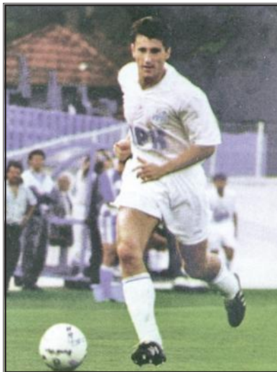
Davor Šuker u dresu NK Osijek, 1986.

u odlučnoj utakmici protiv NK Borca iz Banja Luke zabio svih pet golova. (Povijest sporta grada Osijeka, 1998: 144) Od 1950. godine nogometni klub postaje samostalan i kao takav nastupa do 1962. godine, kada opet uzima svoje staro ime Slavonija. Godine 1967. dolazi do promjene imena te od tada pa sve do danas klub nosi ime NK Osijek. U Prvu saveznu ligu NK Osijek ulazi 1976. godine te se u njoj zadržava tri godine. Nakon jedne sezone u drugoj ligi NK Osijek opet ulazi u prvu ligu. U sezoni 1965./66. klub je bio četvrtfinalist kupa Jugoslavije te je nastupao na međunarodnoj sceni. (Sršan, 1994: 129) Prvotimac NK Osijek Branimir Iličin bio je 1971. godine uvršten u olimpijsku nogometnu reprezentaciju Jugoslavije. U sezoni 1985./86. NK Osijek imao je dva člana omladinske državne reprezentacije, Osječane Davora Šukera i Miroslava Žitnjaka: (Povijest sporta grada Osijeka, 1998: 144)