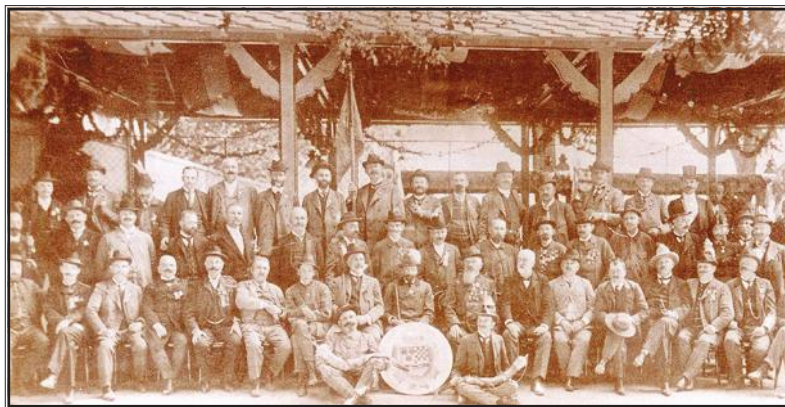
Prvo hrvatsko-slavonsko Zemaljsko nagradno streljanje organizirano u Osijeku, 1905. godina.

bili su nazočni na svim značajnijim natjecanjima u Gradskome vrtu, a organizirali su 1931. godine Prvo "kraljevsko" gađanje. Tijekom 1913. godine na osječkoj streljani uvedeno je gađanje na pomičnoga zeca i gađanje na glinene golubove. (Povijest sporta grada Osijeka, 1998: 27) Početkom