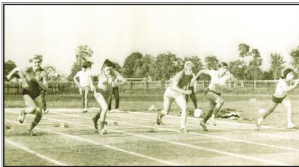
Atletičarke AK Slavonija na prvenstvu Hrvatske, 1963.

Slavonija. Poslije toga redaju se uspjesi koji su posljedica kvalitetnog rada. Članovi Slavonije postaju prvaci Jugoslavije, obaraju rekorde i sudjeluju na međunarodnim natjecanjima.