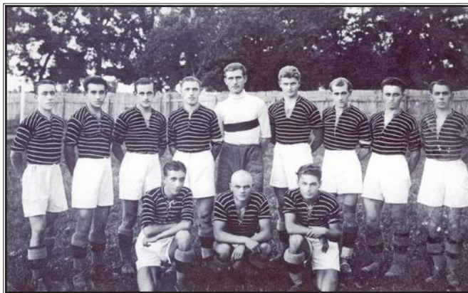
Momčad ŠK Slavija u prugastim dresovima, 1925.

Nogomet je u kasnijim godinama u Osijeku dobio sve veći broj poklonika, pa se i poslije 30-tih godina osnivaju novi klubovi: Rapid, Gvožđar i NK Jugoslavija. Između dvaju ratova najzapaženije rezultate postizala je Slavija koja se natjecala u prvoj ligi. (Sršan, 1994: 125)