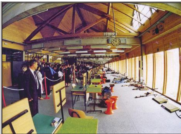
Prvenstvo Europe na streljani Pampas, 1985.

Budući da su vatrogasne potrebe sve više dolazile u prvi plan, 1872. godine u Gornjem gradu osnovano je Dobrovoljno gombalačko (gimnastičko) i vatrogasno društvo. Gombalačko društvo gimnasticiralo je po sustavu