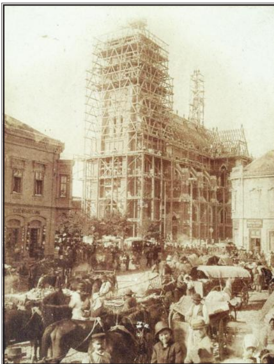
Izgradnja župne crkve Sv. Petra i Pavla (danas osječka konkatedrala)

Strossmayer je posjetio Osijek 27. rujna 1850.,