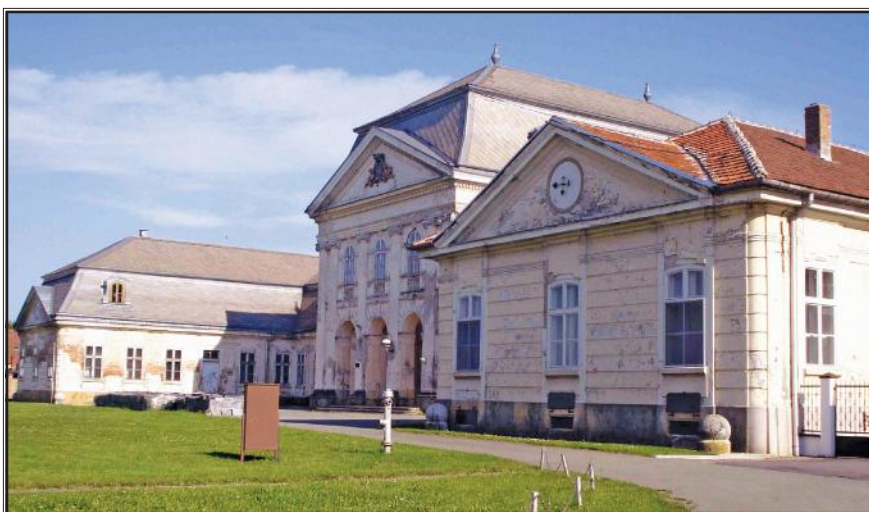
Dvorac Pejačević u Retfali

Današnje osječko naselje Retfala izvorno je bilo srednjovjekovno selo koje je pojedine ruralne karakteristike zadržalo sve do suvremenoga doba. Cilj je ovoga rada ukazati na demografski i urbanistički razvoj te transformaciju naselja od prvoga zabilježenog popisa sredinom 16. stoljeća, pa sve do sredine 20. stoljeća. Izvori na kojima se temelji rad su službeni popisi koje su obavljale osmanska, a potom austrijska vlast te stručna povijesna i etnološka literatura.