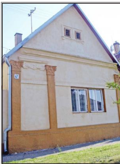
Kuća s historicističkim elementima u pročelju, S. Petőfija 67.

Raspadom Austro-Ugarske monarhije, retfalačko vlastelinstvo i perivoj dvorca Pejačević postupno su rasparcelirani i iskrčeni, a na tome je području nastala tzv. Nova ili Hrvatska Retfala. Ta se Retfala tek 1930. godine i fizički spojila s Osijekom i tada je Hrvatska Retfala imala 14 ulica i dvije stotine kuća s oko šest stotina stanovnika, koji su uglavnom radili u osječkim tvornicama, dok su se stanovnici Njemačke i Mađarske Retfale uglavnom i dalje nastavili baviti poljoprivredom. Opskrba Osijeka poljodjelskim proizvodima za sve slojeve