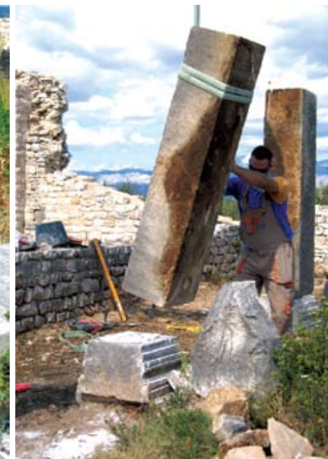
Montaža stupa na bazu

ka provincije Dalmacije Auzonija u Podstrani, te nepoznatih posjednika u Polačama kod Strožanca i Mirima u Ostrvici. 5 U carskim kamenolomima ubrani su i obrađeni kameni stupovi, masivni pragovi i pločnici, kao i pluteji i pilastri oltarne pregrade za sakralnu građevinu unutar vile s portikom. Ta je crkva, koju još naslućujemo pod slojem zemlje u unutrašnjosti sklopa, s okolnim građevinama sred prostranog agrarnog imanja mogla biti povjerena manjoj redovničkoj zajednici. Pišući o počecima monaštva na otoku Braču, Andrija Ciccarelli spominje i lokalitet Brig iznad Postira gdje su uz brojne druge na otoku obitavali monasi benediktinskog reda u samostanskoj zajednici. 6 Igor Fisković smatra da se radi u najmonumentalnijem ranokršćanskom samostanu koji je pripadao predbenediktinskoj zajednici. 7 Analiza pronađenih zidova sugerira da sklop nije građen za samostansku zajednicu već se radi o naknadno adaptiranoj kasnoantičkoj vili. Obradivši ranokršćansku skulpturu s Mirja izloženu u Muzeju otoka Brača u Škripu, Emilio Marin je istaknuo ikonografsku raznolikost pluteja, ali taj je inventar u međuvremenu obogaćen novim nalazima. 8