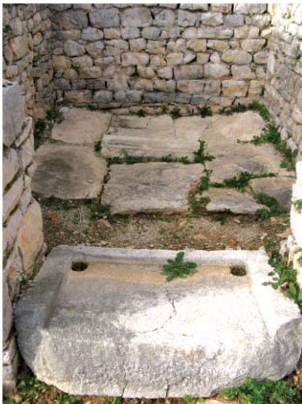
Pločnik male prostorije u južnom rizalitu

dijelom sačuvan pločnik od velikih kamenih ploča kao i kameni prag s tragovima dva stožera za vratnice. U unutrašnjost sjevernog rizalita nije se moglo ući iz trijema, već iz dvorišta uskim popločanim prolazom. Tu je smješten termalni sklop koji nije sasvim definiran, ali je pronađena manja polukružna piscina i eksedra s tragovima šupljih opeka za zagrijavanje.