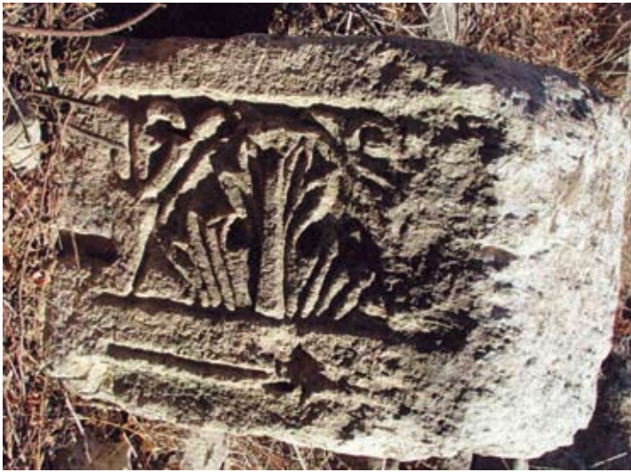
Polukapitel sa Mirja ukrašen akantusovim lišćem

podanka medaljona. Takav nadvratnik mogao je stajati samo nad ulazom u neki sakralni sklop ili vjerojatnije crkvu. U unutrašnjosti sklopa između dva velika rizalita zapadnog pročelja pronađen je niz četvrtastih baza s prevaljenim monolitnim kamenim stupovima. Stupovi četvrtasta presjeka (198 x 39 x 49 cm) srušeni su prema središnjem dvorišnom dijelu sklopa. Radi se o dijelu trijema unutrašnjeg dvorišta koji je u slijedećem trenutku nakon rušenja ostao sačuvan pod nekadašnjim putem i ogradnom gomilom. U nizu je bilo šest stupova i dva polustupa na krajevima, s nešto širim središnjim interkolumnijem.