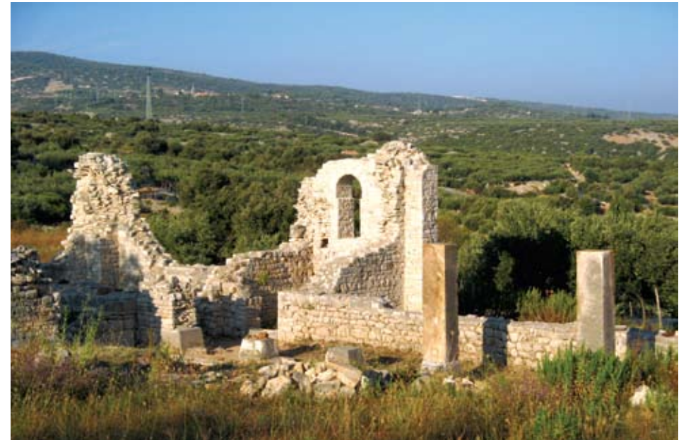
Pogled na zapadni dio kasnoantičkog sklopa

Kameni prag (šir. 180 cm) ugrađen na sjevernom ulazu, prema žlijebovima i rupama za stožer vratnica pokazuje da se dvokrilna vrata otvaraju prema unutrašnjosti. Zatim slijedi središnji hodnik u smjeru juga, s prostorijama na obje strane koje u otvorima imaju još pragove in situ . Sudeći po jedinstvenom sloju rušenja, ono je nastupilo naglo jer su svi lukovi pali pored vrata sa sačuvanim klinasto poredanim kamenjem i vezivom. Na sjevernom perimetru sklopa uz zapadnu polovicu dodan je aneks L oblika sa izduženim prostorijama i cisternama koje su izvana ojačane kontraforima. Na sjeveroistočnom i jugoistočnom uglu je veća četvrtasta prostorija koja je poput kule za bočnu obranu izbačena na pročelju. Uz uže istočno pročelje do predvorja slijedi niz manjih prostorija, među kojima su i cisterne, koje u pravilu sabiraju vodu na rubnim dijelovima sklopa.