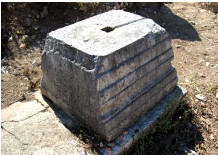
Detalj baze portika s preklesanom stranom

Mirju je vanjski perimetar razveden izmjeničnim volumenima što je preuzeto iz pravila antičke vještine ratovanja. U tlocrtu cjeline spojena su dva sustava koji se spajaju po dijagonalnoj osi od sjeveroistočnih do jugozapadnih vanjskih ulaza. Naime sjeverna i zapadna strana spajaju se pod pravim kutem, kao što i južna sa istočnom formira isti odnos.