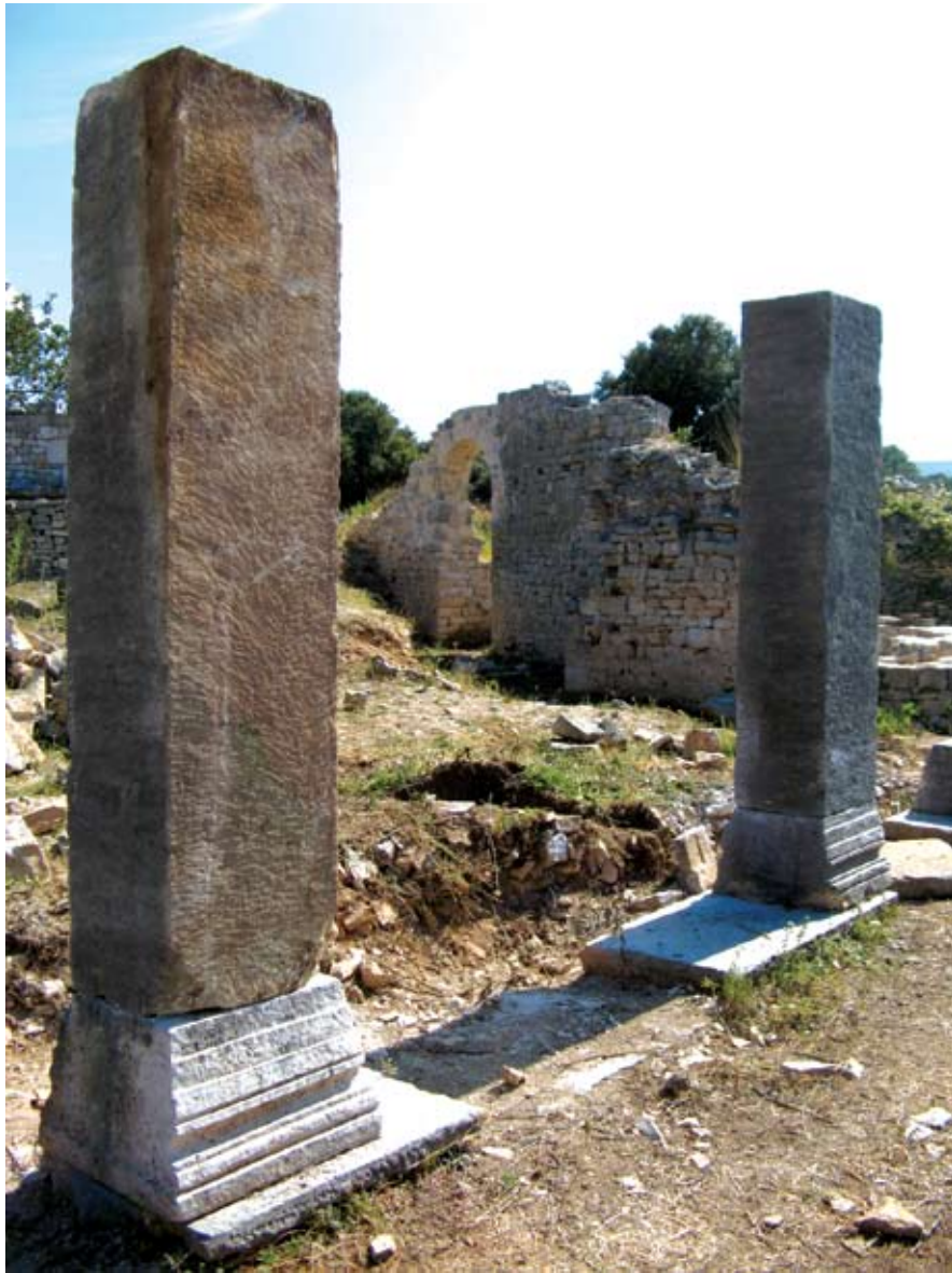
Pogled na portik nakon postavljanja stupova

U ovom prilogu analizirat ćemo portik na zapadnoj strani sklopa na Mirju kao kasnoantičku arhitektonsku varijantu trijema sa širim središnjim interkolumnijem i stupovima s ravnim gređem. Predložak za ovakvu ritmizaciju stupova prepoznajemo na južnom pročelju carske palače u Splitu koja je zasigurno bila uzor i inspiracija graditeljima ovog malog rezidencijalnog zdanja.