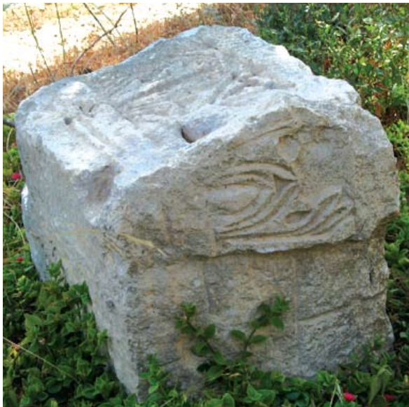
Polukapitel sa Mirja s ugaonim istakom

podanka medaljona. Takav nadvratnik mogao je stajati samo nad ulazom u neki sakralni sklop ili vjerojatnije crkvu. U unutrašnjosti sklopa između dva velika rizalita zapadnog pročelja pronađen je niz četvrtastih baza s prevaljenim monolitnim kamenim stupovima. Stupovi četvrtasta presjeka (198 x 39 x 49 cm) srušeni su prema središnjem dvorišnom dijelu sklopa. Radi se o dijelu trijema unutrašnjeg dvorišta koji je u slijedećem trenutku nakon rušenja ostao sačuvan pod nekadašnjim putem i ogradnom gomilom. U nizu je bilo šest stupova i dva polustupa na krajevima, s nešto širim središnjim interkolumnijem.