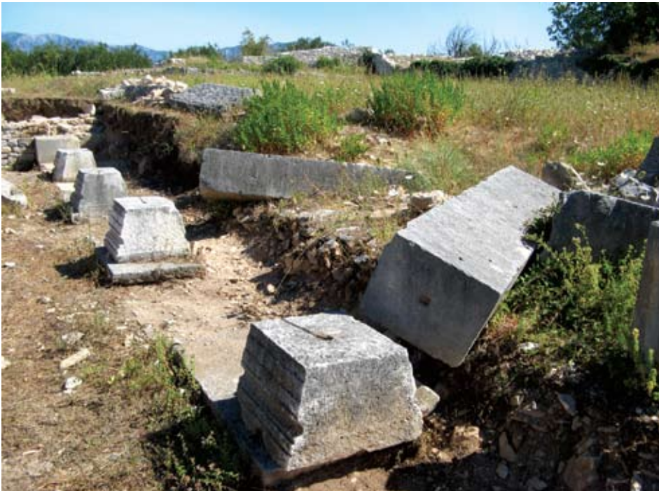
Baze trijema s obrušenim stupovima

Mirju je vanjski perimetar razveden izmjeničnim volumenima što je preuzeto iz pravila antičke vještine ratovanja. U tlocrtu cjeline spojena su dva sustava koji se spajaju po dijagonalnoj osi od sjeveroistočnih do jugozapadnih vanjskih ulaza. Naime sjeverna i zapadna strana spajaju se pod pravim kutem, kao što i južna sa istočnom formira isti odnos.