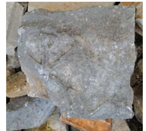
Dio nadvratnika s Kristovim monogramom sa Mirja

Sudeći po monumentalnosti i širini, glavni ulaz je bio na jugozapadu. Iz izduženog predvorja, flankiranog četvrtastom ugaonom prostorijom s križnim svodom i trapeznom prostorijom iz koje su se račvale komunikacije za dvorište i gornji kat, ulazilo se u dvorište s trijemom na zapadu. U gomili na istočnom rubu sklopa pronađen je dio monumentalnog nadvratnika sa Kristovim monogramom u središtu i valovitim trakama koje izlaze iz