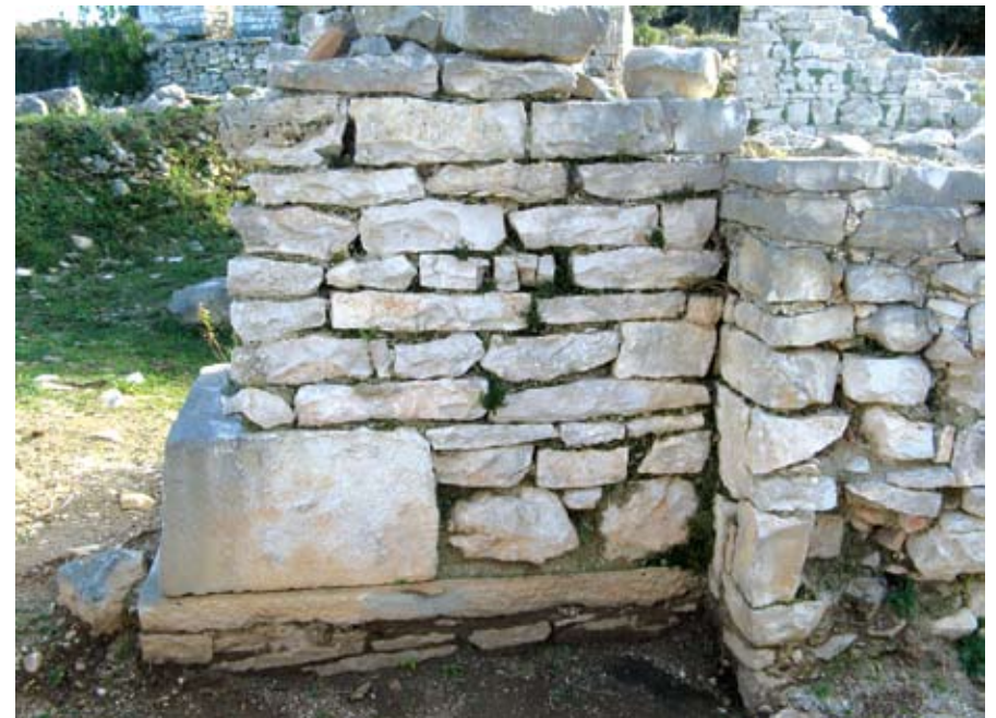
Detalj početka portika s pločom stilobata

Oba rizalita dimenzija 10 x 5 m, izvana su na uglovima imala dva plitka kontrafora, a u unutrašnjosti su bili raščlanjeni u tri manje prostorije. Na tim mjestima zidovi su sačuvani do iznad prvog kata pa je u maloj prostoriji južnog rizalita dijelom sačuvan prozor sa gljivastim lukom koji je rekonstruiran prema postojećim tragovima. U prostoriji je većim