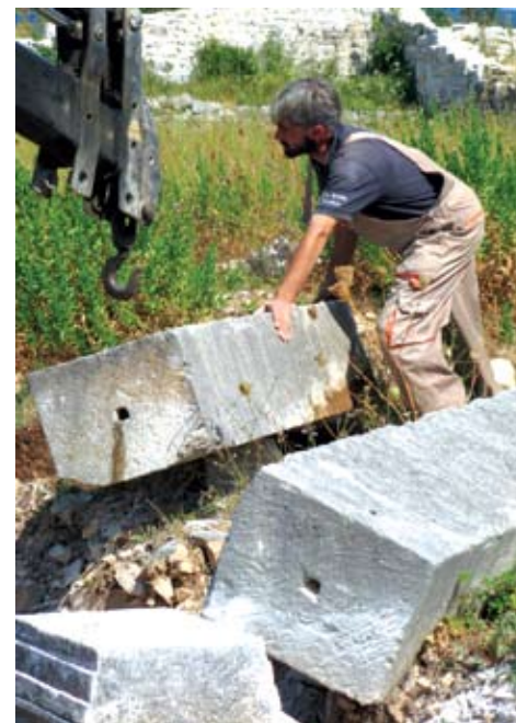
Podizanje stupova portika