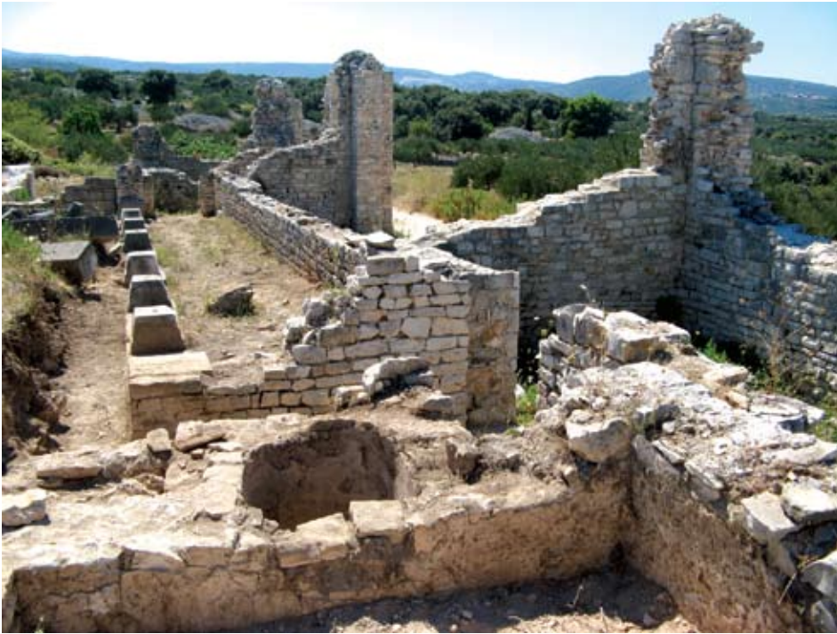
Pogled na kasnoantički sklop na Mirju

ranokršćanskim lokalitetima na Braču, u Saloni, Srimi i Omišu kao standardni kameni namještaj u opremi crkava. S pojavom nove vjere mijenja se klesarska ponuda lokalnih radionica čiji se proizvodi distribuiraju po cijeloj provinciji: ploče, grede, menze, baze oltara, pilastri oltarnih pregrada, reljefni i perforirani pluteji, masivni kubični kapiteli sa reljefnim lišćem, kovčežići za relikvije, pilastri bifora, oplate krstionica, ploče konfesija i prozorske tranzene.