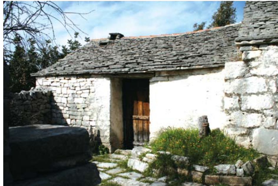
Zaseok Brda – primjer ograđenog dvorišta

Kuće su izvorno bile pregrađene u interijeru kako bi se odvojio spavaći dio od dijela za boravak, odnosno kuhinje. Interijer je redovito ožbukano. Pregrada se izvodila od drvenih dasaka,