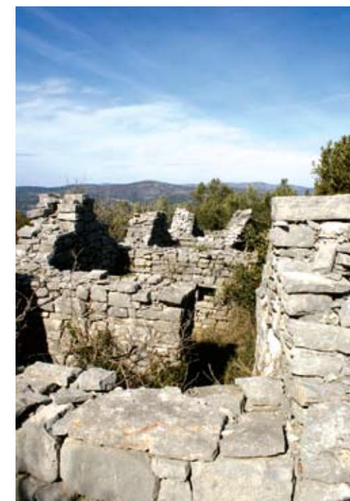
Zaseok Kovačevi dvori – pogled s juga

Objekti su razmješteni uzdužno po strmini padine. U zaselak se ulazi s jugoistoka, glavnim putom koji prolazi