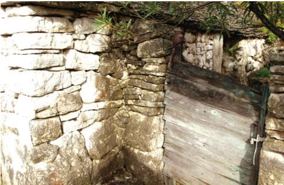
Zaseok Rušinovići – primjer dvorišne ograde s drvenim vratima sa stožerom

Sve kuće u Rušinovićima su prizemnice. Raspoznaju se dva tipa gradnje: gradnja u suhozidu od nepravilnih komada kamena pri čemu veliki blokovi čine bazu zida, oslanja-