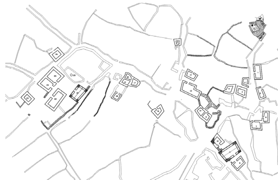
Zaseok Rušinovići - situacija

Kompleks roda Pavić sastoji se od tri kuće izgrađene u nizu, od kojih je svaka pripadala jednom bratu istoga roda. Pavići su posjedovali i jednu od dviju cisterni na užem području, te još dvije na širem području naselja, smještene uz obrađene parcele stotinjak metara udaljene od njegova središta. U njihovom je posjedu bilo i guvno sjeverno od stambenog kompleksa, te obje nastambe za ovce. Odustajanje od zbijenih struktura, promjene u tipologiji gradnje, bolji stupanj očuvanosti objekata i opreme interijera 10 upućuju