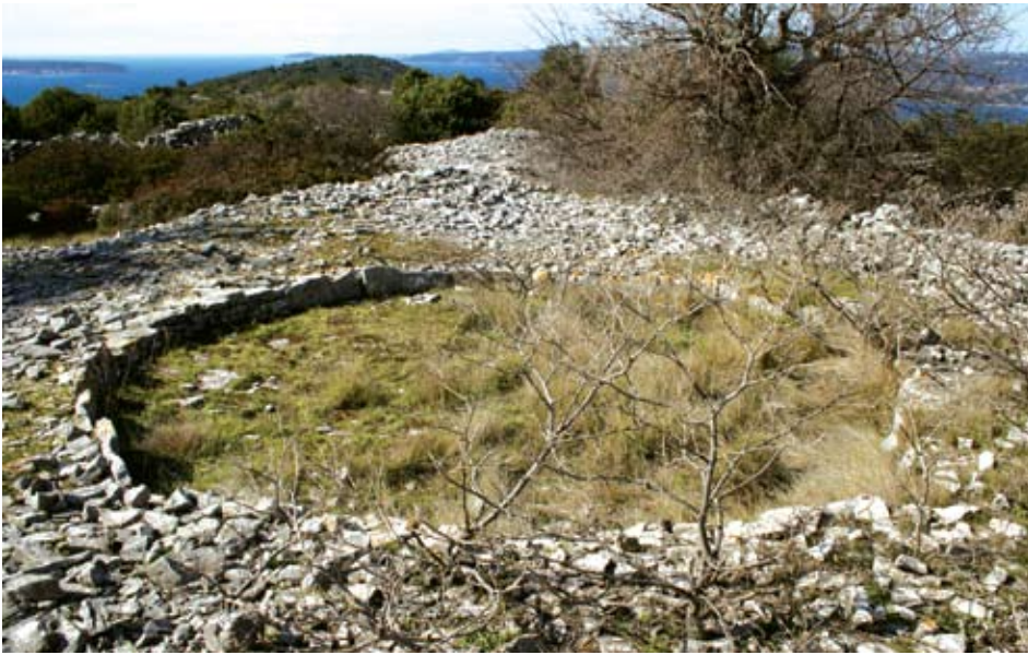
Zaseok Kovačevi dvori – pogled s juga

podno crkve sv. Nikole. Stambene zgrade i pomoćni (gospodarski) objekti grupiraju se na zapadnom i istočnom kraju naselja i to na najmanje plodnim dijelovima ukupne površine naselja. Na sjeveroistočnom rubu naselja nalazi se manja cisterna s naplovom.