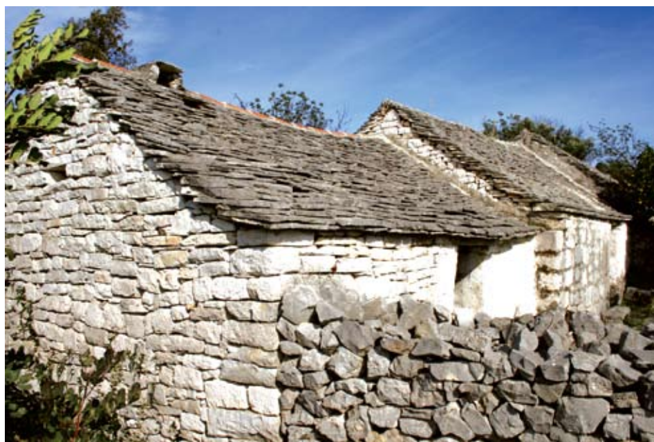
Zaseok Brda – kompleks Pavić, pogled sa zapada

Jedina zajednička karakteristika ovih triju zaselaka, koju ujedno nalazimo u svim ruralnim cjelinama otoka Drvenika, ograđena je okućnica. Od najmanjeg dvorišta u koji jedva stane kamena klupa, kakvo nalazimo u Kovačevim Dvorima, preko dvorišta s vrtom u Brdima, do dvorišta zatvorenog pročeljima kuća u Rušinovićima, posvuda je prisutan