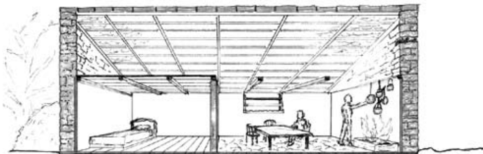
Pretpostavljeni izvorni izgled interijera prizemnice, skicu izradila Liz Carter

ogradama u jedinstvenu cjelinu. Objekti su zbijeni u manje grupe, razdvojene dvama uskim pješačkim putovima orijentiranim istok – zapad i omeđenim visokim suhozidom. Južni put od istoka vodi vanjskim rubom naselja, dok sjeverni put vodi od cisterne na istočnom dijelu naselja i ulazi u samo njegovo središte. Svi su objekti približno jednakih dimenzija, podignuti na pravokutnom tlocrtu s dvostrešnim krovovima od kojih su se sačuvali samo zabati.