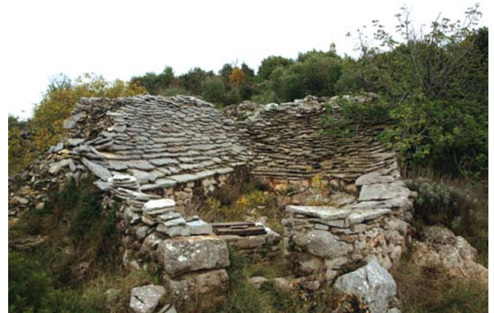
Zaseok Rušinovići – cisterna s naplovom od kamenih ploča

Ova tri odabrana primjera ilustriraju bogatstvo tipologije ruralnih naselja unutrašnjosti otoka Drvenika. Moglo bi se reći da na površini od približno 12 četvornih kilometara, koliko je velik ovaj otok, nalazimo praktički sve tipove naselja karakterističnih za kraško područje Hrvatske. Zaselak Kovačevi Dvori primjer je “zbijenog tipa” naselja nastalog na uzvisini, s objektima čiji masivni zidovi bez otvora imaju obrambenu funkciju. 7 Ono što je neobično u ovom primjeru je grupiranje objekata različitih funkcija u nekoliko okućnica