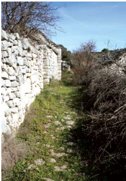
Zaseok Brda – središnji seoski put poločan inkunjavanjem

Objekti su razmješteni sjeverno i južno od puta koji ujedno čini i visinsku među; visina strehe objekata s južne strane na razini je poda kuća položenih sjeverno od puta. Zaselak obuhvaća ukupno četiri okućnice.