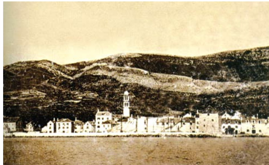
Kaštel Novi na fotografiji s konca 19. st.

izvorni izgled možemo pojmiti samo sa starih fotografija, prije nego je 1936. srušena barokna crkva, a pogotovo prije nego što je 1986. uklonjen i barokni samostan: zvonik je, naime, bio srastao sa apsidalnim dijelom stare crkve tvoreći slikoviti prostorni zglob u spoju s glavnim krilom samostana. Danas u njegovom donjem dijelu gledamo rustični vez zida koje je izvorno bilo inkorporirano u tijelo crkve, odnosno samostana; vidimo ga u posvemašnjem nesuglasju s robusnim korpusom Horvatove crkve, a pogotovo s pseudo-stilskim oblicima Rožičevog samostana koji pokušava načiniti kompromis između kvazi-moderne i tradicijske arhitekture. 11 Bilo kako bilo, Andrićev udio u obnovi baroknog zvonika, jer se moglo samo o tome raditi, mogao bi se u stilskom pogledu, čini se, prepoznati tek u akroteriju uvrh krovne piramide.