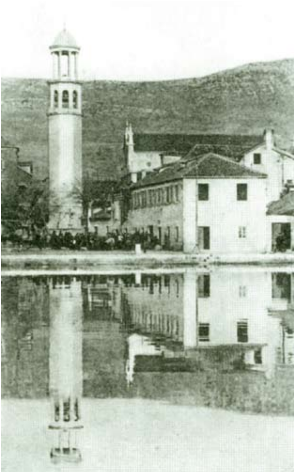
Kaštel Novi, pogled na Andrićev zvonik s početka 20. st., repr. iz knjige M. Duvnjak

zvonik – sigurno najizrazitije i najvažnije Andrićevo djelo, u kojemu je pod stare dane uspio ostvariti nekoliko tema koje je trasirao već svojim studentskim nacrtima.