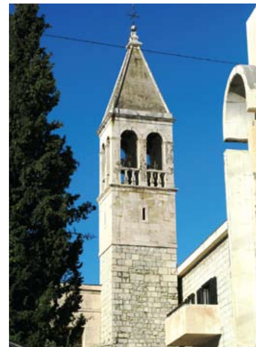
Zvonik Gospe od Zdravlja između korpusa crkve (L. Horvat) i samostana (S. Rožić)

Zapravo, natpis je više urezan nego uklesan, na rasteretnom bloku kamena postavljenom poviše gornjeg praga uskoga prozora, što će reći - ispisan vjerojatno u vrijeme kada je zvonik bio rekonstruiran ili restauriran. Naime, prvospomenuta godina, godina je posvete temeljnog kamena crkve i zvonika, te samostana (koji je tada brojio čak 19 redovnika), na dan sv. Mihovila Arhandela, na 29 rujna 1759., baš u 8 sati izjutra. Spomenica tom prilikom izdana veli: “Poslije mnogih muka, truda i napora dopustila je previšnja