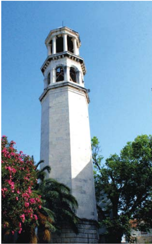
Kaštel Novi, zvonik župne crkve Sv. Petra apostola

zličit bio kontekst u kojemu se nalazi), zvonik na začelju sklopa “katoličkog hrama oblika grčkoga križa” što ga je projektirao još 1815. godine; glori jet, na osam dorskih stupova, s poluguglastom kupolom – poviše lože za zvona (od koje je odijeljen istaknutim vijencem na konzolama) – veoma je slična projektu kružnog glori jeta (ili monopterosa) iz iste godine, koji je uostalom sam Andrić razradio u formi klasicističkog paviljona usred Sustipanskog groblja 1851. Mirni oktogonalni trup zvonika, u bazi je oblikovan u bunjatu širokih sljubnica, kao što to predviđa i Andrićev projekt svratišta iz 1814. godine i neke dvokatnice, 13 ili projekt kuća na splitskoj obali Andrićevog profesora Bazilija Mazzolija iz 1807. Gornji dio, do superponiranih loža na vrhu, ima izrazito glatke plohe besprijekorno izvedenih sljubnica. Sve u svemu: brižno mišljena arhitektonska struktura, van-