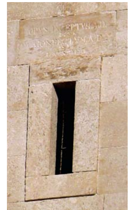
Zvonik Gospe od Zdravlja, natpis na pročelju