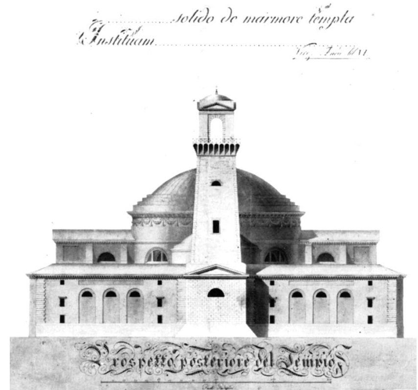
Vicko Andrić, projekt crkve oblika grčkoga križa, začelje, 1815.