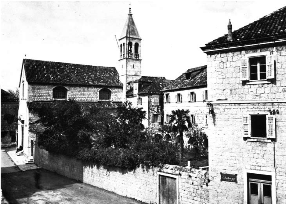
Split, samostan i crkva sa zvonikom Gospe od Zdravlja prije obnove (oko 1935)