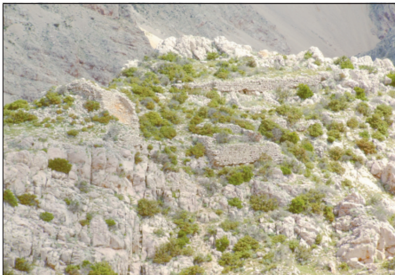
Sl. 10. Pogled na gradinu Šibenik s vrha kanjona Zrmanje