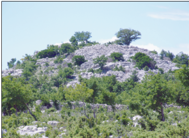
Sl. 4. Pogled na Gradinu kod Zelenikovca s ceste između zaselka Zelenikovac i Vučipolje, sjeverno od Gradine