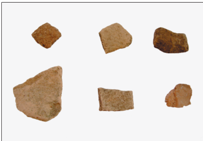
Sl. 11. Ulomci rimske keramike pronađeni na gradini Šibenik