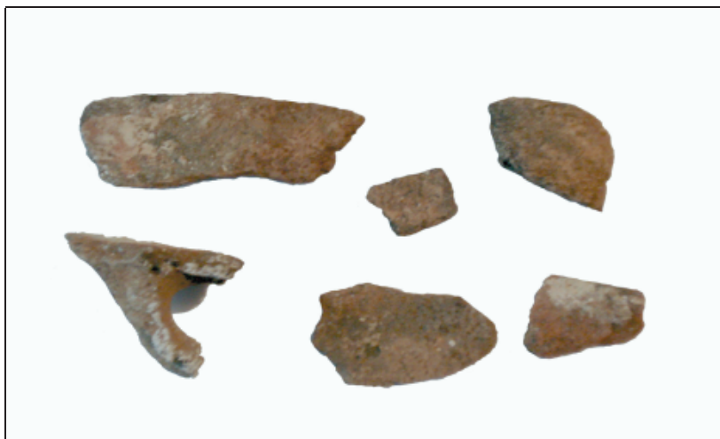
Sl. 1. Ulomci prapovijesne keramike pronađeni na gradini Donja Maslenica