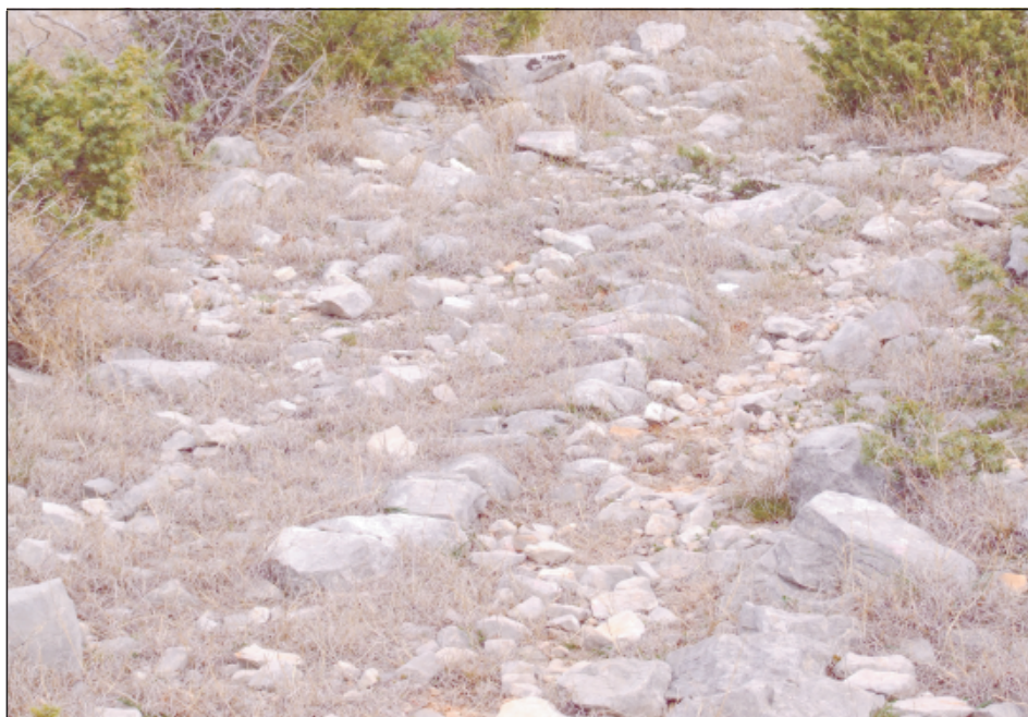
Sl. 3. Ostaci rubnika prapovijesne i antičke ceste na lokalitetu Tesana greda u Jasenicama