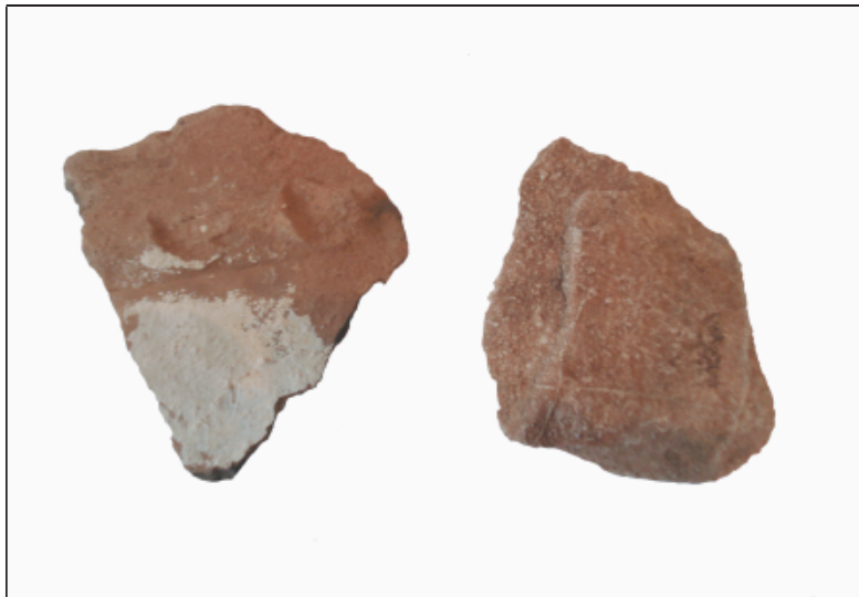
Sl. 8. Keramički ulomci pronađeni na Gradini kod Modrića