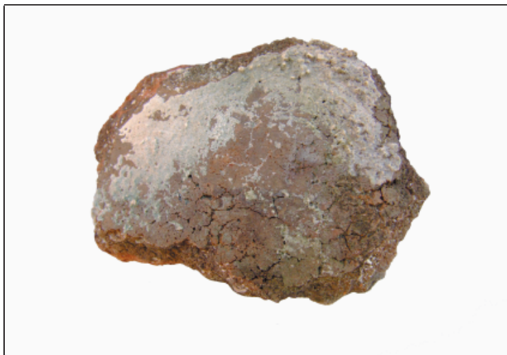
Sl. 5. Keramički ulomak pronađen na Gradini kod Zelenikovca u Jasenicama