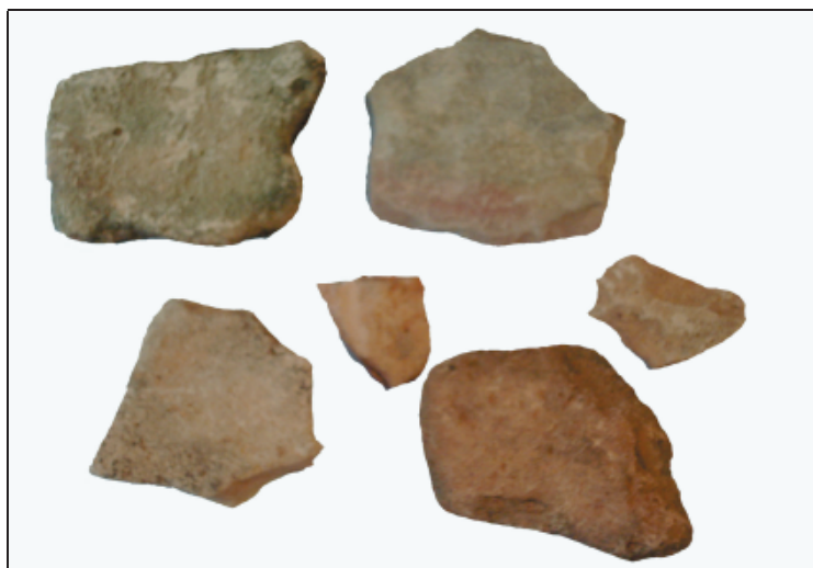
Sl. 2. Ulomci rimske keramike i tegula s naseobinske zaravni ispod gradinskog utvrđenja na Donjoj Maslenici