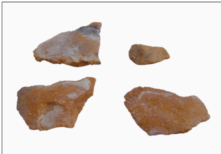
Sl. 6. Ulomci keramike pronađeni na Visokoj glavici