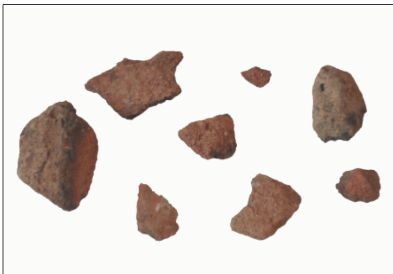
Sl. 9. Keramički ulomci pronađeni na gradini Razvršje