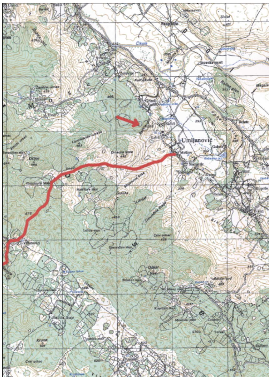
Sl. 7. Trasa rimske ceste od Umljanovića prema Unešiću i položaj Bačića gradine na topografskoj karti M=1:25000