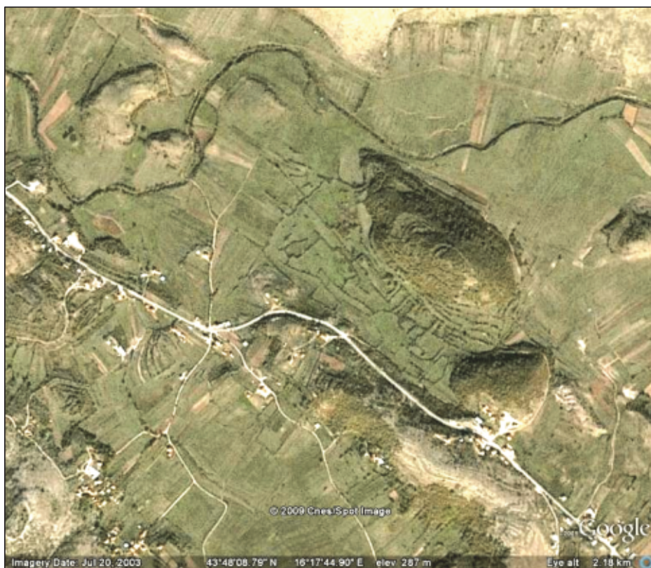
Sl. 4. Satelitski snimak Magnuma