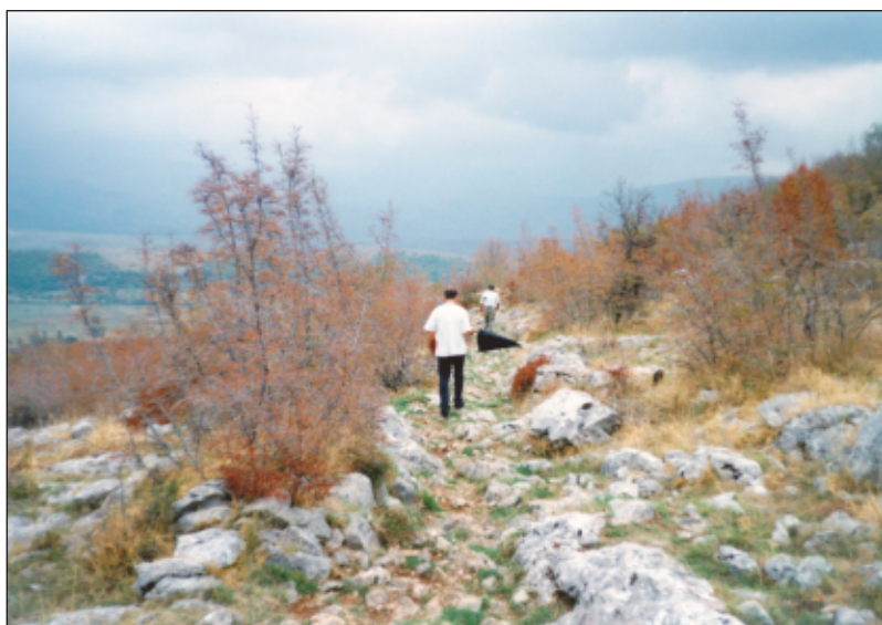
Sl. 5. i 6. Detalji rimske ceste od Umljanovića prema Unešiću