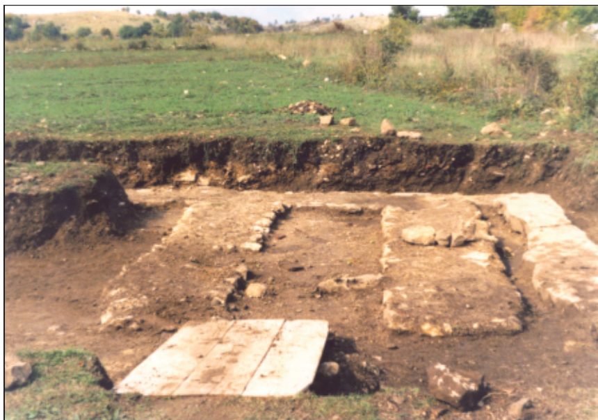
Sl. 2. i 3. Fotografije sonde na lokaciji Krstače