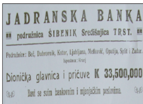
Sl. 5. Reklama Jadranske banke.

Od financijsko-bankarskih ustanova koje su u Šibeniku osnovane ili pak na različit način sudjelovale u gospodarskom životu grada i šireg područja kroz filijalu odnosno podružnicu, može se od 1921. godine pratiti čitav niz njih. Podružnica Jadranske banke u Šibeniku osnovana je 5. kolovoza 1921., a registrirana 27. travnja 1922. godine. Iznos glavnice iznosio je 30 milijuna kruna s nominalnom vrijednošću od 400 kruna po dionici. 132 U prvim godinama obnove šibenskog gospodarstva nakon 1921. godine učešće te banke u financiranju različitog poduzetništva bilo je značajno.