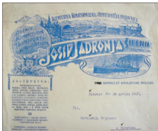
Sl. 2. Memorandum šibenskog špeditera J. Jadronje

U Šibeniku je, osim odgovarajućeg broja industrijskih poduzeća, djelovao i čitav niz manjih industrijskih pogona “koji gradu davaju obilježje razvijajućeg industrijskog centra”. 8 Već se tada aludira na dogradnju Ličke željeznice te ističe novi impuls Šibenika kao “pobuda za osnivanje novih industrija i da će otvoriti nove trgovačke puteve”. 9 Realno je bilo očekivati da će prijenosom sudstva, školstva, zdravstvenih ustanova, kao i dijela upravne vlasti na Šibenik, doći do poticaja za formiranje neovisne Trgovačke komore, budući da se trgovina “razvila među šibenskim i prirodnim zaleđem (Bukovicom i Kotarima)”. 10