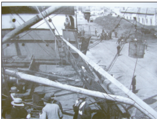
Sl. 3. Utovar boksita na stovarištu Vruļje iz 1928. godine

Nova pristojba za industrijske kolosijeke nepovoljno se odrazila na prijevoz i trgovinu boksita od Drniša do Šibenika. Po njoj je jedna tona boksita u tranzitu od rudokopa do Drniša u dužini 9 km iznosila 28 dinara. Na dužoj relaciji od Drniša do Šibenika iznosila je 21 dinar po toni. Tom računicom na toni boksita do šibenske luke plaćao se za to vrijeme veliki namet od 49 dinara. 64 U Šibeniku se u 1924. i prvoj polovini 1925. godine bilježi veći promet razne robe u izvozu prema inozemstvu.