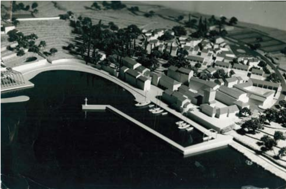
Pogled na maketu rekreacijskog centra Milna-Pasike (maketu izradio Z. Viđak)

U dobro oblikovanoj jezgri naselja stvara se unutrašnja koncentracija. Potrebno je postići najpovoljniji razmještaj prema okolici (zaseoci, susjedna naselja, komunikacije, humanizirani pejzaž i dodir s prirodom u cjelini).