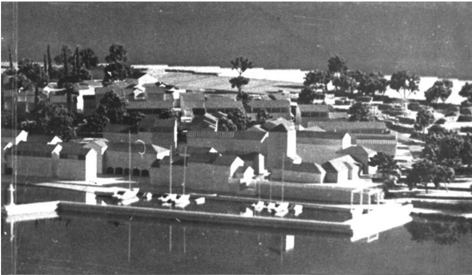
Obalno pročelje rekreacijskog centra Milna-Pasike (maketu izradio Z. Viđak)

Predviđa se izgraditi naselje za povremeni boravak, kapaciteta 1170 ležaja u izgrađenim objektima i 200 ležaja u kampu za prikolice. K tome su bili predviđeni svi nužni sadržaji koji će omogućiti ugodan boravak i život obogaćen raznovrsnim sadržajima: kulturnim, umjetničkim, zabavnim, sportsko-rekreativnim.