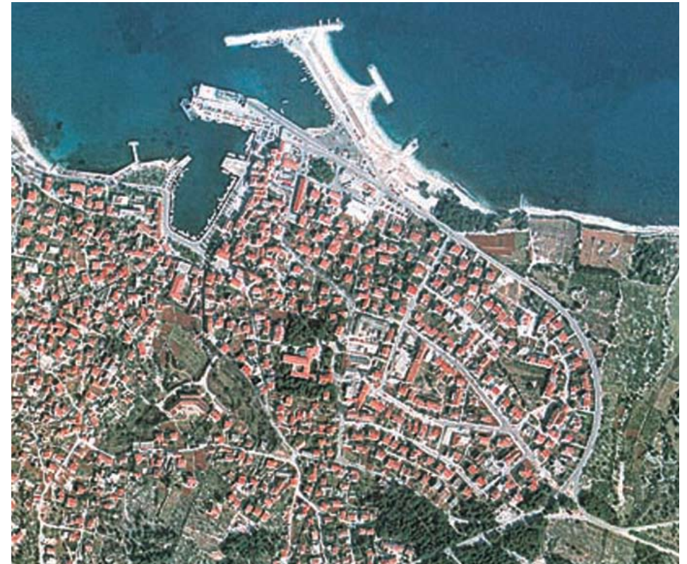
Istočni dio Supetra, ortofoto snimak

koji će nekoliko godina poslije definirati temeljne principe građenja na otoku. 3 Prvi među njima bio je neizvedeni projekt Rekreativnog centra Milna-Pasike u uvali Pasike na južnom dijelu milnarskog zaljeva. Umjesto parcelizacije širokog područja za izgradnju apartmana s tipskim kućama predloženo je razvijanje turističkog naselja ( resort ) s odlikama tradicionalne arhitekture i urbanizma. Vidljiv je utjecaj proučavanja narodnog graditeljstva na arhitekturu, a novost, koja do tada u suvremenom graditeljstvu nije primjenjivana bila je u urbanističkom rasporedu koji je racionalizirao potrošnju prostora na način kako su to radila otočka naselja nastala prirodnim rastom. Iako izgradnja turističkog naselja nije realizirana, rezultati istraživanja na tom projektu primjenjeni su u kasnijim radovima, poput turističkog mini naselja "Kaštil Jela" ili još uvijek avangardnog urbanističkog plana Istočnog Supetra, u kojem se po prvi put modernim pristupom pokušala ostvariti gusto izgrađena mediteranska jezgra naselja podignuta suvremenim metodama, formirajući ulična pročelja i trgovce, nadasve racionalizirajući s trošenjem urbanog prostora. Danas kada se u Hrvatskoj pojavljuju elitne europske projektne kuće sa svjetski renomiranim arhitektima koji pokušavaju na sličan način rješavati potrebu za skupocjenim turističkim prostorima bilo da je u pitanju hotel ili resort , projekt "Pasike" predstavlja dragocijeno