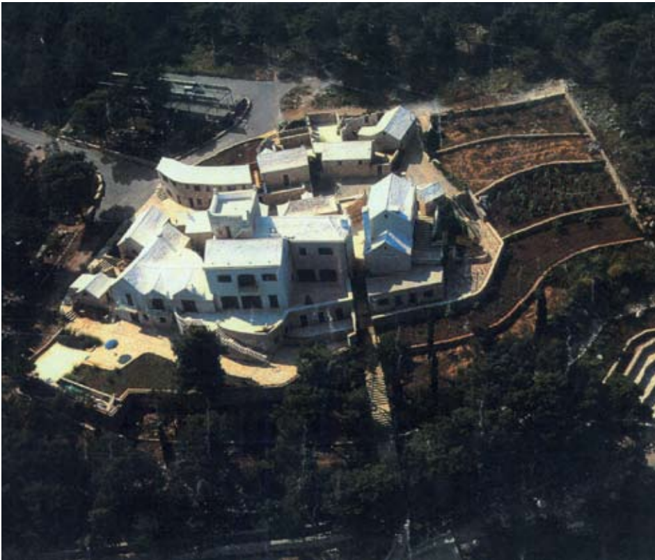
Pogled iz zraka na turističko naselje "Kaštil Jela" u Milni