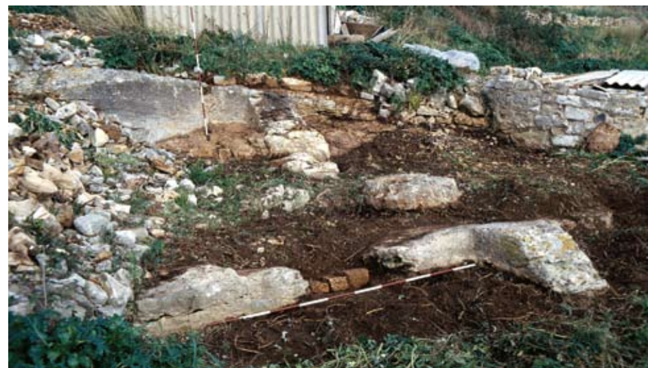
Sl.1 Isklesani temelji kuća u Issi

Issa je sagrađena na južnoj padini uzvisine Gradina kojoj se vrh nalazi na 60 m nadmorske visine. Konfiguracija terena na Gradini nije išla u prilog planiranju grada s pravilnom ortogonalnom mrežom ulica i insula. Kolonisti su morali poštovati princip "izonomije" odnosno jednake podjele kako gradskog područja, tako i polja ( hore ), odakle i proizlazi pravilan urbanistički izgled grčkog polisa. Iako je padina uzvisine Gradina bila zahtjevna za planere grada, odnosno arhitekta, bila je zahvalna za eksploataciju građevinskog kamena. Naime, da bi se na padini brda mogao podignuti pravilno planiran grad, moralo se prvo formirati terase na kojima su podizane insule, odnosno stambeni blokovi.