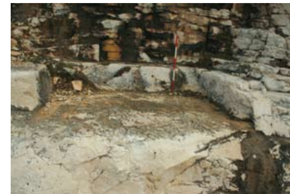
Sl. 3 Tragovi vađenja kamena iz antičkog vremena na sjevernoj strani Srebrene

Sedamdesetak metara od obale pruža se druga litica kamenoloma. Na njoj su vidljivi tragovi novijeg bušenja i miniranja, ona je zarasla u makiju pa je teško utvrditi postoje li u donjim slojevima tragovi antičkog vađenja kamena. Između obale i ove litice nalaze se gomile kamenog šuta koji je ostajao nakon rada u kamenolomu. U jednoj od tih gomila nađeni su 1994. godine ulomci helenističke keramike i metalnih predmeta koji se ovdje objavljuju. Ulomci helenističke keramike nalaze se u presjeku zemlje i kamenog šuta koji se pruža duž plaže. Na površini dominiraju helenistički ulomci među kojima su brojni ostaci gnathia posuda.