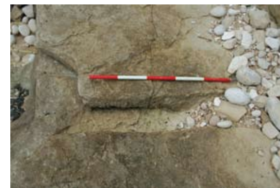
Sl. 4 Ostaci „pašarina“