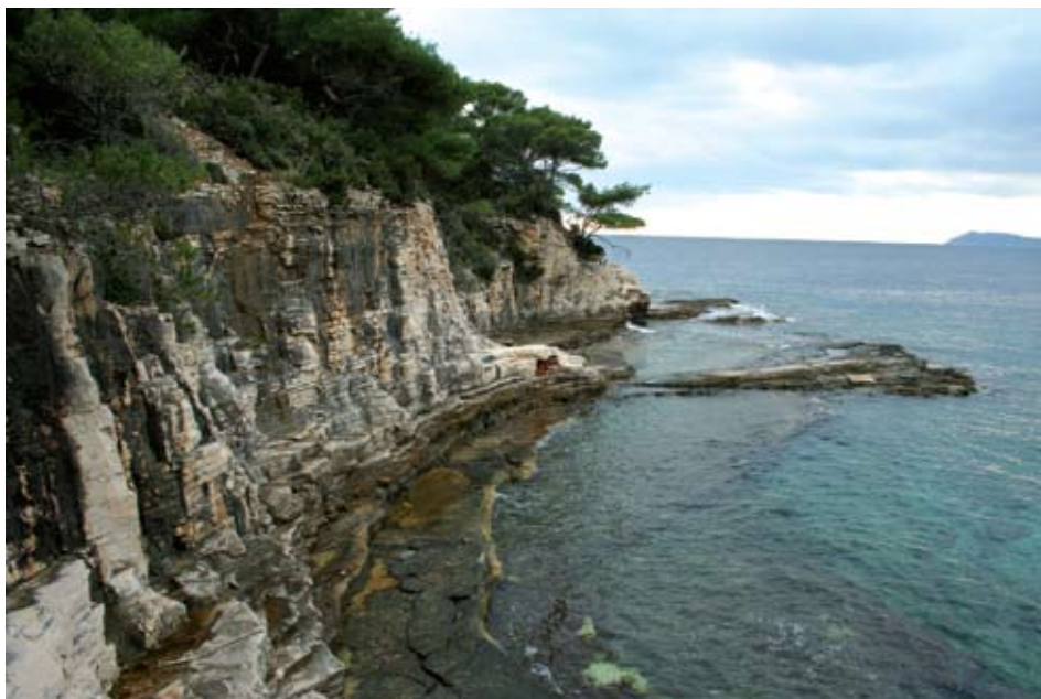
Sl. 2 Pogled na dio kamenoloma u uvali Srebrena

Pravi pravi kamenolom na Visu je otvoren, kako smo gore naveli, u uvali Srebrena udaljenoj oko 7 milja od Isse. U uvali su mogli pristajati brodovi za transport kamena.