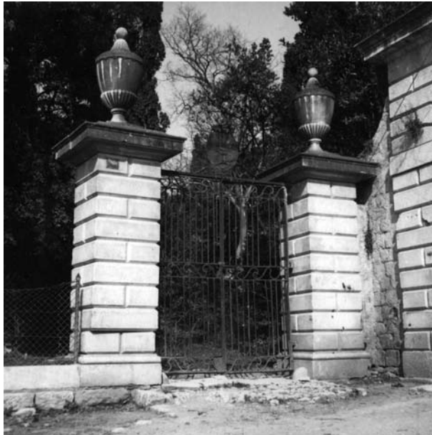
Sl. 4. Pogled na reprezentativni portal podignut 1813. godine. Radove je izveo kamenoklesar Giuseppe Bonomi. (Fototeka Konzervatorskog odjela u Splitu, Arhiva Konzervatorskog zavoda za Dalmaciju, 1957., inv.br. 4106)

Iste godine Garagnini su se odlučili na realizaciju reprezentativnog ulaza u svoj agrarni park. U arhivi pronalazimo precizan ugovor o gradnji glavnoga portala i južnog ogradnog zida, sklopljen u Trogiru 27.