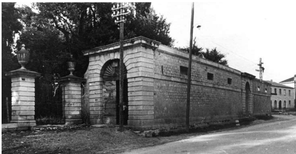
Sl. 2. Pogled s jugozapada na glavno pročelje agrarnog parka Garagninovich. (Fototeka Konzervatorskog odjela u Splitu, Arhiva Konzervatorskog zavoda za Dalmaciju, 1954., inv.br. 70542)

Prema ugovoru, Bonomi je trebao započeti radove spajanja dviju građevina ulaznim portalom, podići zidove zapadne gospodarske građevine kako bi se dobio kat, konstruirati razdjelni i završni vijenac, načiniti prozore, međukatnu i krovnu drvenu konstrukciju s pokrovom od kupe, dok je podizanje istočne, koja je tada služila kao staja za goveda, ostavljeno za neku zgodniju priliku, pa je Bonomi trebao protegnuti razdjelni vijenac do kraja, a završni u duljini od dvije ili tri stope, kao oznaku nakane nastavka. Zane je kamenarske radove trebao pratiti drvodjelskima. Nama značajni podaci pojavljuju se već u prvoj točki ugovora s Bonomijem: novi portal trebao je biti napravljen po uzoru na postojeći sa zapadne strane, nije smio biti uži od 5 stopa i 9 unci, niti sadržavati, kako je stajalo u nacrtu, jedna manja vrata. 7 Lučni portal sa zapadne strane bio je dodan prema spomenutom nacrtu uslijed preobrazbe štale. Obložen je elementima u glatkoj bunji, sa skošenim rubovima tipično za prizemne nivoe klasicističkih građevina. Postament i vijenac na mjestu prijelaza dovratnika u luk naznačeni su istaknutim klesancem ravne plohe i rubova, a portal kruni profilirani vijenac. Zane je trebao obaviti stolarsku pomoć kod obnove krova, sagraditi stepenište, drvene kapke za prozore i unutarnja vrata, te naposljetku vratnice novog ulaza, za koje je bio predviđen zrakasti luk prema onome na postojećim vratima na zapadu.