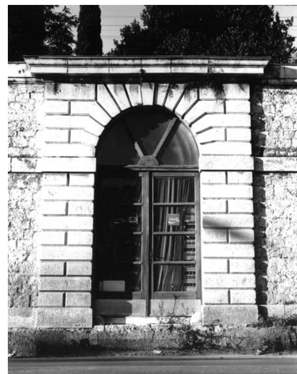
Sl. 3. Pogled na gospodarski portal kojeg je 1811. godine podigao kamenoklesar Giuseppe Bonomi. (Fototeka Konzervatorskog odjela u Splitu, Arhiva Regionalnog zavoda za zaštitu spomenika kulture-Split, foto: Živko Bačić, 1975., inv.br. 34538)

Kako u ugovoru nije navedena godina krajnjeg roka izvedbe, u dosadašnjim je istraživanjima bilo prihvaćeno da se radilo o listopadu 1810., pa je ista bilježena kao godina podizanja gospodarskog portala i zapadne građevine. 9 No to ne bi bilo moguće niti da