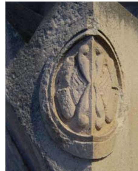
Slika 21. Ornament s originalnog Rendićeva fragmenta

preostalo od klesanih motiva na samom originalu, bilo je moguće izvesti replike uništenih dekorativnih dijelova spomenika.