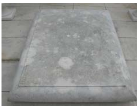
Slika 12. Crne naslage i lišajevi na spomeniku nakon čišćenja