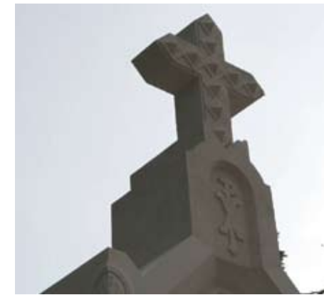
Slika 26. Sam vrh nadgrobnog spomenika nakon obavljenih restauratorskih radova i konačne montaže elemenata u spomeničku cjelinu

Kako bi se obavio ovaj zahvat, također je valjalo upotrijebiti autodizalicu (slika 25), kao i tijekom demontaže istih komada.