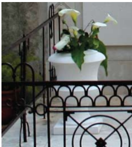
Slika 25. Jedna od dvije novoizrađene kamene vaze, postavljene na kamenom podiju nadgrobnog spomenika