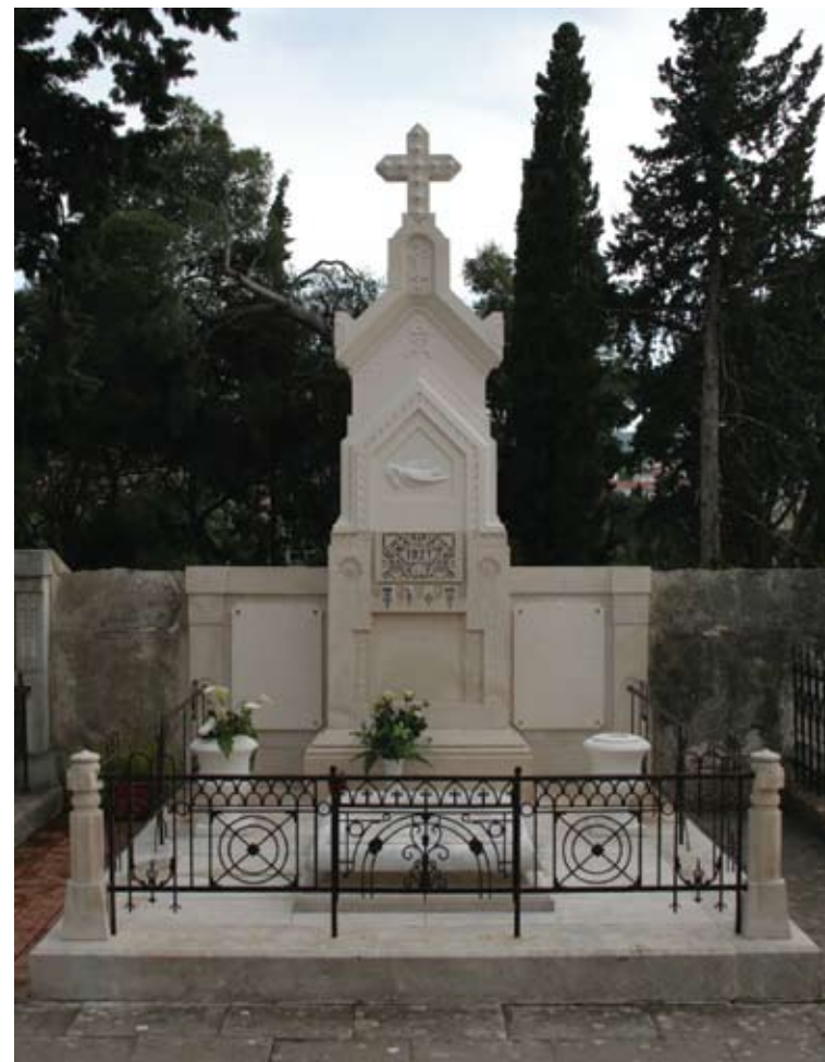
Slika 29. Fotografija nadgrobnog spomenika nakon obavljenih restauratorsko- konzervatorskih radova