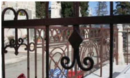
Slika 16. Metalna ograda oko spomenika prije uklanjanja starih slojeva boje

Metalna ograda (sl. 16 i 17) napravljena je u skladu s vremenom u kojem je nastao nadgrobni spomenik, te također u duhu Rendićeva izričaja, no kiše i vrijeme učinili su svoje i ostavili trag, ne samo na željezu, koje je na mjestima propalo, već i na kamenu niz koji se slijevala hrđa.