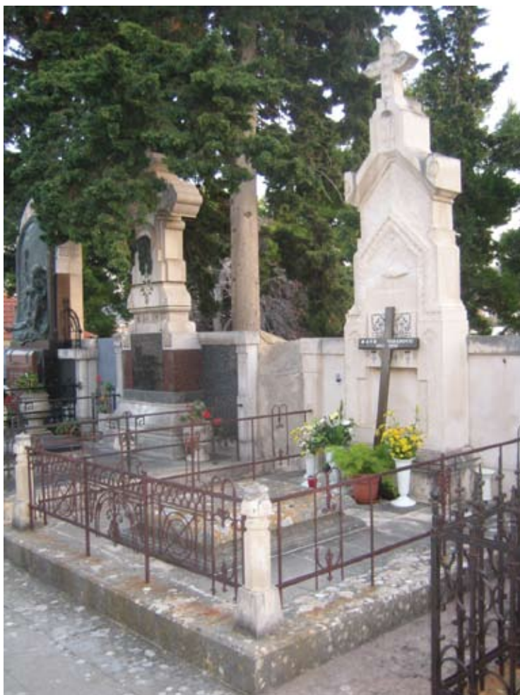
Slika 28. Fotografija nadgrobnog spomenika prije obavljenih restauratorsko- konzervatorskih radova. Zatečeno stanje

Kako bi se izbjegli opisani procesi, kamen je potrebno zaštititi adekvatnim sredstvom namijenjenim za zaštitu i održavanje kamena vapnenačkog sastava izloženog uvjetima eksterijera (djelovanje raznih atmosferilija). Upotrijebljen je proizvod trgovačkog naziva “Seal” namijenjen za impregnaciju kamena izloženog prethodno opisanim uvjetima eksterijera. Zaštitu kamena potrebno je obavljati svakih nekoliko godina.