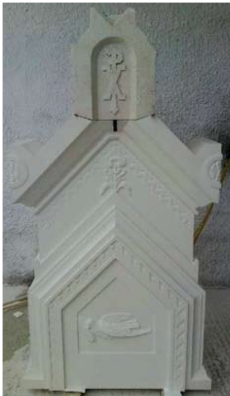
Slika 23. Kamena replika nakon završetka obrade kamena, u kombinaciji s postoljem za križ