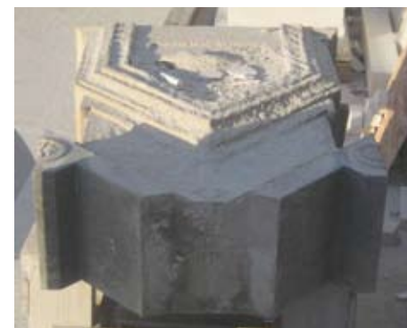
Slika 7. Stari kameni element nakon demontaže je sa supetarskog groblja prenesen ispred klesarske radionice. Čitavo vrijeme je služio kao model pri izradi replike

uklonjen materijal iz svih vidljivih sljubnica između glavnih kamenih fragmenata. Zatim su se pažljivo odvajali dijelovi koji se skidaju uz uporabu autodizalice. Rastavljena tri gornja kamena elementa prevezena su u radionicu na dalju obradu.