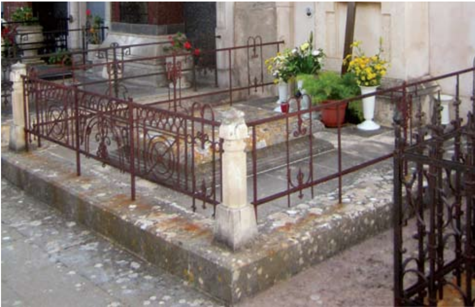
Slika 5. Kameni podij i metalna ograda

Čitav kameni podij prekriven je crnim naslagama i lišajevima, a površina kamena erodirana. I to se dogodilo posredstvom vanjskih utjecaja (atmosferilije) kojima je spomenik izložen. Crne naslage potječu od raznih nečistoća (zemlje, lišća. ...) koje su se, zajedno s prašinom, u periodima vlaženja zalijepile na površinu kamena (slika 5). Karakteristično jest kod ovakve vrste (nadgrobnih) spomenika da crne naslage uvijek brže dobije kamen postavljen vodoravno jer duže ostaje vlažan. Okomite dijelove kiša redovito ispiru od nakupljenih nečistoća, a na sebe vežu samo crne čestice biljnog podrijetla. Tako je bilo i u ovom slučaju, gdje je donji dio spomenika bio vidno crnije boje nego okomiti kameni dijelovi. Vidljivo je, osim crnih naslaga, i nekoliko vrsta lišajeva koje je teško ukloniti s kamena jer gotovo uvijek ostavljaju dubinske tragove i jako erodiraju kamenu površinu.