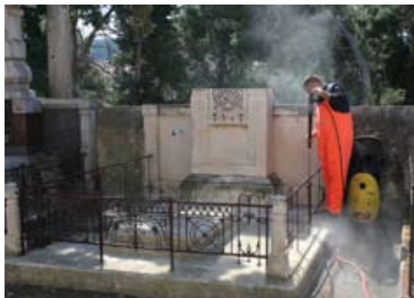
Slika 9. Početak čišćenja kamena pomoću vode i pijeska pod tlakom