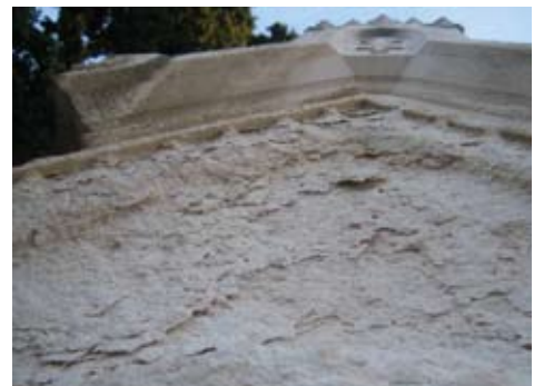
Slika 8. Kamen je vidljivo kontaminiran topljivim solima, zbog čije kristalizacije u porama kamena i dolazi do ovdje prisutnih oštećenja pucanja i ljuškanja kamenih fragmenata