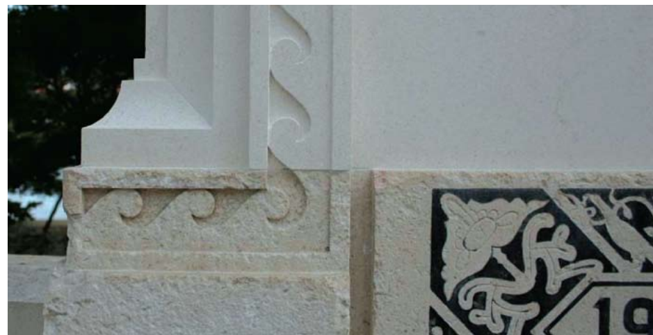
Slika 22. Detalj spoja novoizrađenog i starog komada spomenika

Za realizaciju ovog zahvata bio je potreban veliki, prethodno odležan, kameni blok (vapnenačkog sastava) prve klase i odgovarajućih dimenzija. Pri izradi replike koristili su se tradicionalni alati i tehnike za obradu kamena, kojima se koristio i sam autor, kako bi se u konačnici ostvario isti dojam (slika 19).