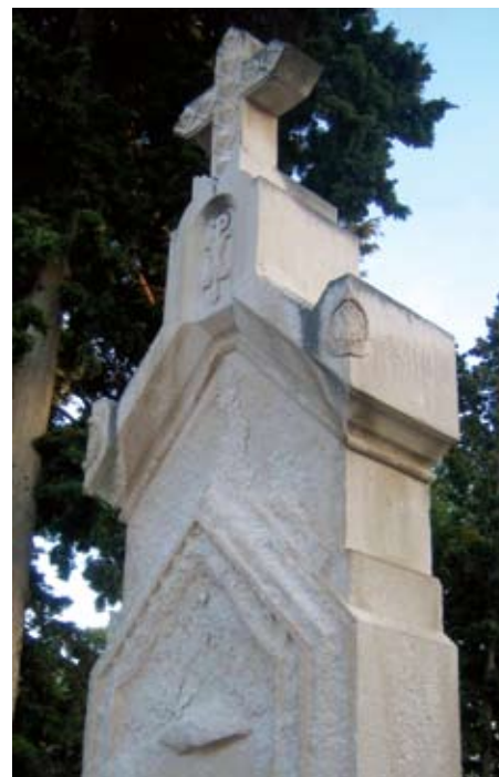
Slika 2. Fragment spomenika oštećen u najvećoj mjeri. Križ, kao i njegovo postolje s Kristovim monogramom, bio je u jako dobrom stanju, kamen nije bio podložan propadanju (kao na centralnom komadu s golubicom), te su i križ i postolje nakon demontaže očišćeni i vraćeni na prvotno mjesto.