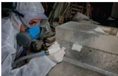
Slika 10. Suho mikropjeskarenje u radionici