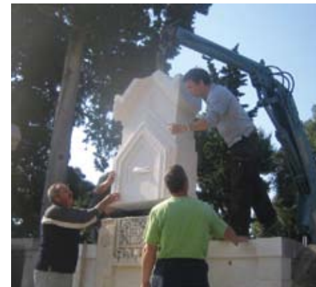
Slika 25. Montaža novoizrađenog komada na mjesto staroga

Nakon izrade novih elemenata, konsolidacije i čišćenja ostalih kamenih elemenata, nadgrobni spomenik moglo se montirati u prvotnu cjelinu. Novi elementi su montirani pomoću nehrđajućih trnova koji se stavljaju unutar kamenih elemenata. Prethodno su napravljene rupe za trnove od nehrđajućeg čelika (Ø 8 mm, dužina 12 cm), unutar rekonstruiranog dijela i unutar originala. Osim što su spojeni trnovima, lijepljeni su fleksibilnim mortnim ljepilom za kamen (tvorničkog naziva Kerafleks).