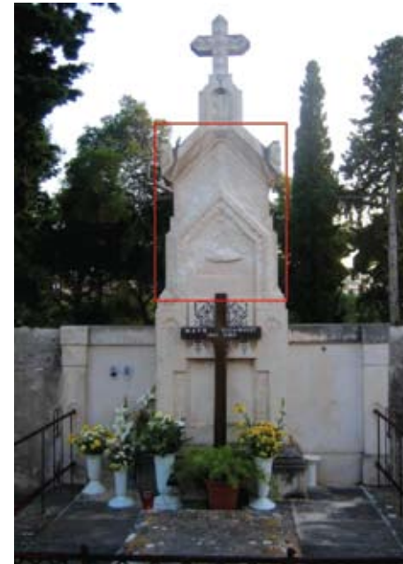
Slika 6. Crvenom bojom na slici je označen kameni element koji je demontiran te je izrađena njegova replika

Gornje dijelove spomenika, koji su u potpunosti izgubili funkcionalnu i estetsku ulogu u nadgrobnom spomeniku, trebalo je demontirati (slike 2, 6 i 8). Potrebno je naglasiti kako je sam križ na vrhu spomenika, s postoljem, bio u jako dobrom stanju. S ta