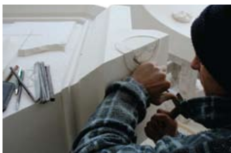
Slika 19. Replika originalnog komada u tijeku izrade

Demontirani fragmenti spomenika služili su kao predložak za izradu novih komada. Na donjem elementu bio je isklesan motiv goluba (simbolika Duha Svetog), a na gornjem vjerojatno jedan od sličnih ornamenata kakvi se provlače u ostatku dekorativnih elemenata spomenika. Oba motiva bila su uokvirena ukrasnim profilom. U konzultaciji s prof. Kečkemetom, uvidom u stare fotografije koje nam je velikodušno ustupio te uvidom u ono što je