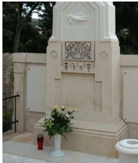
Slika 24. Dvije nove kamene ploče s imenima pokojnih obitelji Vodanović, nakon montaže na sam spomenik

Od novoizrađenih kamenih elemenata napravljene su i dvije ploče s uklesanim imenima pokojnika i s jednostavnim ukrasnim rubom, kako bi se uklopile u cjelinu spomenika te bile u skladu s umjetničkim izričajem (slika 24). Također su isklesane i dvije kamene vaze pojednostavljene dekoracije (slika 25).