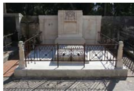
Slika 15. Donji dio nadgrobno spomenika nakon završene prve faze čišćenja (mokro pjeskarenje)

Na fotografijama 11 i 12 vide se dijelovi spomenika prije i nakon čišćenja površine kamena. Istim pjeskarnikom (trgovački naziv "Rotec 2000") uklonjeni su i tragovi boje sa željezne ograde, te tragovi korozije koja se slijevala s ograde po kamenom podiju.