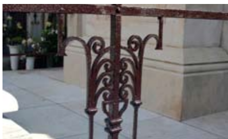
Slika 18. Isti detalj sa slike 17 nakon konačne zaštite željezne ograde

Kao što je navedeno u poglavlju o čišćenju kamena, većina slojeva stare boje uklonjena je pjskarenjem. Ostatak boje u utorima uklonjen je pomoću željeznih četki, skalpela te kemijskim sredstvima koja su namijenjena uklanjanju korozije s metala (slika 17). Zatim je na površinu metala nanovo nanosena odgovarajuća boja za metal (slika 18). Cilj je spriječiti korodiranje metalne ograde jer korozija uvelike uništava kamenu građu, odnosno ostale dijelove grobnice.