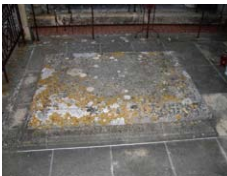
Slika 11. Crne naslage i lišajevi na spomeniku prije čišćenja

Nakon što su ispjeskareni svi osjetljivi dijelovi na spomeniku, postojle se čistilo upotrebom vode i pijeska pod pritiskom. Tom metodom uklonjeni su i neki lišajevi s kamena, a također i manje biljke iz kamenih spojnica.