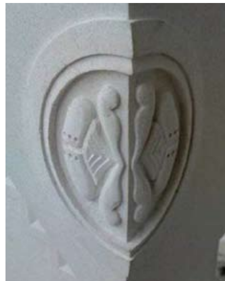
Slika 20. Novi ornament izrađen kao vjerna kopija originala