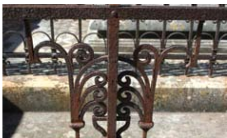
Slika 17. Detalj željezne ograde nakon uklanjanja stare boje, neposredno prije nanošenja nove boje