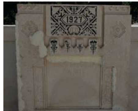
Slika 13. Iznimno osjetljivi dijelovi spomenika koji su se naknadno dočišćavali kemijskim oblozima. Nakon čišćenja kamen je konsolidiran adekvatnom impregnacijom kako bi se zaustavilo propadanje