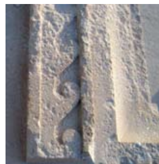
Slike 3 i 4. Neki od karakterističnih dekorativnih ornamentata i prisutna oštećenja