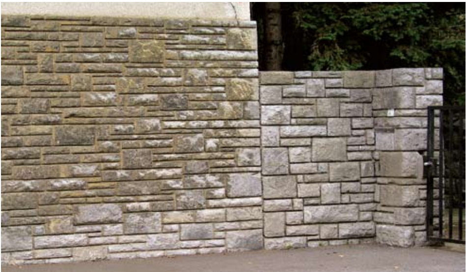
Sl. 6. Lipovečki vapnenac zahvaćen oksidacijom

Dok su žuta i crvena obojenja vapnenaca postojana, siva i posebno crna obojenja su nepostojana. Sivi i crni vapnenci su ponajviše obojeni ujednačenim ili promjenljivim udjelom raspršene organske tvari. Pod djelovanjem atmosferilija oksidiraju i izblijede, gube svježinu, postaju svijetlosivi, puni svijetlih mrlja. Takvi varijeteti kamena nisu pogodni za ugradnju na vanjskim površinama. Njihova dekorativnost dolazi do punog izražaja prilikom oblaganja unutrašnjih površina. Izrazito dekorativni crni litiotis vapnenac s ostacima školjke Lithiotis problematica (sl. 5 lijevo) i tamnosivi do crni lipovečki vapnenac (sl. 6) pogodni su za unutarnja oblaganja. Cjelokupna masa lipovečkog i litiotis vapnenca, impregnirana je finom bituminoznom organskom tvari. Osjetljivi su na utjecaj egzogenih čimbenika. Prirodna tamnosiva boja lipovečkog vapnenca, sporadično crna i plavkasta na vertikalnim vanjskim površinama, ovisno izloženosti atmosferilijama,