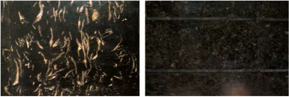
Sl. 5. Crni litiotis vapnenac s ostacima školjke Lithiotis problematica (lijevo) i brački vapnenac rasotica (desno) ugrađen na unutrašnju vertikalnu površinu

i crne boje, ovisno o udjelu organske tvari, fosilnog kršja te udjela i odnosa ferio i feriona željeza. Vapnenci mogu biti i zelenkasti uslijed primjesa glaukonita.