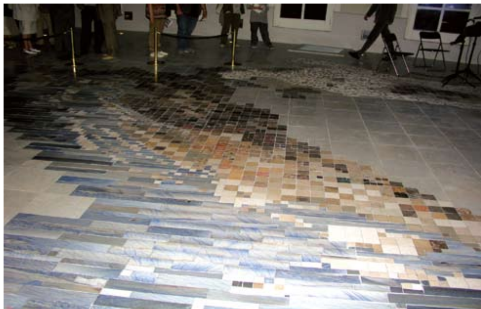
Sl. 3. Kamenospisna geološka karta Hrvatske

Pigment i boja metamorfnihi stijena potječu iz magmatskih i sedimentnih, koje su prethodno bile podvrgnute metamorfozi. Nijanse obojenja pojedinih varijeteta gnajsa i škrljevca nalik su boji magmatskih stijena iz kojih su nastale. Sadrže iste, nepromijenjene i relativno postojane pigmente. Sedimentne stijene pri metamorfozi pretrpjet će znatne promjene boje. Obojeni vapnenac uslijed sadržaja fino raspršenog limonita, dat će bijeli mramor s nekoliko raspršenih zrnaca hematita te ponekad magnetita, ovisno o promjeni oksidacijskih uvjeta. Organska tvar tamnosivih i crnih vapnenaca metamorfizirat će u koncentrirane i izdužene crne nijanse grafita unutar bijelog mramora.